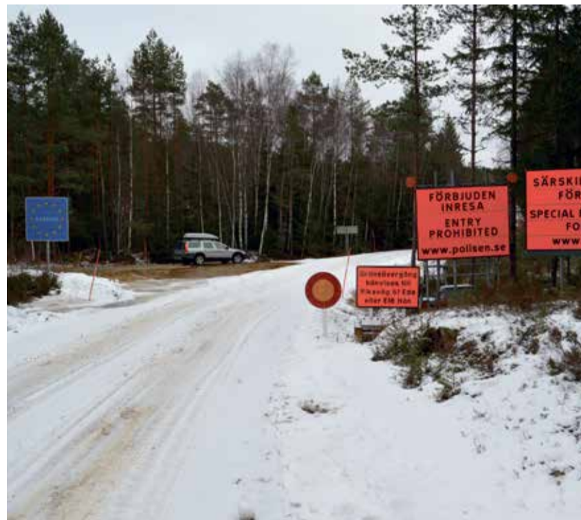
Slik så det ut på Väingsfjellet i Øymark sist vinter. Strengt forbudt å reise inn til Sverige. Motsatt vei var det helt åpent.