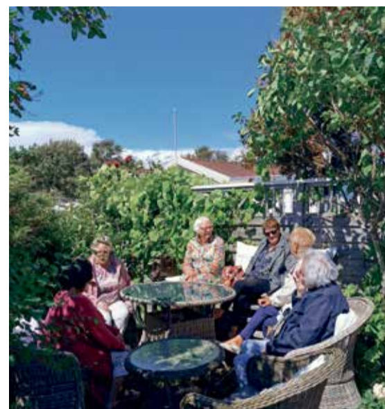
En hyggelig pause i vakre Gustavsfors, mellom Årjäng og Bengtsfors.