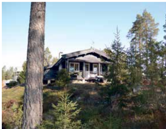
Ikke så rart at storfamilien Gimmingsrud stortrives som hytteeiere i Marker.