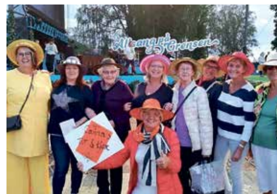
«Tut & Kjør»-gjengen storkoste seg med Allsang på Grensen i Halden.