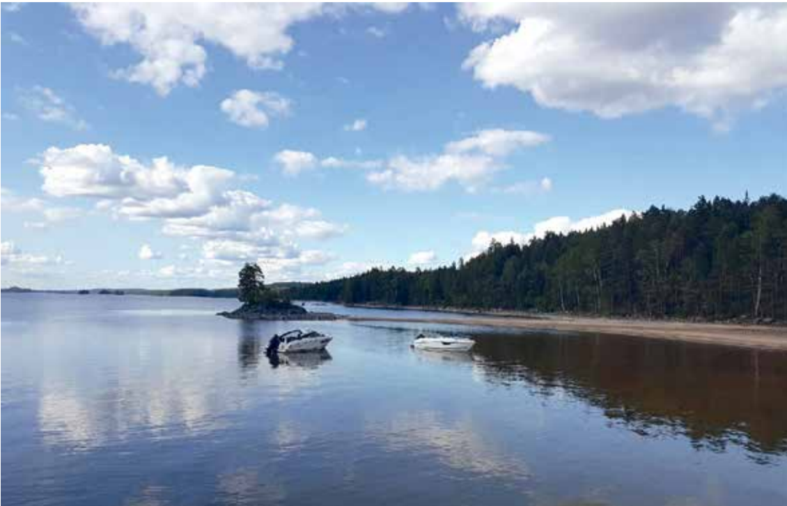
Idyller som dette finnes det mange av.