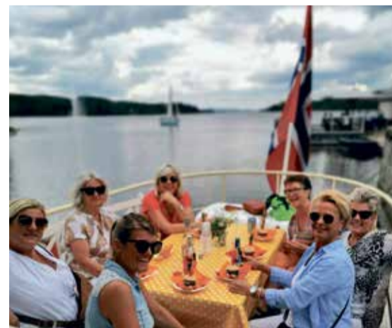
Det er hyggelig også på hjemlige trakter. Her fra BåtCafeen i Ørje.

– Jeg elsker å prate med folk, og jeg elsker å se at andre har det bra. Det er god motivasjon for meg. Søkkrik blir jeg ikke av dette, men målet er at det går rundt. I tillegg driver jeg med coaching, og vi er avlastningshjem hver tredje helg. Det er godt å ha noe å gjøre, og det er givende å gjøre noe som gir andre glede og trygghet, sier hun.