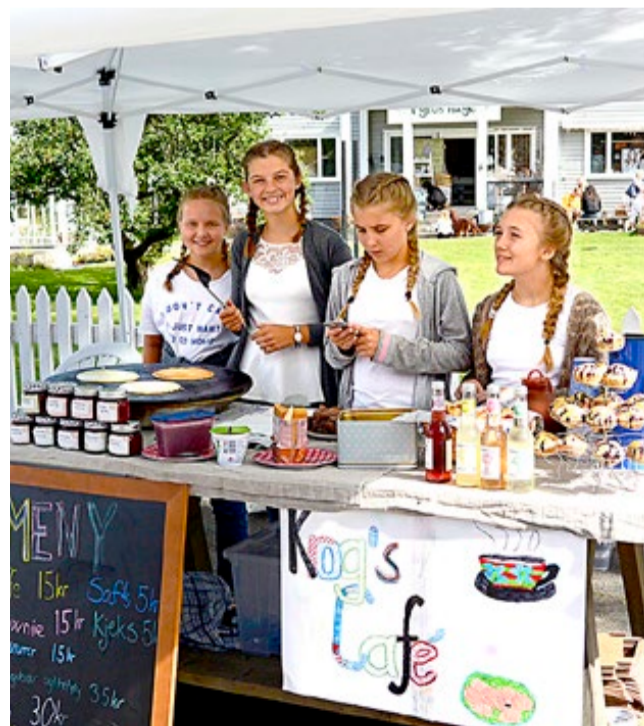
Disse blide jentene betjente Krog's Café midt i Storgata.