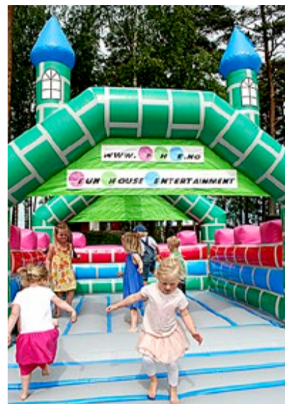
Hoppeslott er alltid spennende.