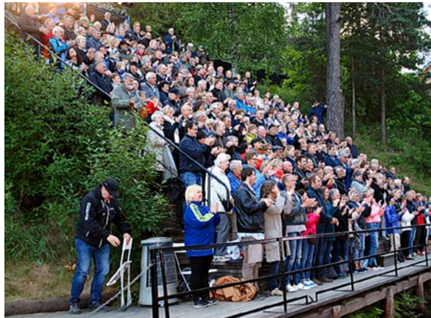
Årets Soot-spel i Ørje sluseamfi trakk elleve fulle hus i juni og juli.