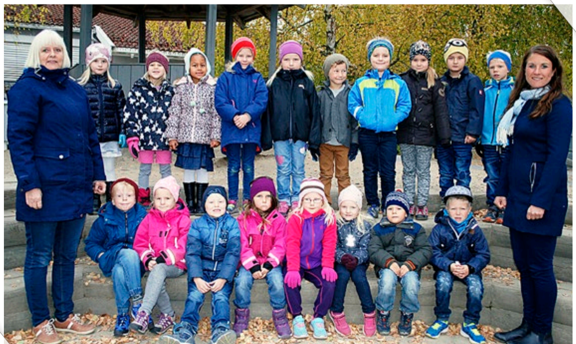
Marker skole 1B