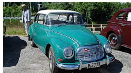
Utstilling av gamle biler er et morsomt innslag under festivalen. Her en Auto Union, et bilmerke som midt på 60-tallet skiftet navn til Audi.

Vi vet ikke om Slusefestivalen kunne skilte med publikumsrekord, men det vil i så fall ikke overraske oss. Den gode oppslutningen og den flotte stemningen må ha gitt arrangørene den vitamininnsprøytingen man sårt trengte. Det lover godt for neste sommer. Med like fint vær tror vi de aller fleste mer enn gjerne vil besøke Slusefestivalen igjen.