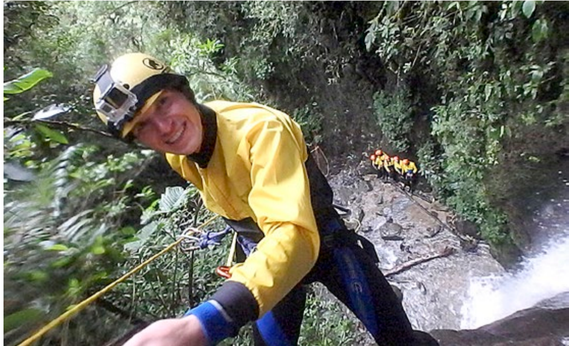
3-2-1 og så bar det utfor stupet i nesten 10 meter fritt fall.