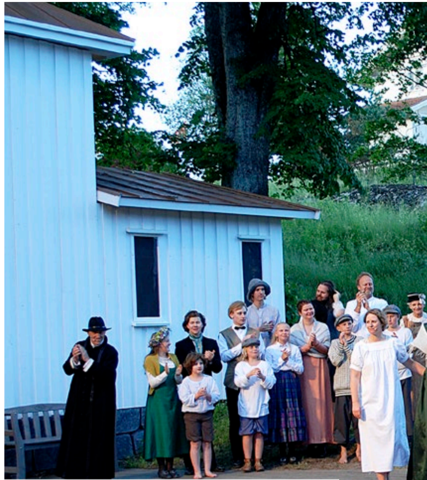
Ensemblet mottok stående applaus etter at nok en forestilling av Soot-spelet er gjennomført på en imponerende måte.