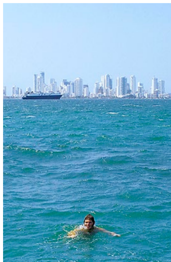
Et forfriskende bad med Cartagenas fasade noen sjømil bakenfor.

I det minste sørge det for at vi våkna tidlig nok til å få en halv dag på stranda der de yummie kokosnøttene ikke hang langt fra hverandre.