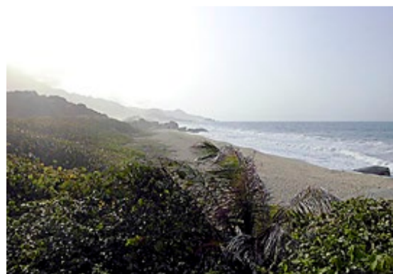
I Tayrona nasjonalpark ligger denne strandperlen. Siden bading er strengt forbudt, ble det dessverre ingen mulighet for en dukkert her.

Ifølge de strikse parkreglene var det 1) kun lov å telte på anviste plasser og 2) strengt forbudt å båle. Så vi måtte pent bryte opp og forlate campen til fordel for en langt mindre eksotisk teltplass. Ettersom madrassene våre var for store å drasse på, ble natta i teltet en ganske hard opplevelse, selv om vi hadde skrapa sammen en haug løv for å lage et noenlunde mykt underlag.