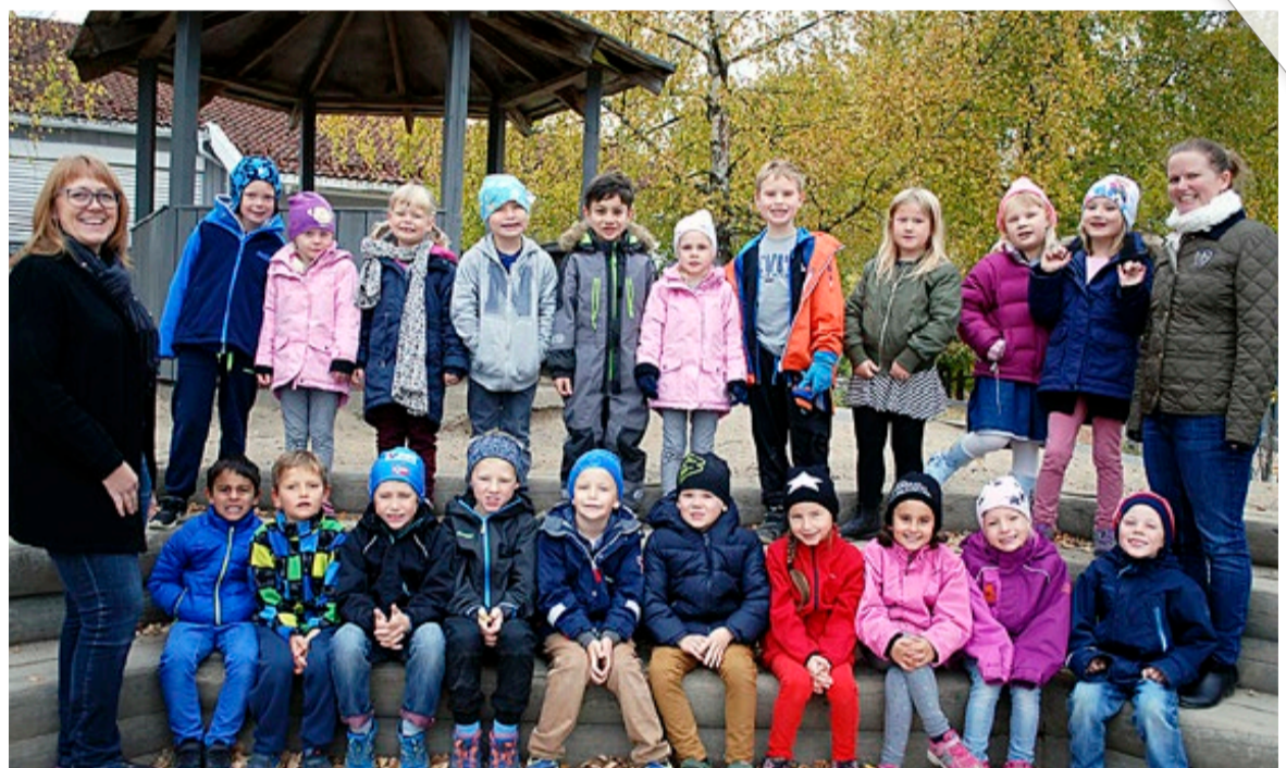
Marker skole 1A