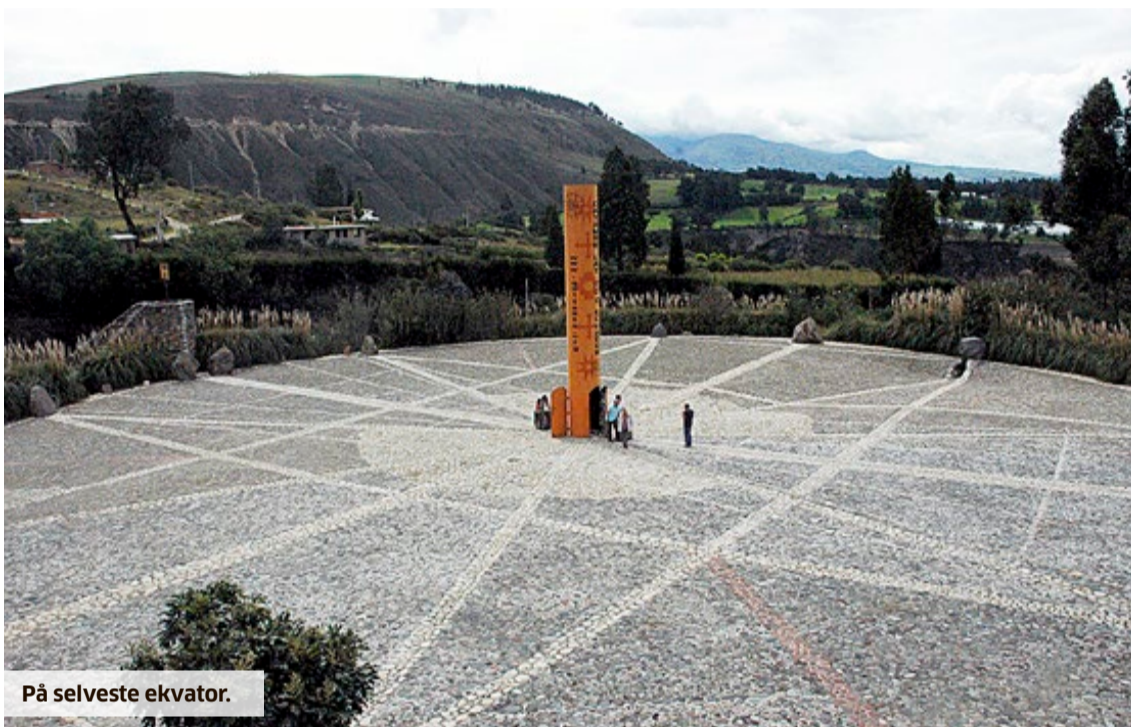
På selveste ekvator.

Etter å ha vært i Cartagena i Colombia i nærmere en måned var det på tide å komme seg videre for å se litt annet enn hav på alle kanter. Før vi dro, skulle oppholdet avrundes med nok en seilas, og denne gang skulle vi teste ut hvordan båten kunne hankses med åpent farvann.