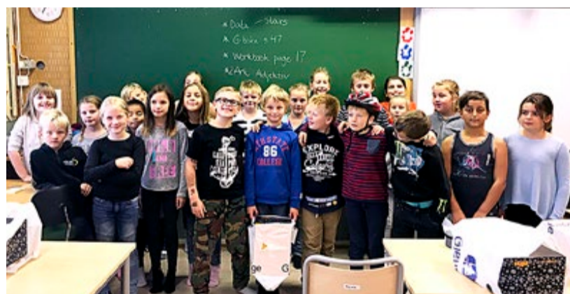
Årets fjerdeklassinger på Marker skole har fått sykkelhjelmer fra Gjensidige Marker, slik barn i Marker har fått i snart tjuufem år.

I et kvart hundre år har Gjensidige Marker delt ut sykkelhjelmer til fjerdeklassinger i distriktet. En populær gave med stor nytteverdi.