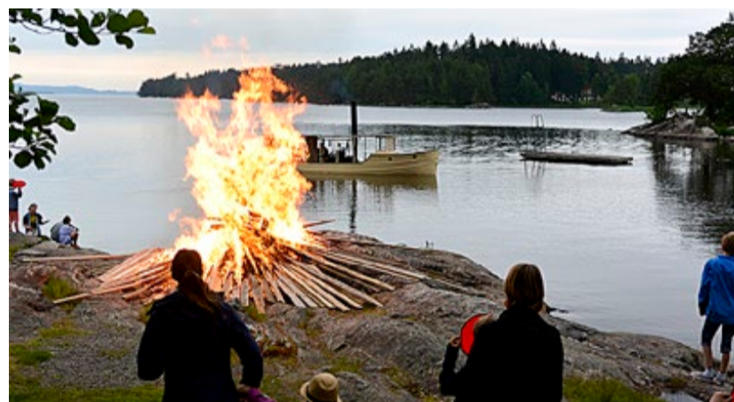
Stemningsfullt med bål og sankthansfeiring i Tangen.