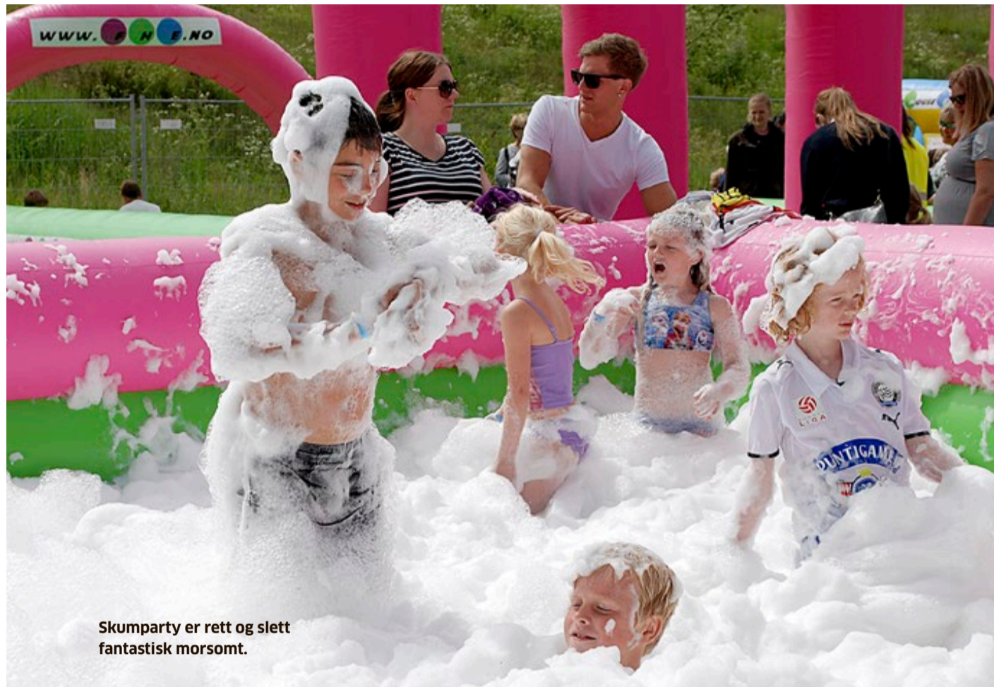
Skumparty er rett og slett fantastisk morsomt.

BESØKSADRESSE STORGATA 55, ØRJE. TLF. 6981 0180