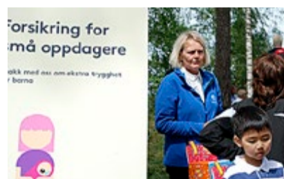
Det lokale forsikringselskapet benyttet anledningen til å snakke om blant annet barneforsikringer.

Festivalen ble arrangert i samarbeid med Gjensidige Marker, Nilsen Sport og Elektrisk, Marker Sparebank, Smaalenenes Avis, 1st Tan og Rema 1000.