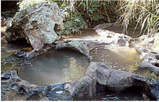
Elva i San Gil byr på snasne badekar som er ypperlige for å kjøle seg i på varme dager.

ring enn tyveri. Mens ettermiddagsdukkerten stod på programmet, lå lommeboka igjen i shortslozma i bilen. Med tanke på at folk var så hyggelige og porten var stengt på nattetid, kombinert med den labre restauranttrafikken på to-tre gjester i gjennomsnitt pr. dag, hadde vi følt oss ganske trygge og blitt sløvere til å låse bilen når vi var i nærheten.