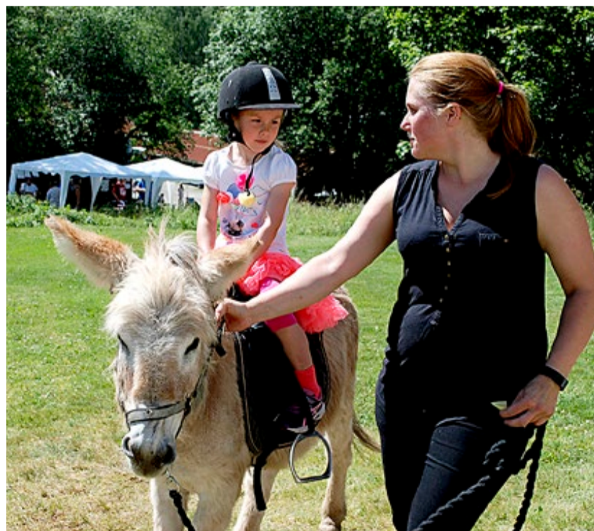
Barn og dyr er en uslåelig kombinasjon. En ridetur på esel er både morsomt og eksotisk.