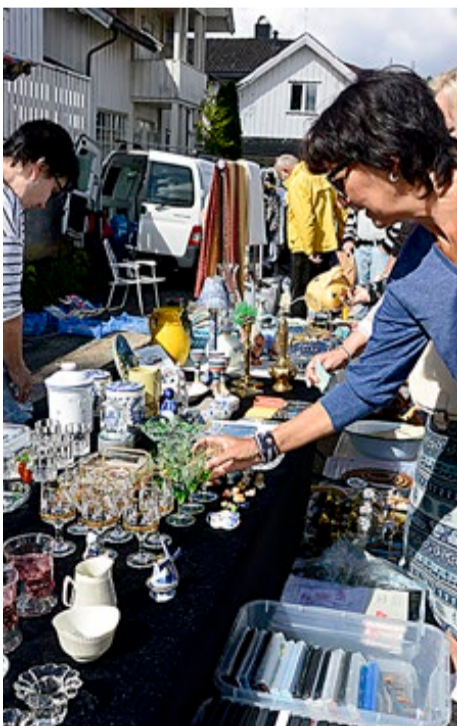
Det var mange muligheter for å gjøre et godt kjøp fra de mange salgsbodene.

Et yrende folkeliv preger Ørje denne sommerdagen.