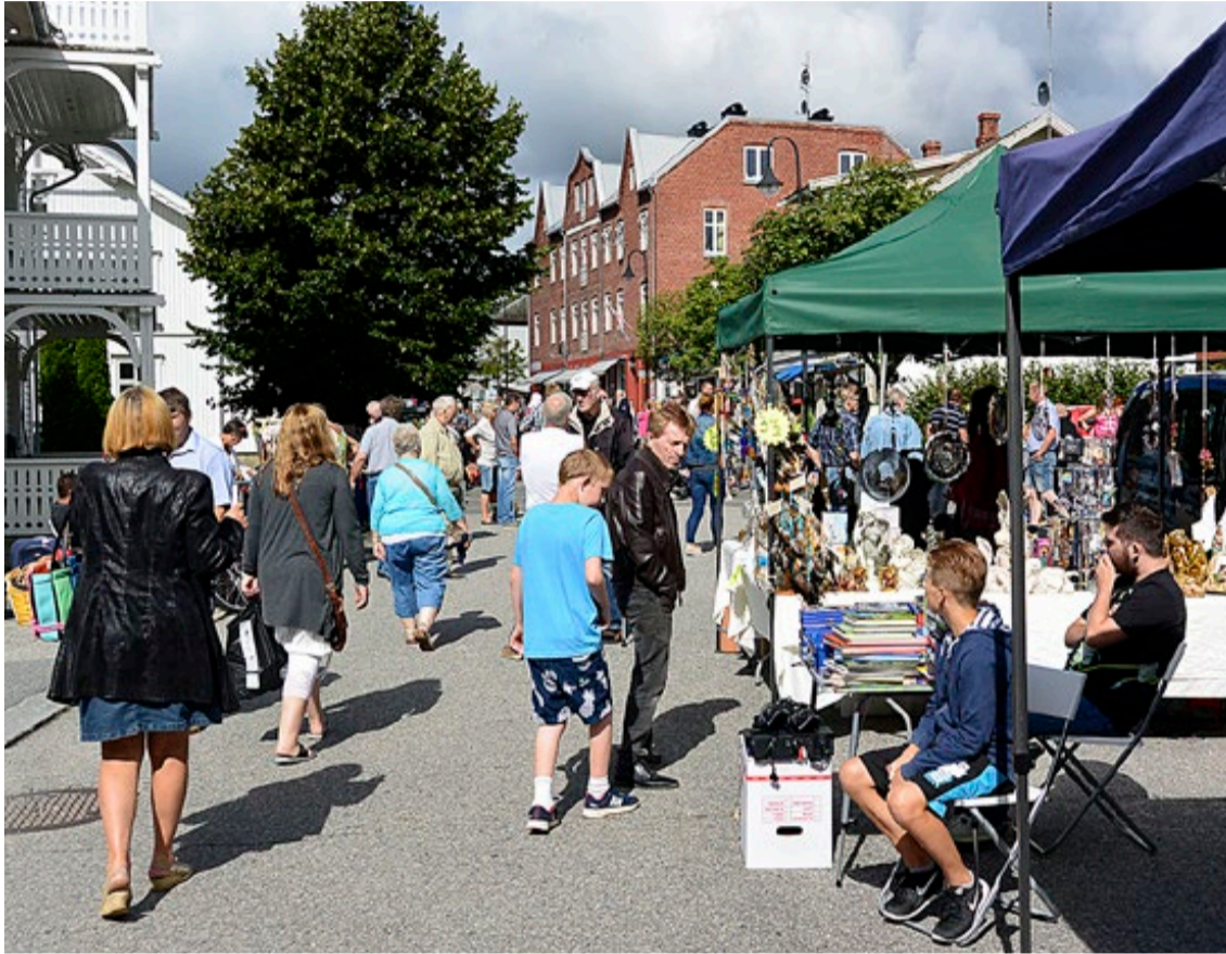
Sydlandsk stemning i Storgata under frimarkedet i Ørje siste helg i juli.