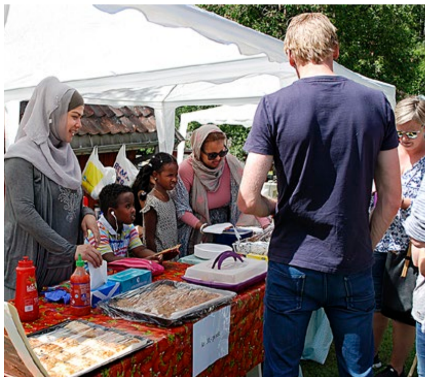
Mat er en viktig del av Slusefestivalen. Her tilbys spennende retter fra Usbekistan.