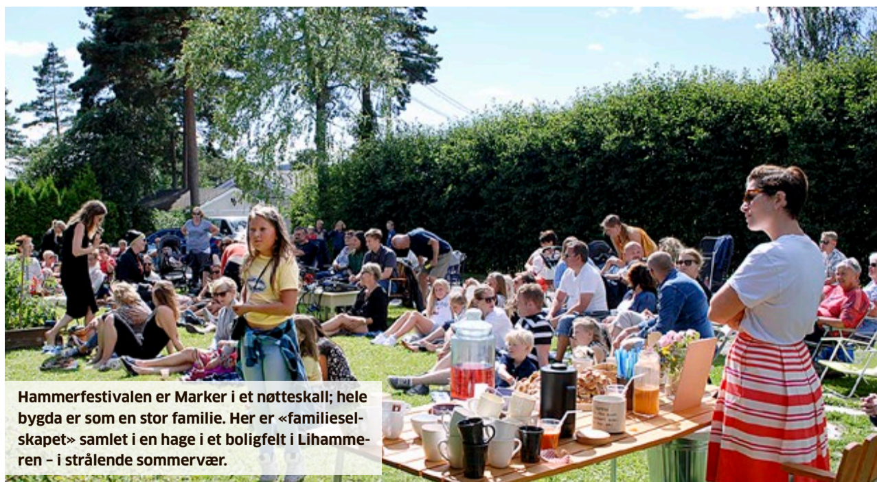
Hammerfestivalen er Marker i et nøtteskall; hele bygda er som en stor familie. Her er «familieselskapet» samlet i en hage i et boligfelt i Lihammeren – i strålende sommervær.