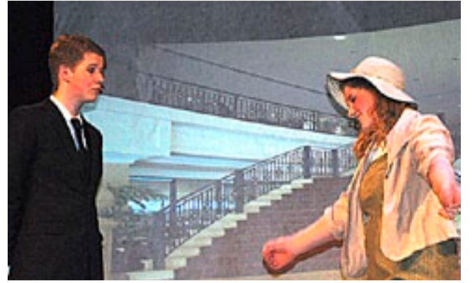
Elevene i niende klasse ved Marker skole leverte en imponerende tolkning av musikalen «The Sound of Music».