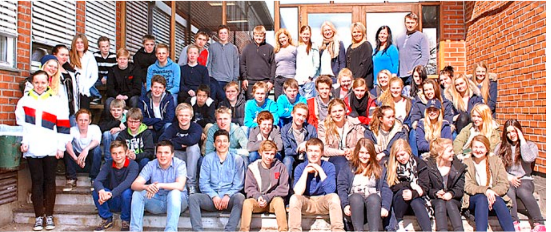
Vel blåst! Elevene i niende klasse ved Marker skole kan puste ut og nyte vårsola etter en hektisk måned med forberedelser til den store «Sound of Music»-forestillingen som ble en kjempesuksess.