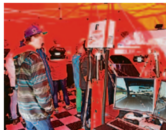
I et provisorisk telt kunne store og små kose seg med fersk kjøring på avanserte datamaskiner.

Vårmonstringen i fjor ble til i anledning åpning