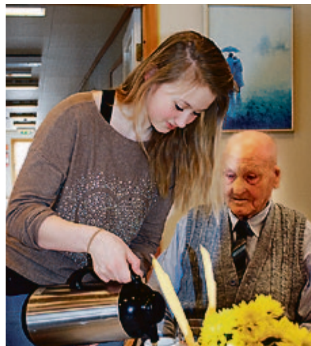
Elevene gjorde en strålende innsats med oppvartingen.