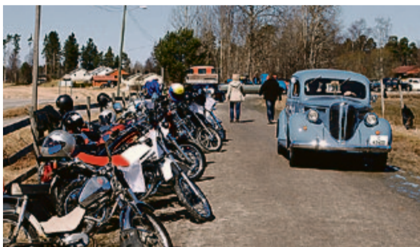
Hele travbanen i Aremark sentrum var stappfull av motoriserte kjøretøyer i alle varianter.