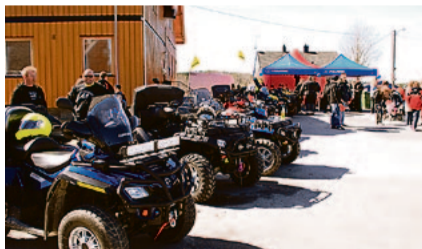
Utenfor Fosby skole fikk ATV-entusiastene masse flott å se på.