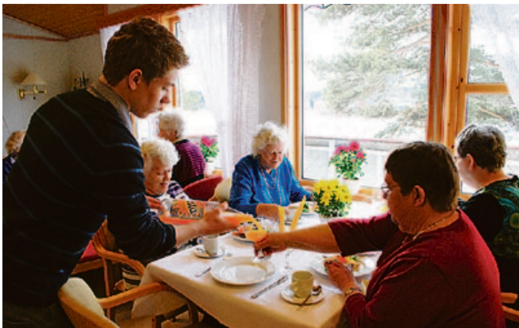
Aremarks eldre garde kunne også i år kose seg med masse god mat, laget og servert av bygdas niendeklassinger.