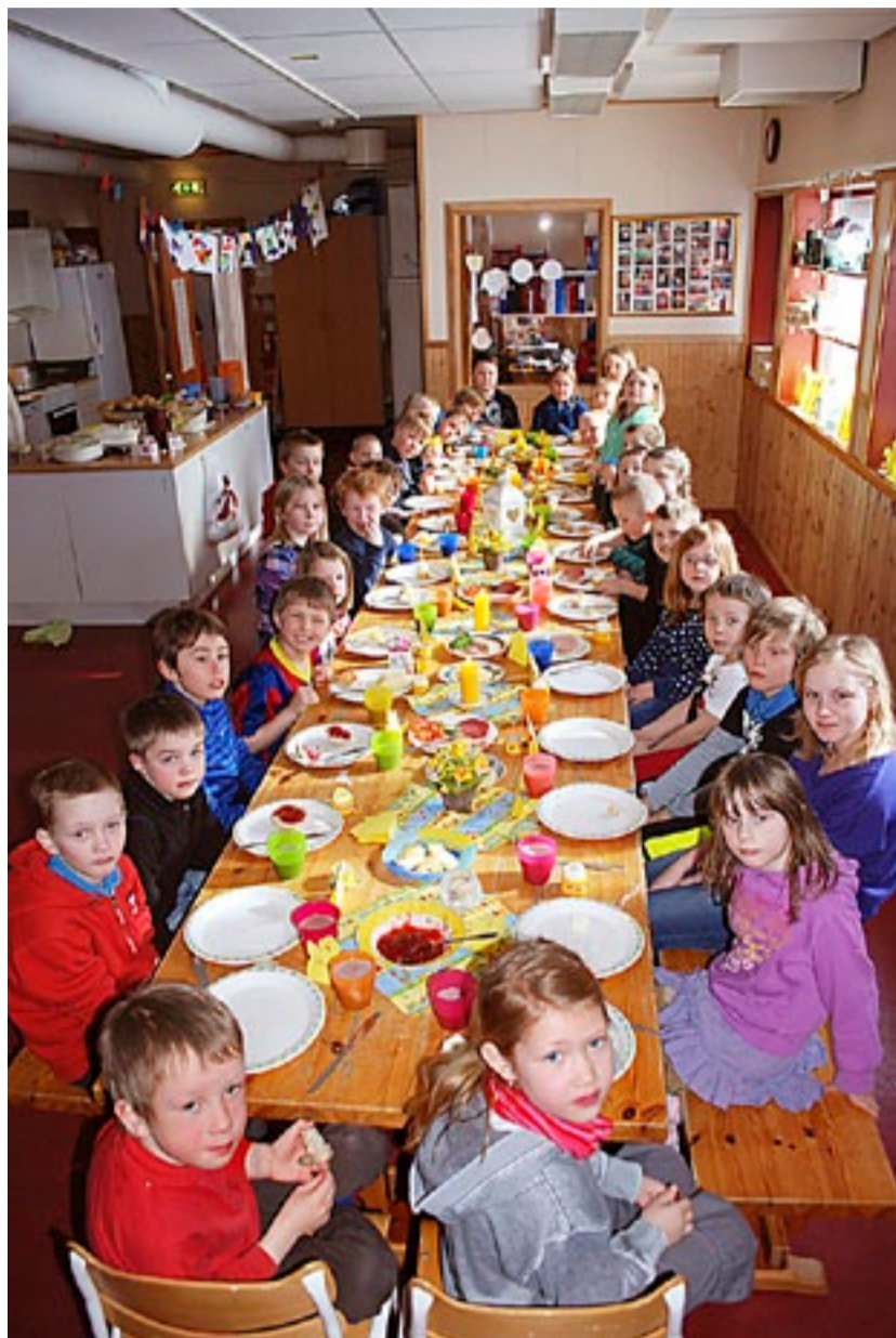
Elever i småskolen i Aremark koste seg med påskelunsj, og maten smakte fortreffelig.

Fra 1. mai må alle hunder ha eget pass, med veterinærattest på gjennomført ormekur, før de får komme tilbake til Norge etter et utenlandsbesøk. For oss i grensenære strøk kan dette by på mange utfordringer. Heretter er det altså ikke godt nok med egenerklæring. Har du ikke papirene i orden, blir hunden avvist på grensen.