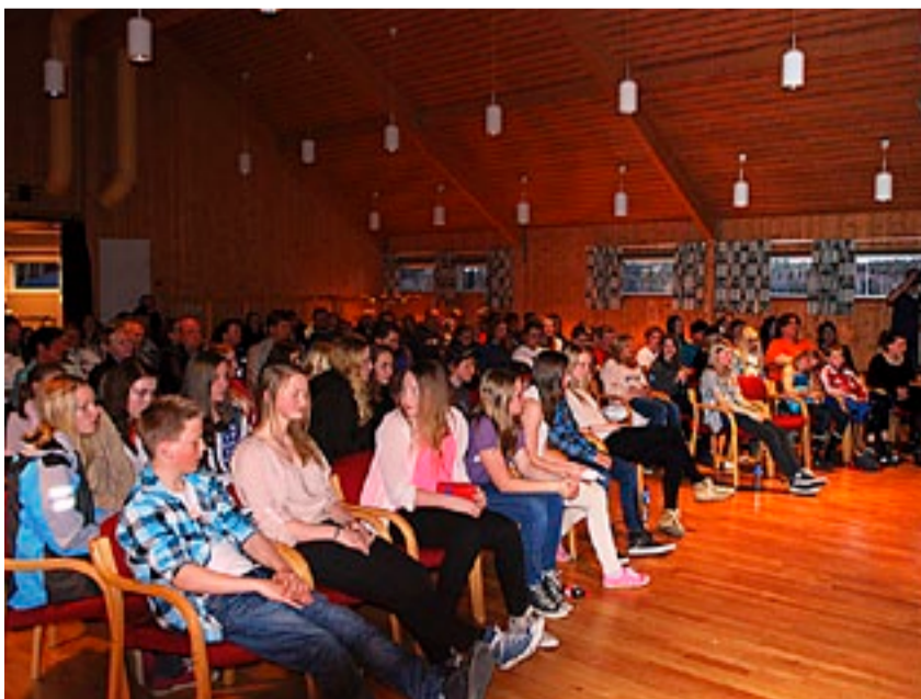
Stor stemning og nesten fullsatt storsal på Furulund da Aremark arrangerte sin kvalifisering til HaldenTalentet.