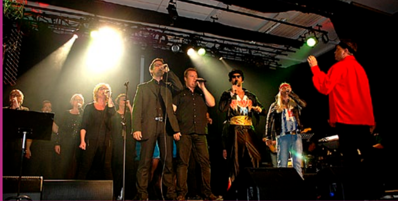
Åpningsshowet var forrykende. Korslagvinnerne viste at de fortsatt kan.