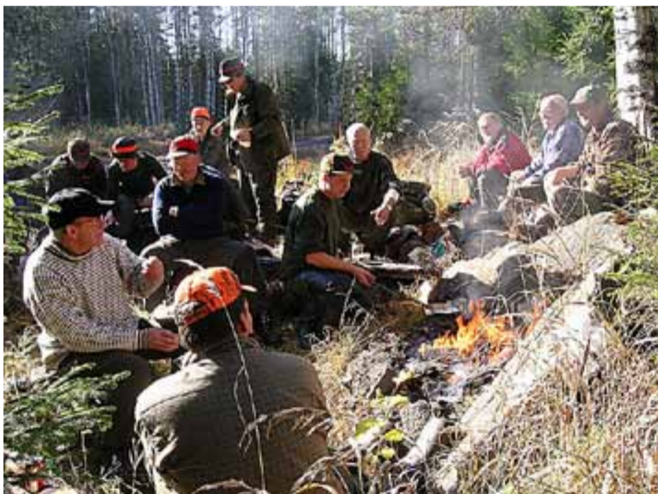
Elgjakt handler om kameratskap og gode naturopplevelser. Dette bildet er fra et jaktlag i Rømskog

D agens elgjegere i Grenseland har kvoter satt opp i samarbeid med kommunens viltforvaltning. For å sikre en bærekraftig stamme skal bare enkelte dyr tas ut. Vi har i det siste snakket med jegere som har fortalt historier som: «Seks elger gikk forbi posten min, men det var ikke disse vi skulle ta ut, så jeg slapp dem videre». En annen sa «vi har fire dyr igjen på kvoten, men vi avslutter jakta nå. Så kan stammen bygge seg opp». Dette er toner fra ansvarsfulle jegere. Det lover godt for fremtiden. Jakt og fiske vil være en viktig del av Grenseland også i fremtiden. Hvis da ikke ulven, som jegerne lenge har fryktet, gjør rent bord i skogene våre.