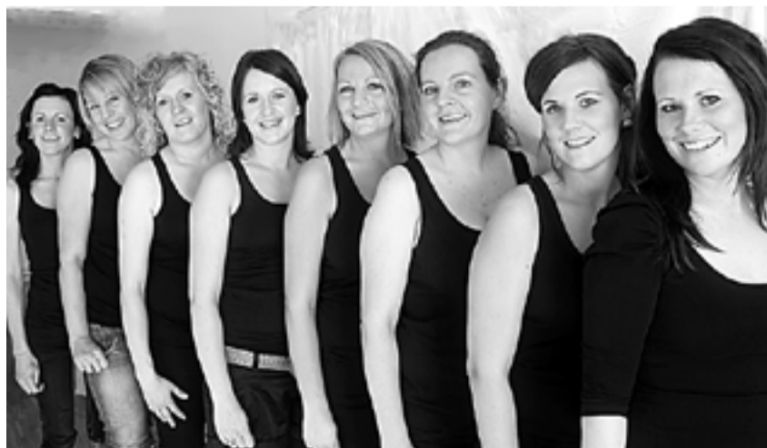
Søsterflokkene som utgjør Sound of Sisters gleder seg stort til ny julekonsert i Marker rådhus på første søndag i advent.

Sound of Sisters skuffer ikke sitt publikum, men inviterer også i år til førjulsconsert i Marker rådhus.