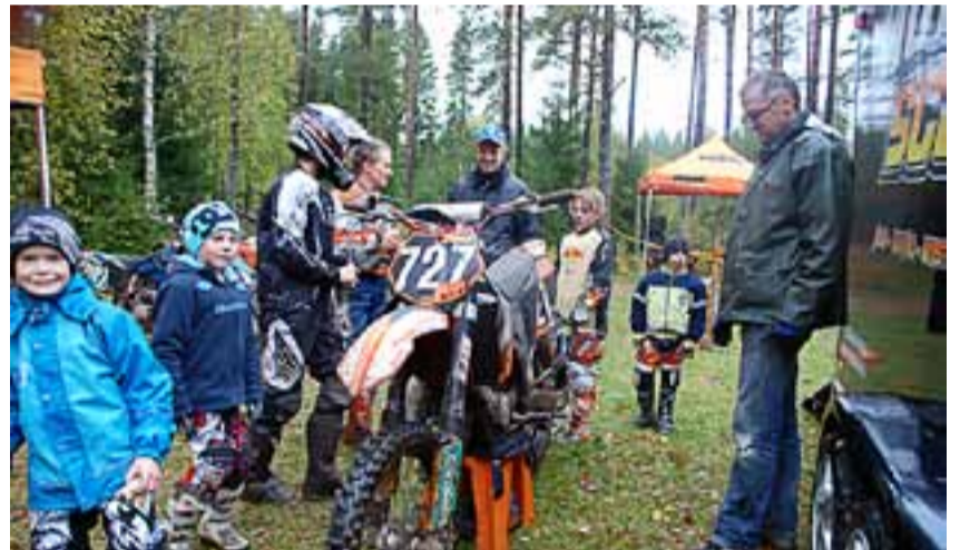
Etter kjøringen gikk praten livlig.

Rømsjingenene er naturligvis lommekjent i området. For andre med interesse for enduro kan det være på sin plass med en nærmere stedsangivelse: Karsby ligger langs riksvei 21, mellom Rødenes og Rømskog sentrum.