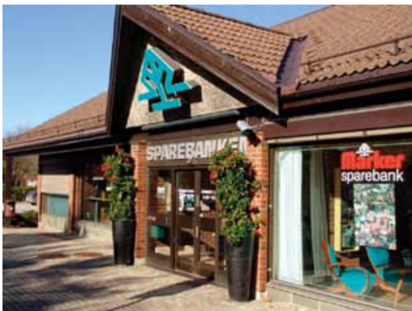
Storgt. 59, Ørje

Hvis du ikke allerede har gjort det, bør du skaffe deg en lokal og god bankforbindelse