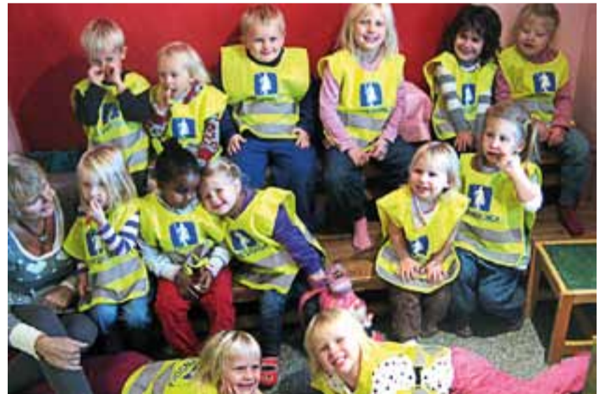
Engasjerte barn i Annen Etasje Barnehage på Ørje har fått nye refleksvester og refleksbrikker.

Storgt. 63, 1870 Ørje. Tlf. 69 81 14 88. E-post: post@studsrud.no