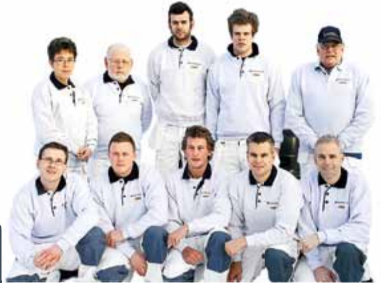
Malermestere, malersvenner, dekorasjonsmalere og lærling står til tjeneste