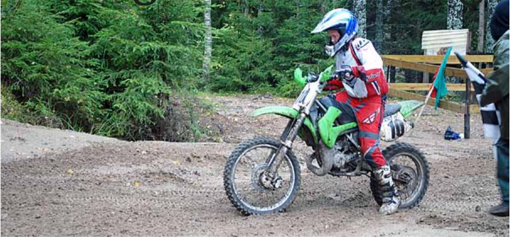
Små og store endurokjørere fikk prøve seg på den nye banen på Karsby.

Etter to år med utallige dugnader og stor innsats fra flere hold, kunne motorsportungdommen i Rømskog i slutten av september feire åpningen av den nye endurobanen på Karsby.