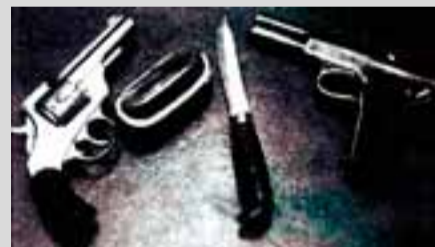
Våpnene som ble brukt under drapene på de to lensmennene på Ringerike.