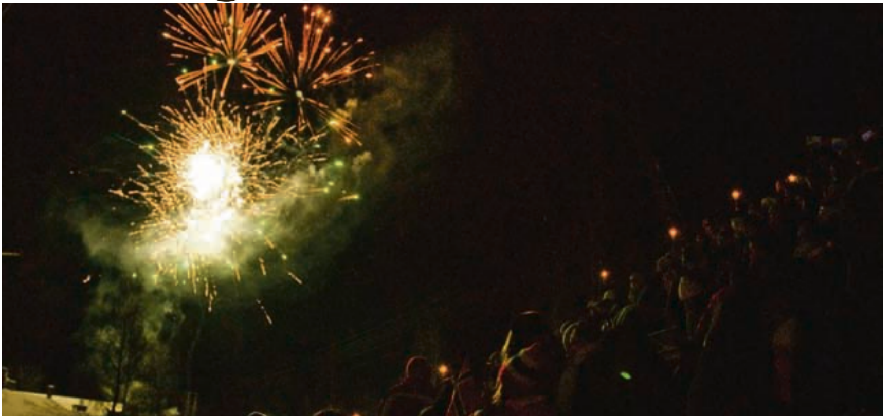
OL-festen i slusene i Ørje var en suksess og ble avsluttet med fargesprakende fyrverkeri.

Det er klart gull hadde smakt best. Men når Ørje har en av sine egne på startstreken til noe så stort som et OL, samles store og små til fest og fyrverkeri uansett.