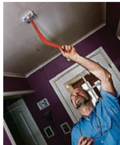
Trykk på knappen på røykvarsleren for å se om den virker.

Han forteller at det finnes to typer røykvarslere. Ionisk, eller såkalt flammevarslere, eller optisk, som også blir kalt ulmevarslere. Sistnevnte er