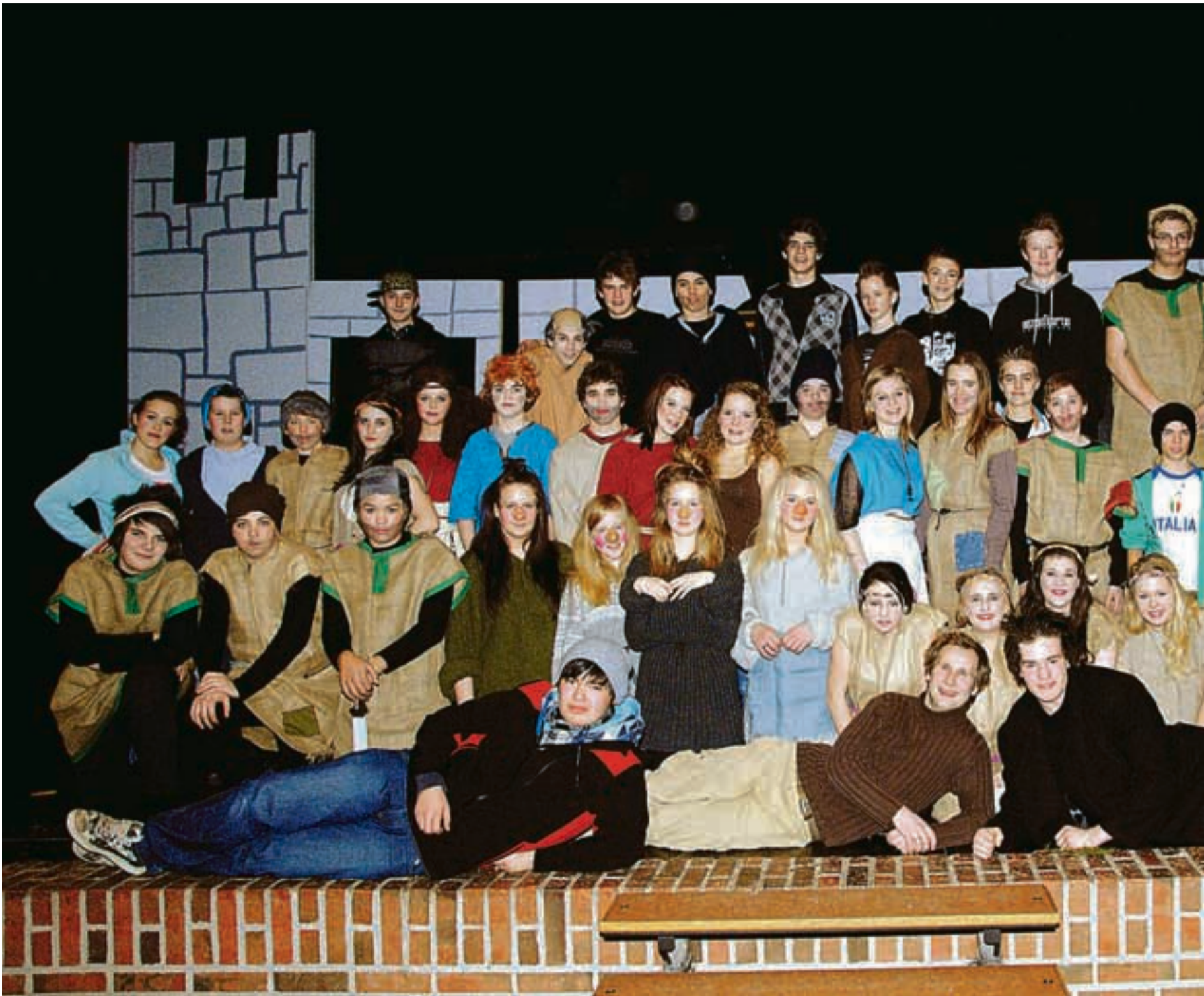
Hele Ronja-ensemblet samlet på scenen.