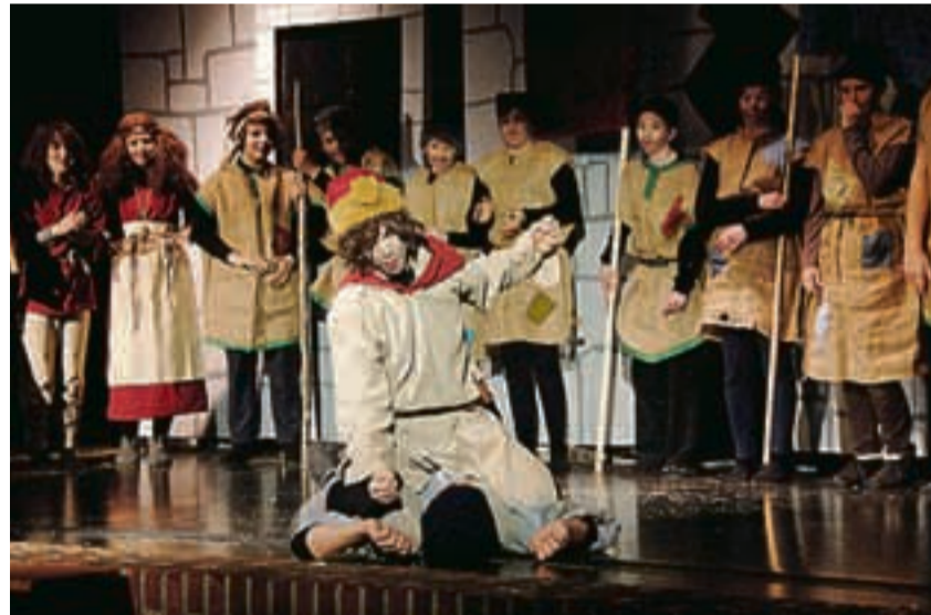
En morsom scene fra forestillingen.