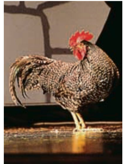
Hanen var med.