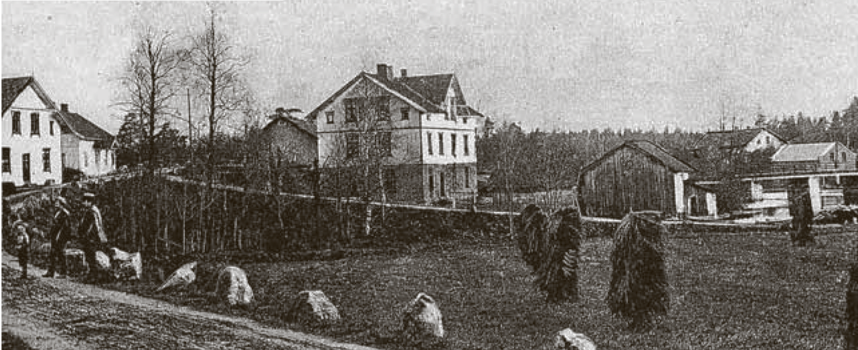
Selv om det har skjedd mye i «Fossen», viser dette gamle bildet at mye fortsatt er seg likt. Vi kjenner igjen både mølla, brua over fossen og flere av bygningene til Holth Landhandleri.