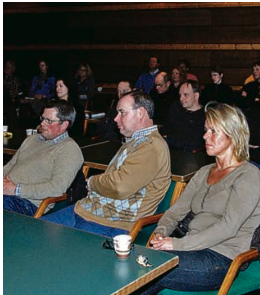
Et 30-tall fremmøtte prioriterte tanker om fremtiden i Grenseland fremfor Northugs første OL-distans på TV, og de fikk en langt mer oppløftende kveld i Marker Rådhus.

God kommunikasjon både kommunene imellom og ut mot publikum er en nødvendighet for at dette skal fungere, påpekte han, og viste til hva som er gjort på dette feltet, blant annet gjennom herværende avis, og hvilke utfordringer som kan finnes i fremtiden.