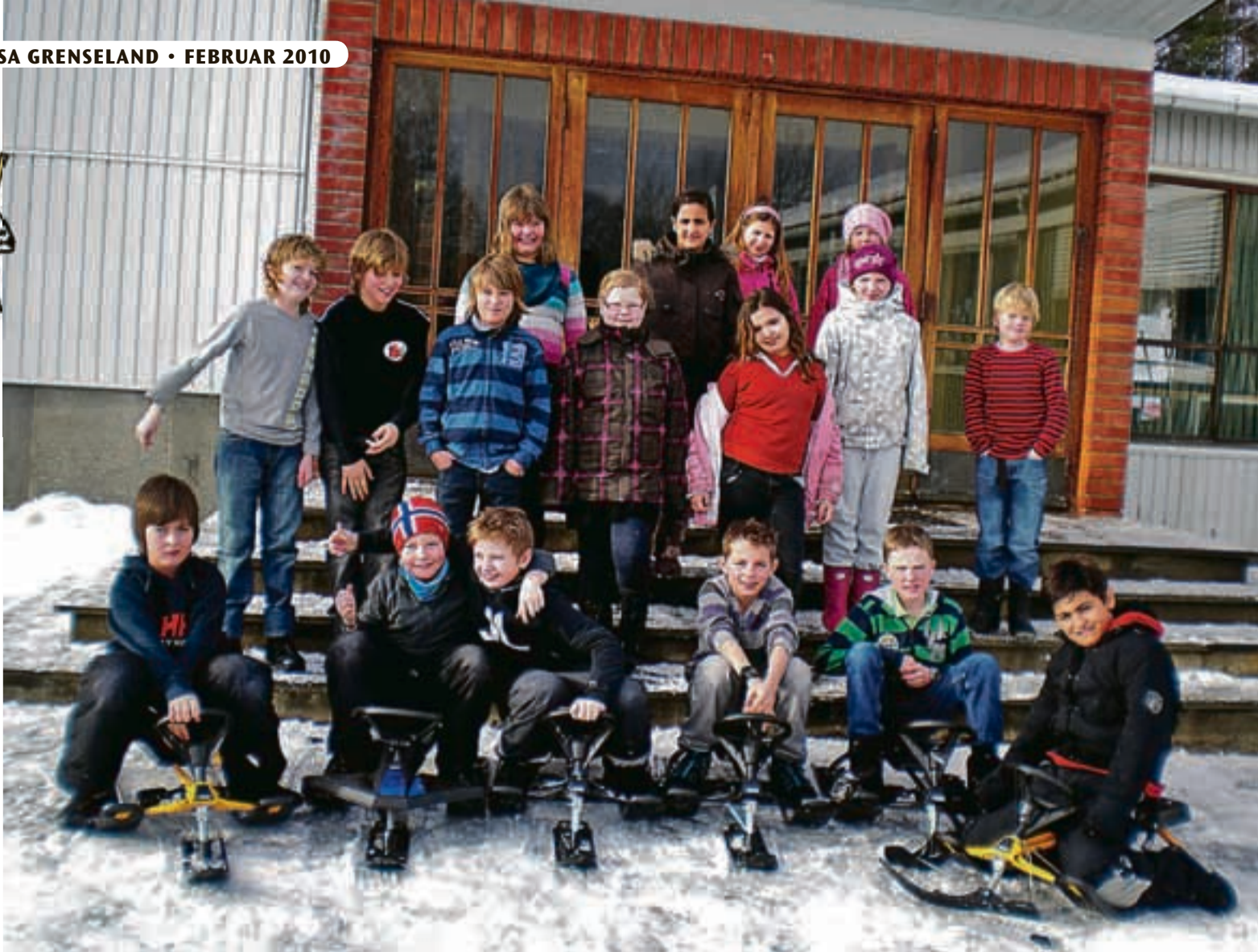
OL-interesserte i Marker. Dette er klasse 5A.