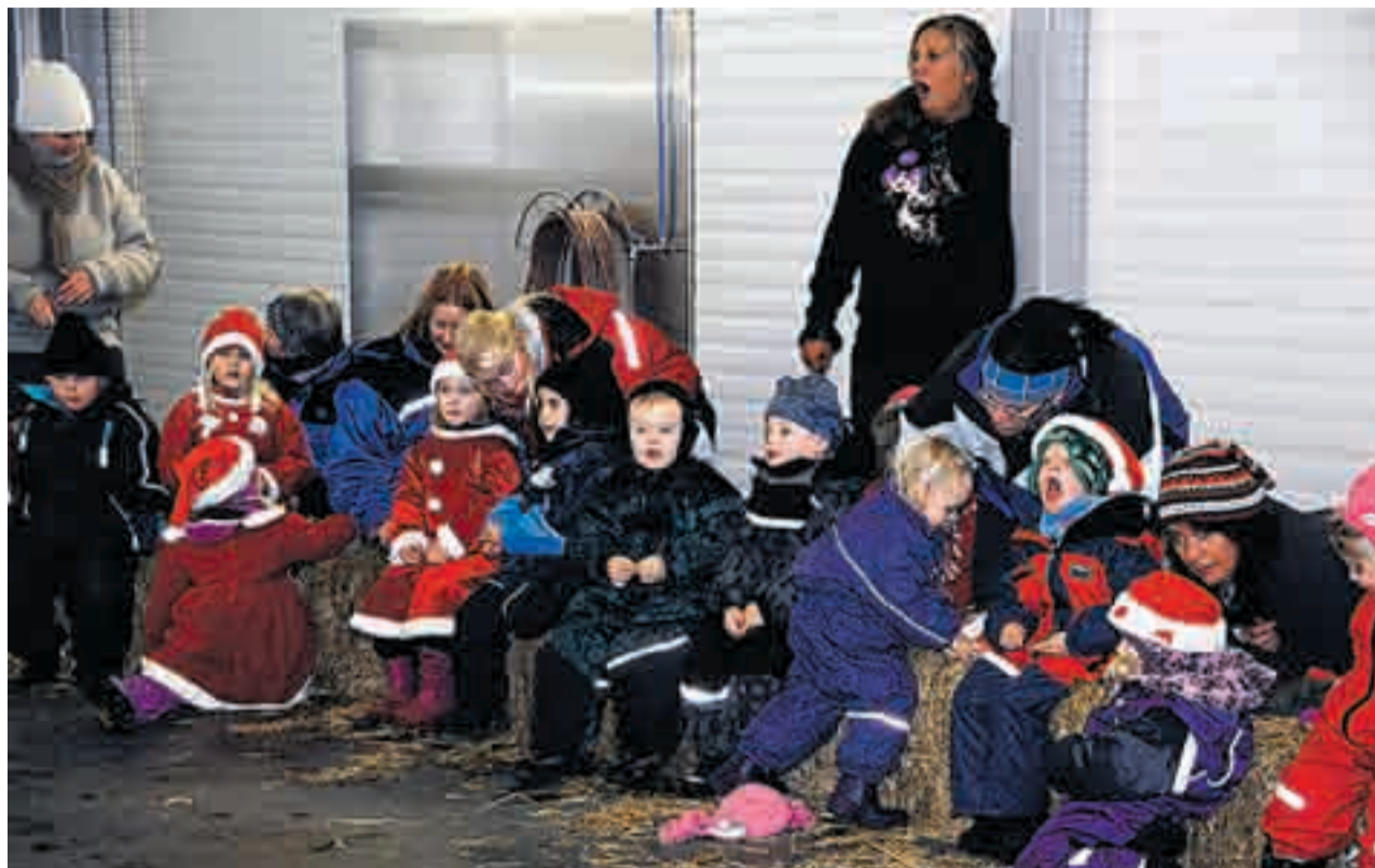
For de små på sidelinja ble nok eksperimentet i lengste laget, men de syntes det var morsomt å se gleden i de voksnes øyne når de fikk leke litt...