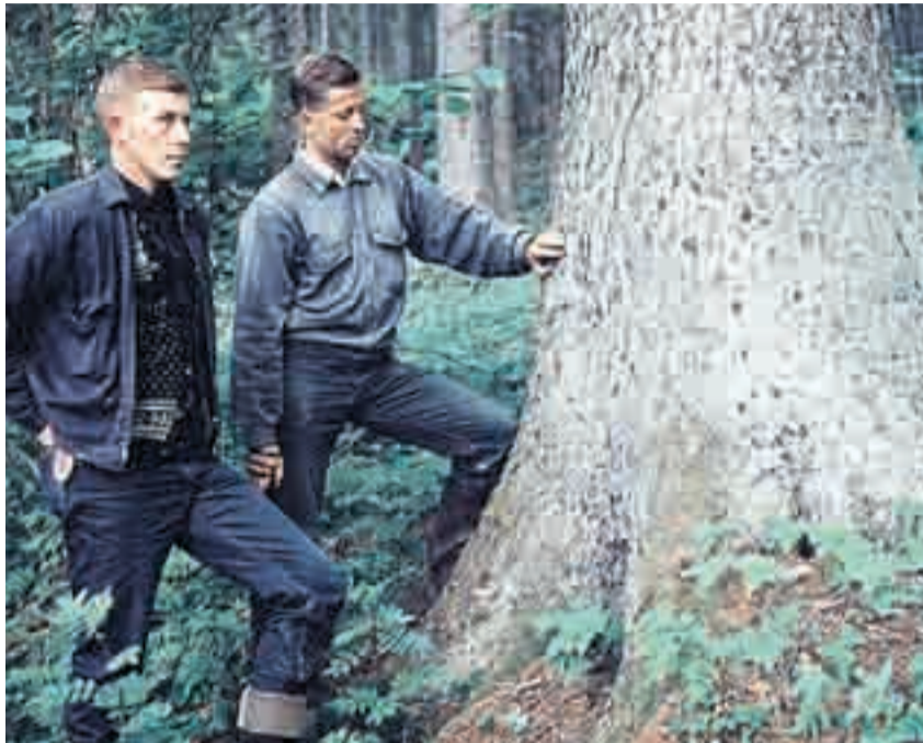
Forstmenn fra Eidskog på besøk i den spektakulære granskogen på Sund i 1958. Som man ser er det store dimensjoner på grantrærne.

På Sund gård i Aremark har det i mer enn hundre år vært en mildt sagt voksen granskog. Selve kongegrana ble erklært død i 1933, og da den gikk over ende mange år senere, viste den seg å måle godt over 35 meter.