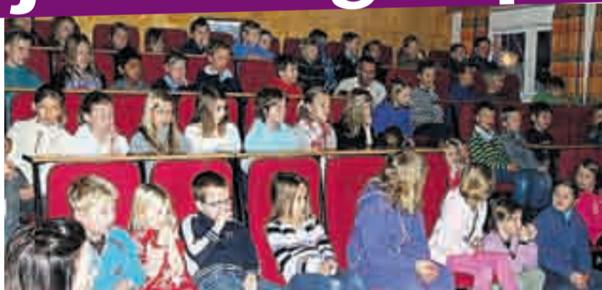
Elever og lærere på Rømskog skole starter hver morgen med sang, musikk og tenning av lys.

Hver morgen møtes elevene på Rømskog skole av fakler på skoletrappa. Når første time begynner klokka åtte, samles alle elevene i mediarommet, der mange lys er tent i vinduet. Sammen tennes adventslys, og sammen synges «Tenn lys», julesanger og en fortelling med tilknytning til julen blir lest.