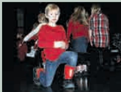
Flinke barn og unge sørget for god julestemning da Marker Kulturskole arrangerte julekonsert for en fullsatt sal i Marker rådhus.