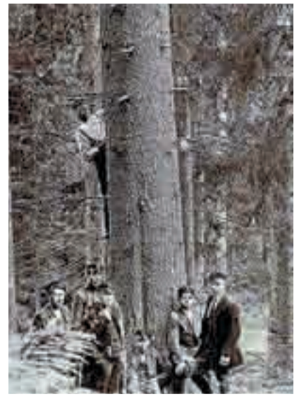
«Sundsgrana» fotografert i 1919. Personene på bildet var ute i praksis fra Skogskolen i Halden, en skole som holdt til i Kongegården ved bybrua

utgangspunkt i Sund. Det er derfor mer enn sannsynlig at de nevnte tre herrer også har tatt de store grantrærne på Sund i nærmere øyesyn.