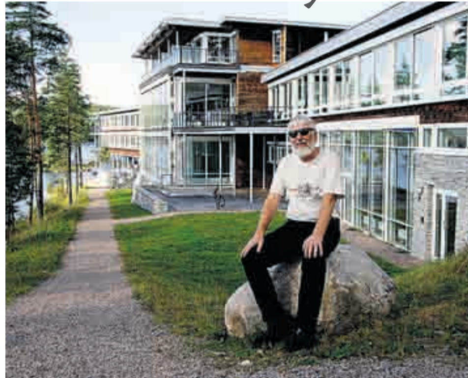
Alt er klart for annonsering av det konkurrammede hotellet i Rømskog før jul. Interessenter finnes allerede, og med litt hell kan det være liv i lokalene igjen når det igjen ser så idyllisk ut ved Vortungens bredd som på dette arkivbildet.

Verdien vil da også variere ut fra hvilke planer eventuelle spekulanter har med eiendommen. Faxvaag opplyser at det blant eksisterende interessenter er en god miks av etablerte kjeder og hotellfolk, og folk uten tilknytning til bransjen fra før. Planene for drift vil nok kunne variere noe, tror hun, uten at hun kan gå i detalj om det.