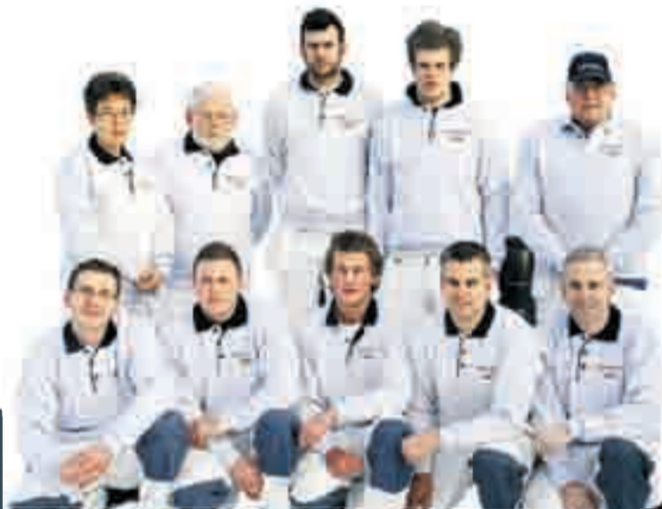
Malermestere, malersvenner, dekorasjonsmalere og lærling står til tjeneste

• Maling • Våtrom • Tapetsering • Dekor • Interiørdesign • Flislegging