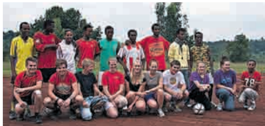
Fotballkamp sammen med venner fra Beza ungdomsklubb.