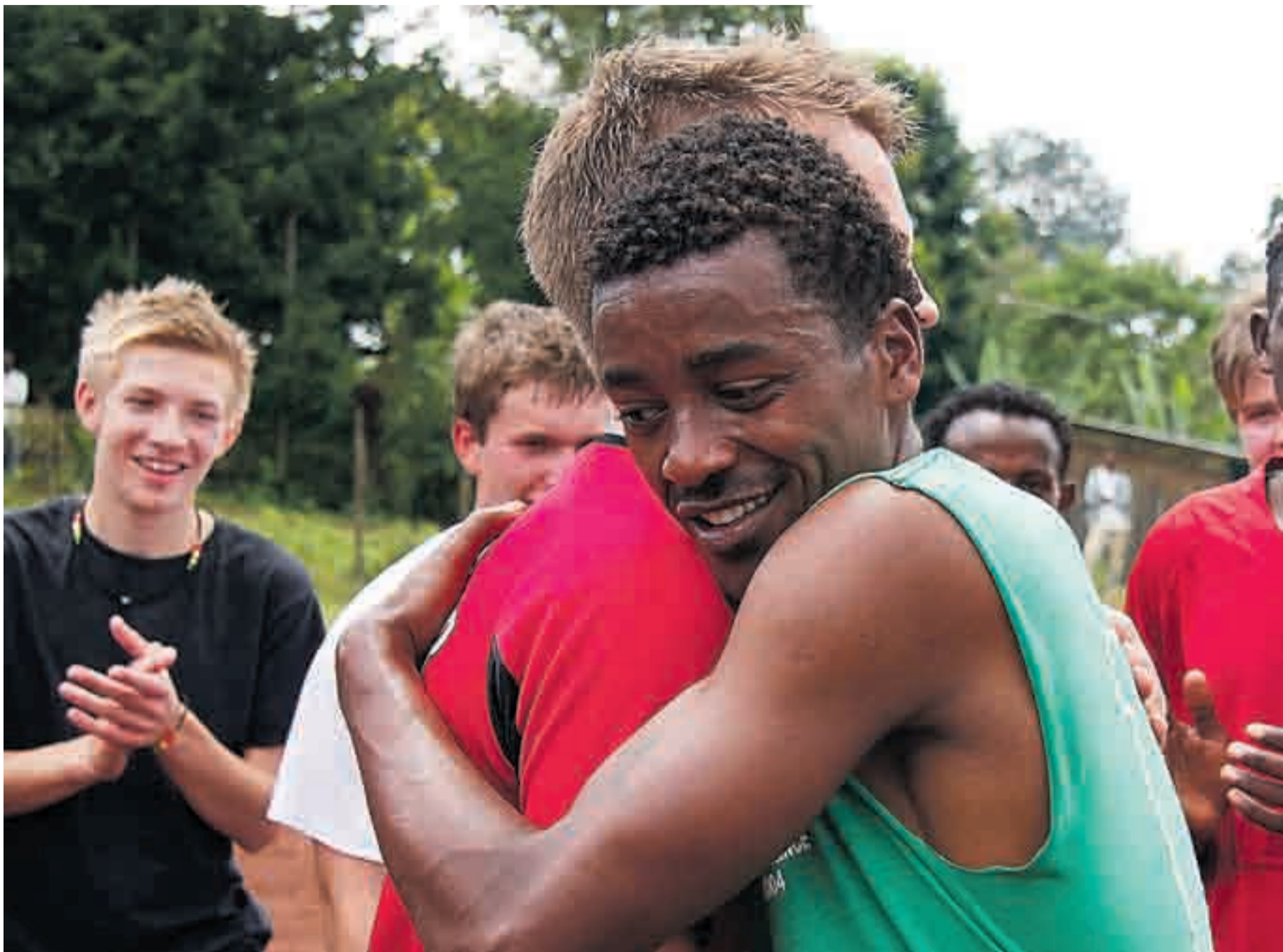
En av mange klemmer som ble Ørje-konfirmantene til del under Etiopia-besøket.

Ni spesielt interesserte ungdommer fra Ørje fikk tidenes konfirmanttur med Grenseaksjonen for Afrika til Etiopia i sommer. Nå skal de fortelle andre om forskjeller mellom land – og likhet mellom mennesker.