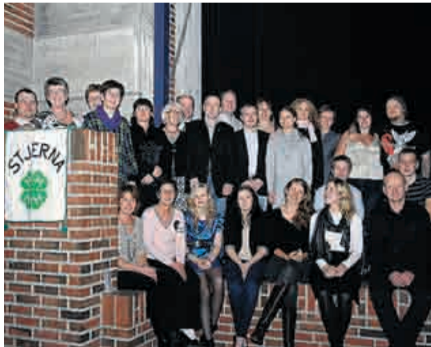
Samtlige av Stjerna 4Hs drøyt 100 plakettmottagere var invitert til jubileet, og rundt 30 av dem dukket opp. Flere av dem ga uttrykk for glede over at klubben fremdeles eksisterer, etter noen tøffe tak for få år siden.

Både nåværende og tidligere medlemmer satte stor pris på kveldens historiske tilbakeblikk, som var i form av redigerte videofilmklipp fra forskjellige arrangementer i Stjerna 4Hs historie. Mimring fra tidligere tider i festlig lag blir aldri helt feil.