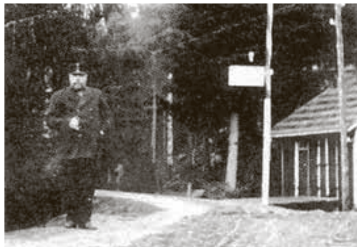
En stolt toller i stram uniform står klar ved Stommen tollstasjon i riktig gamle dager.

1950 Rømskog • Tlf 92 82 52 05 • Fax 69 85 94 47 E-post: steinar@bergquist-maskin.no