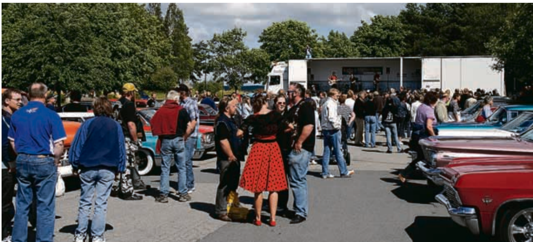
Hele 72 veteranbiler fulle av blide mennesker møtte opp sist man bladde kalenderen tilbake til 1960-tallet i Ørje. Marker-speiderne håper på enda flere når arrangementet gjentas til sommeren.