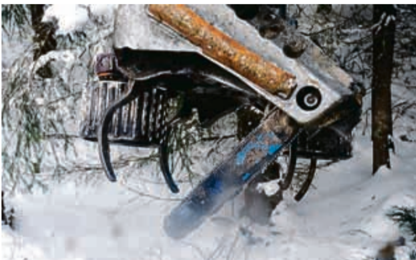
– Det er ikke moro å måtte gå ut og mekke i 25 minus, for eksempel for å bytte kjede, sier Kjell Gunner.