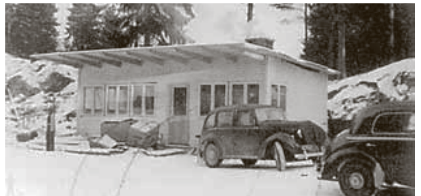
Under krigen fikk grenseovergangen ved Bjørkebekk et spesielt preg. Tyskerne gjorde det helt klart at de ønsket streng kontroll med hvem som krysset grensen.

Grenseovergangen på Stommen er også en grense mellom Norge og EU. Men for lokalbefolkningen i Aremark og Nössemark er det en helt vanlig ferdselsåre. Vennskapet mellom de to bygdene er svært godt, og nössemarkinger og bjørkebekkinger omgås til daglig. Mange nordmenn bor i idylliske Nössemark og trives godt med det. Det er også helt vanlig med norsk-svenske ekteskap på begge sider av grensen. Stommen er et godt eksempel på en grense som gir muligheter og ikke for mange begrensninger.