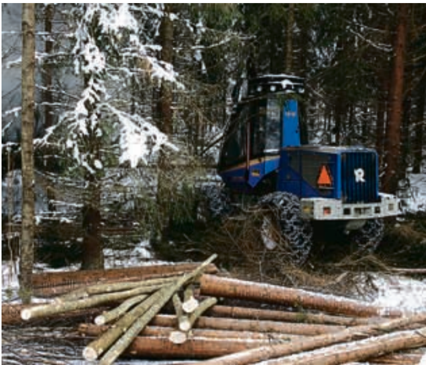
Det er flotte forhold for hogstmaskiner om dagen. Holth Skogsdrift har tjue mann i sving i skogen. Denne maskinen utgjør det minste av seks lag. Et lag består av en hogstmaskin og en lastbærer og koster rundt fem millioner kroner.