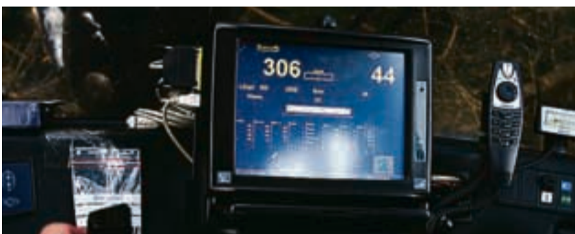
Moderne teknologi gir mye informasjon mens hoggingen pågår. Blant annet lengde og dimensjon på stokken.