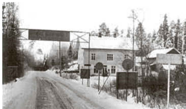
Denne delegasjonen passerer riksgrensen ved Bjørkebekk. Trafikken i bilens barndom var beskjeden, så en stopp og en prat med tolleren skapte ikke akkurat noe trafikkaos.