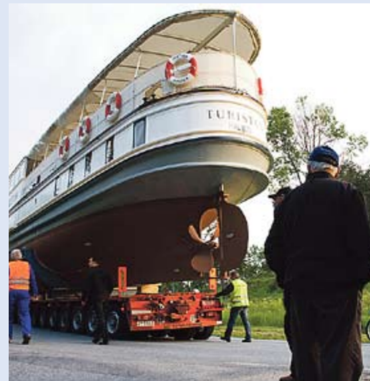
Folk sto langs veien og fulgte med på transporten, en operasjon som tok flere timer.