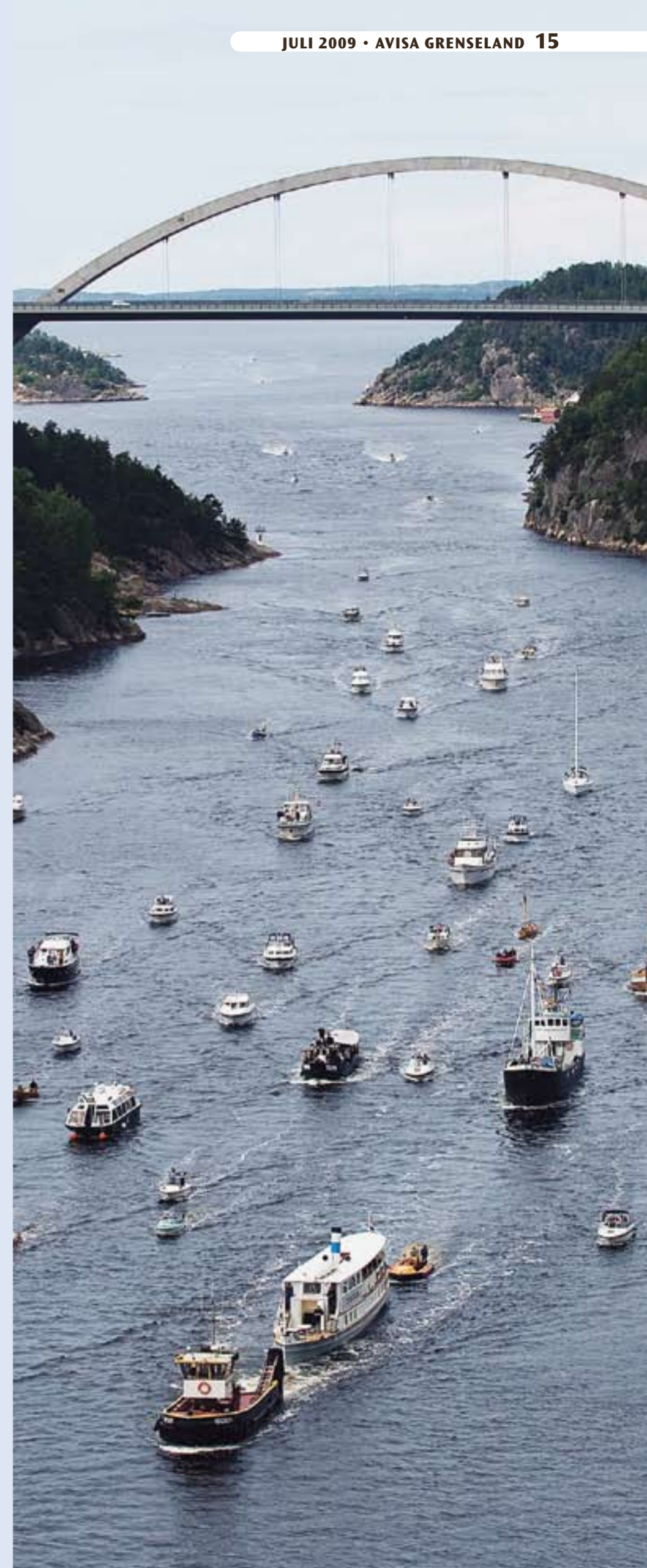
D/S «Turisten» ankom Halden søndag 7. juni, etter mange års restaurering hos Hansen & Arntzen i Stathelle.