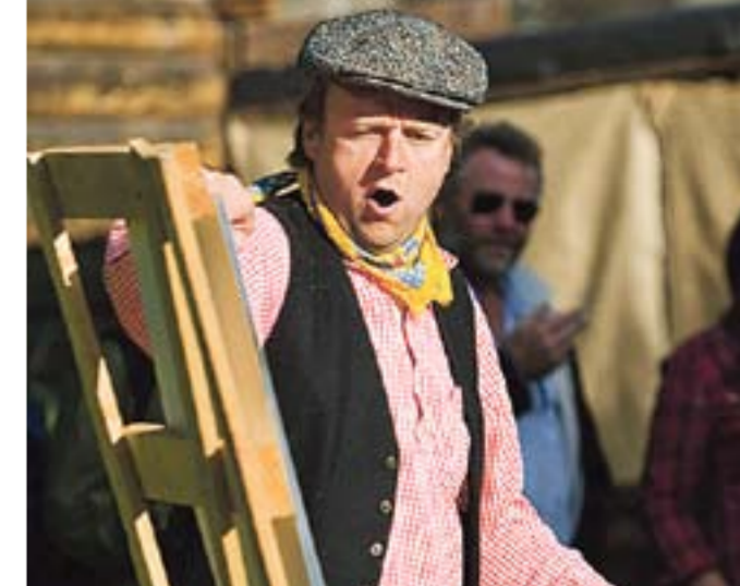
Publikum samler seg rundt skuespillerne på markedet.