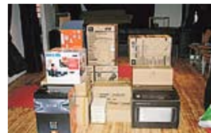
Nytt utstyr er på plass i Ungdommens Kulturhus på Ørje etter innbruddet i mai.

Nå har vi handlet inn nytt utstyr, og huset er på vei opp. Vi har fortsatt noen småting som må ordnes, men til høsten regner vi med å være på beina igjen, kanskje sterkere enn noen gang!