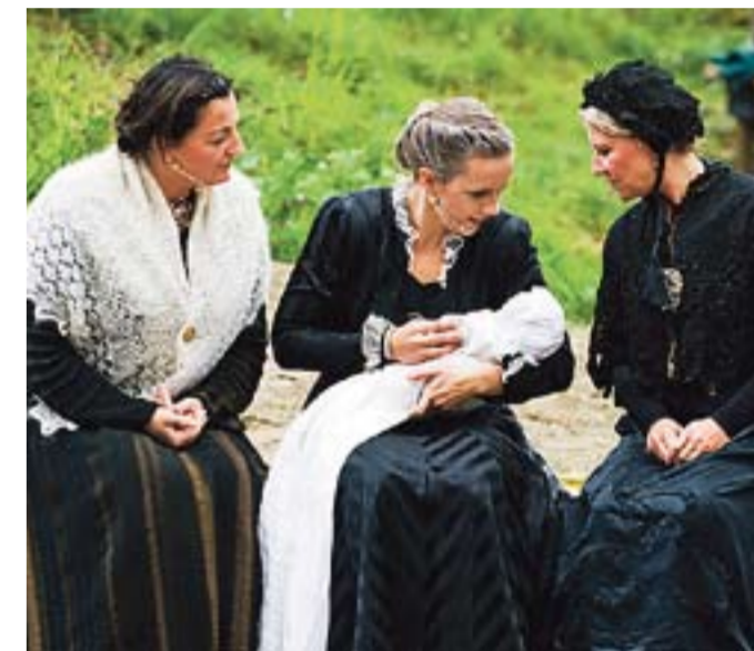
Kostymene er flotte.