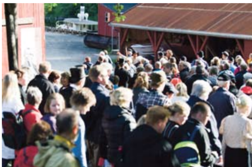
Folk blir geleidet til neste scene under «Slusespillet om Engebret Soot» av Marker Teaterselskap.