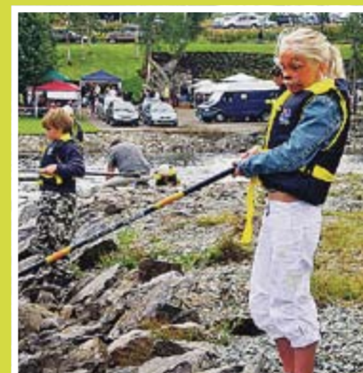
Strømsfossdagen 8. august byr på en rekke aktiviteter for store og små.

Lørdag 1. august Markerdansen i Tangen. Levende musikk fra scenen.