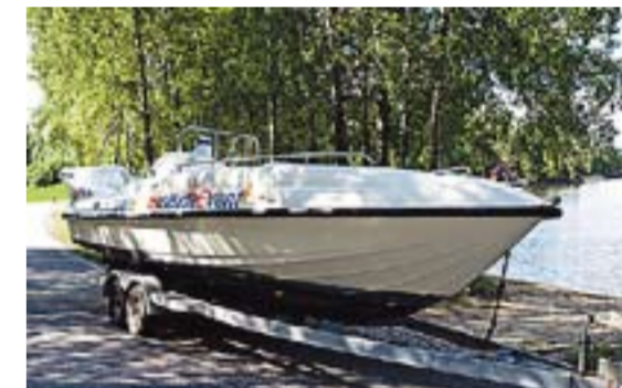
Den spesialbygde båten var et prosjekt da den ble kjøpt i Florida. Straks er den klar for sin første tur på sjøen.

1. august blir Kanallekene arrangert i området rundt slusene i Ørje. Da kan en med egne øyne se hva parasailing går ut på.