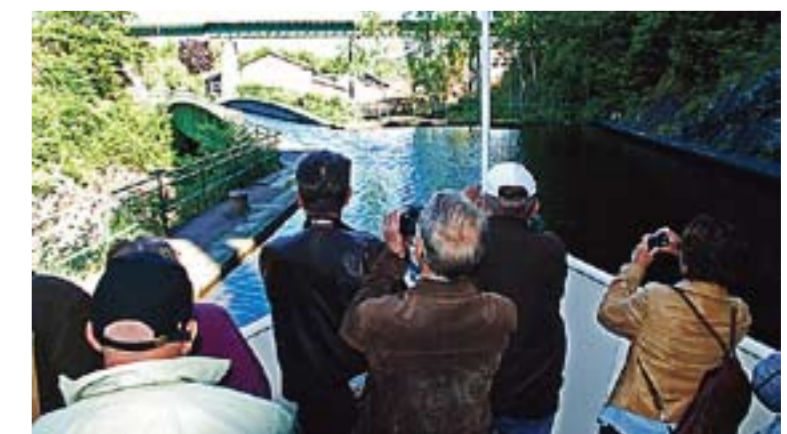
Akvadukten i Häverud er et imponerende stykke ingeniørkunst. Stedet er blant Sveriges ti mest besøkte turistmål.

– Det skal vi få til. Dette ga utvilsomt mersmak, sier «Royan».