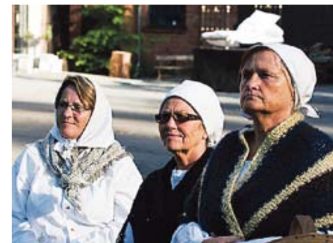
Mange lokale statister er med på spillet.