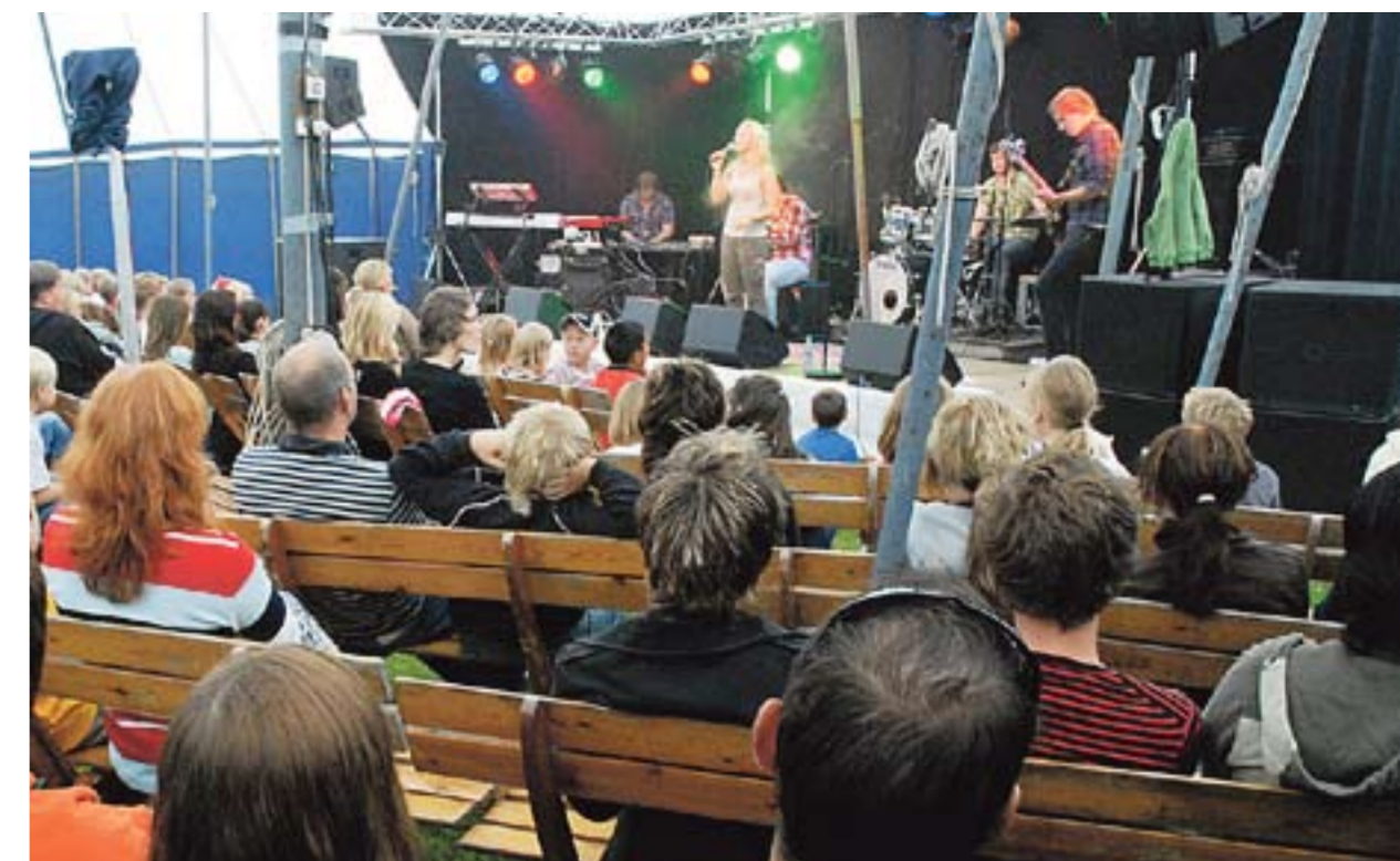
I begynnelsen av august er det duket for Kørrefestivalen i Rømskog. Dette bildet er fra festivalen i 2007.

I likhet med fjorårets festival består konseptet av møter, mangelkamp, volleyballturnering og konserter. På fredag og lørdag er det «åpen låve» utover sommerkvelden. På lørdagskvelden blir det nattverd ved Rømsjøen, og på søndag er det finale i mangelkampen «Mestermøtet».