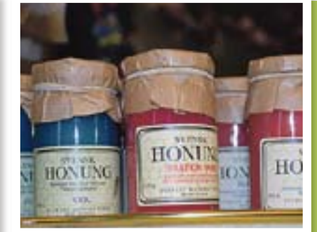
Handverkshuset i Upperud kan by på massevis av spennende varer, fordelt på fire etasjer.