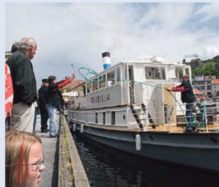
Det var en historisk begivenhet da Haldenvassdragets Dronning kom i havn i Halden.

Etter den varme velkomsten i Halden fortsatte D/S «Turisten»s ferd. Mandag kveld ble skipet fraktet på lastebil til Tistedal og Tangen brygge. En strevsom ferd for en stor Dronning. Transporten vakte enorm interesse, og hele veien sto folk og tittet og fotograferte hendelsesforløpet. Morgenen etter ble skipet ved hjelp av en kran løftet fra bilen og ned i Femsjøen, til et godt kjent farvann.