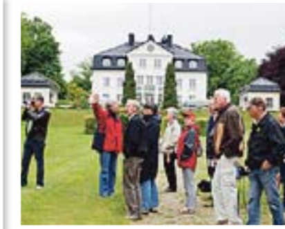
Deltakerne på Avisas Grenslands lesertur besøkte Baldernäs Herrgård.