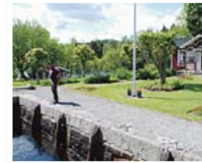
Slike idyller er det mange av langs Dalslands Kanal.