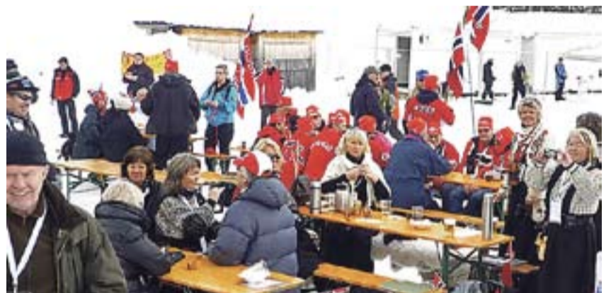
Pause mellom løpene. Fint å kunne bevege seg rundt på området, kontra en trang plassbillett

Løpet er over på en drøy times tid. Alle hjemme har som vanlig blitt mye bedre oppdatert underveis med mellomtider og ekspertkommentarer, som alltid kontra det å være tilstede live på stadion. Men likevel er det alt rundt slike konkurranser som bestandig er like artig. Så når tv kameraene slukker, fortsetter vi enda i flere timer. Ompamusikken er for lengst i gang inne i det enorme festivalteltet. Lydnivået er høyt. Det er en fantastisk stemning i Anterselva. Gjengen fra Marker bidrar i høyeste grad!