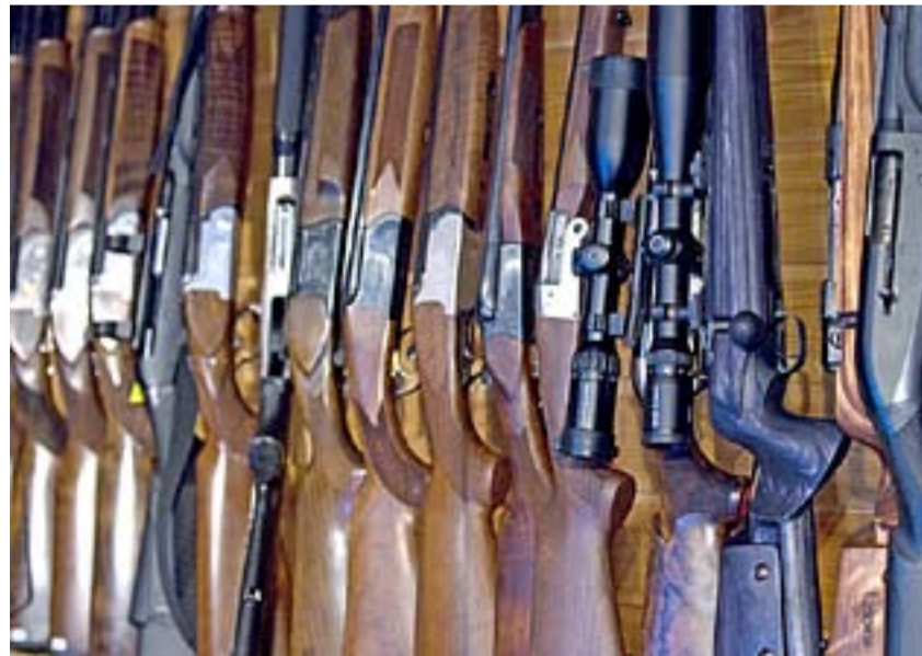
Våpen på rekke og rad.

og gjøre triks. En annen ting er å gjøre det samme når 3500 mennesker står og ser på, sier han.