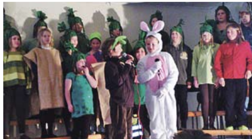
Her ser vi de to harene som nettopp har kommet til «Den levende skogen».