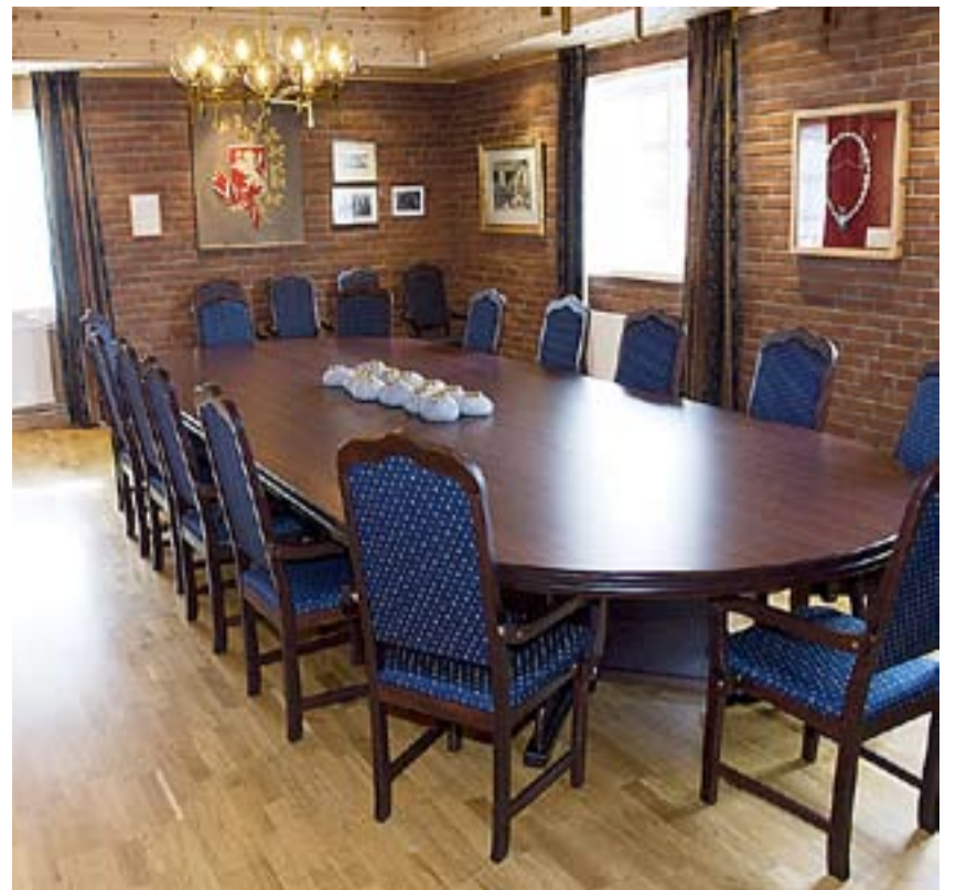
I dette lille, men delikate rommet holder kommunestyret sine møter.