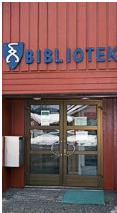
Rømskog har eget bibliotek, til glede for både skoleungdom og den voksne befolkningen.