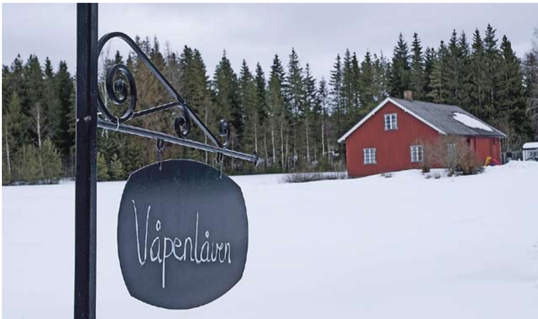
I låven på Løverød i Aremark får en alt fra hagler, kuler og krutt til nye støvler.