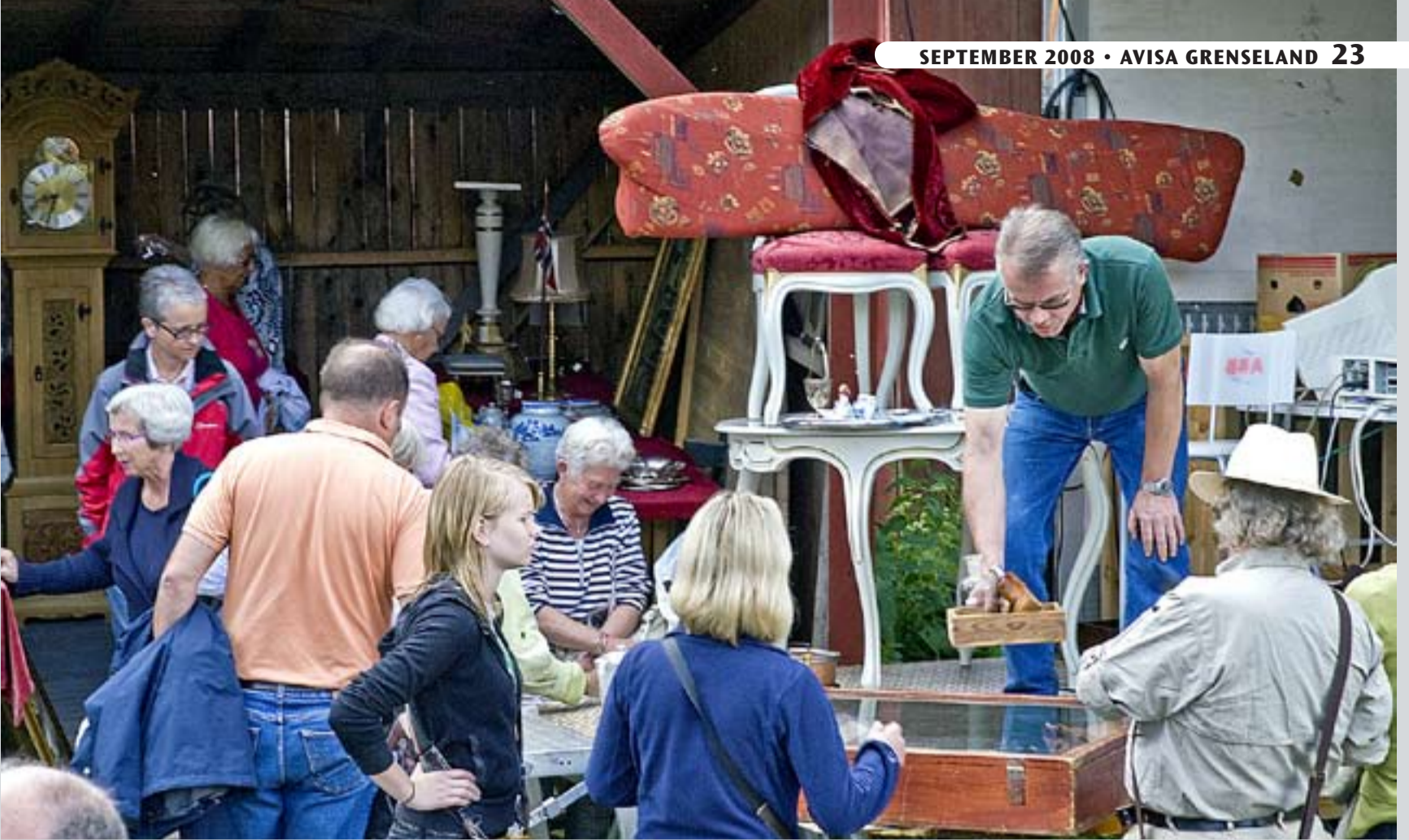
Auksjon er en viktig ingrediens på Slusefestivalen.