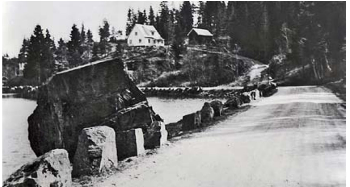
Steinen ved Ørjeberga fotografert på 1950-tallet.

Den store steinen ved Rødenessjøen, nedenfor Ørjeberga, var i mange år et kjent og kjært landemerke. Nå er E18 for lengst erstattet av motorvei. Store deler av Ørjeberga måtte bort for å gi plass til den nye veien. Men steinen ligger der fortsatt. Morsomt er det å se hvordan denne vestre innfarten til Ørje har forandret seg på femti år.