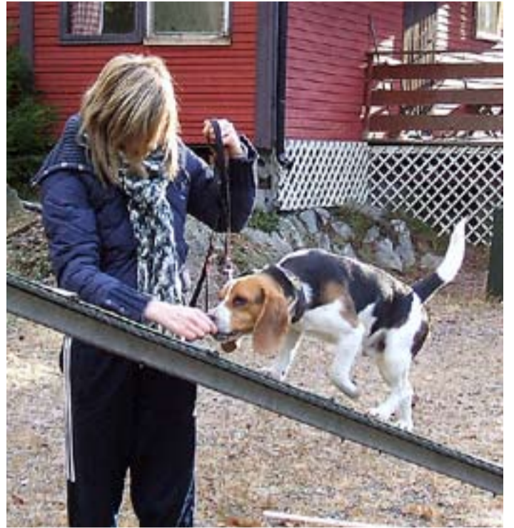
Både hund og eier synes det er morsomt å få til nye kunster.

Hundebanen representerer et fint område for virksomheten. Det er 16 mål med tomt, alt inngjerdet. På området er det to treningsbaner, hvor den ene blir brukt til agility og den andre til diverse andre aktiviteter. Det er også et klubbhus som brukes til medlemsmøter og kurs. Klubben tar gjerne imot nye medlemmer, uansett rase eller nivå.