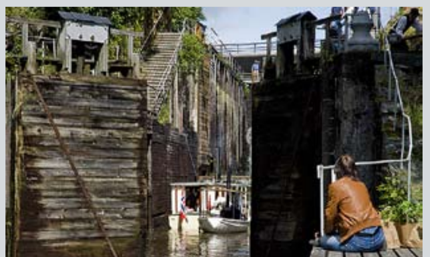
Slusene på Ørje er en attraksjon i seg selv. Flere besøkende slappet av på brygga og tittet på hvordan de gamle dampbåtene tok seg fram.