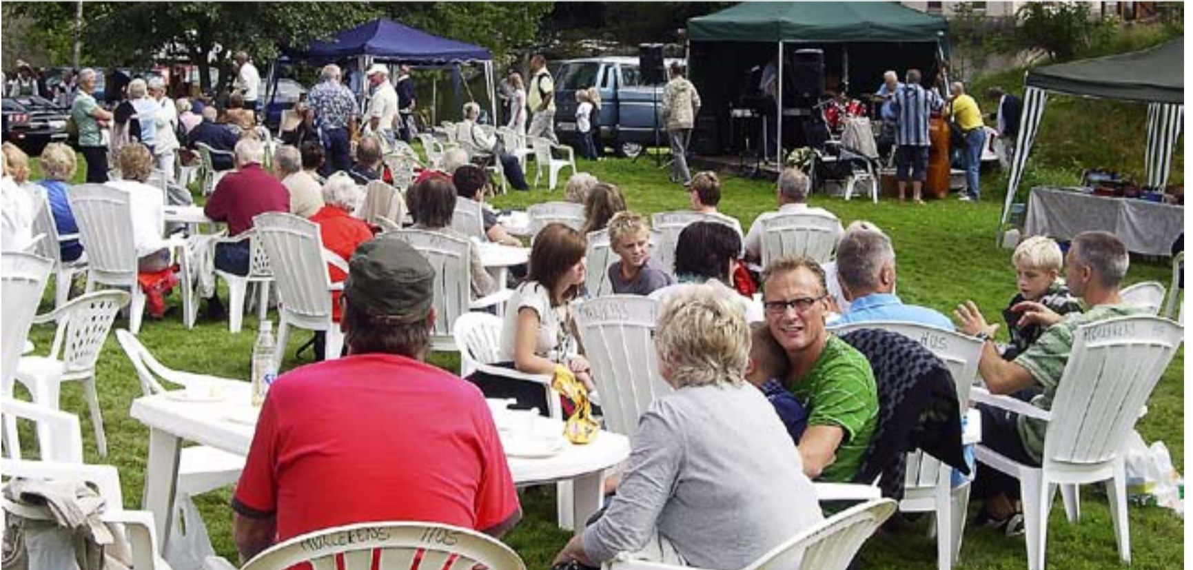
Strømsfossdagen er en sosial happening for både aremarkinger, hyttefolk og gjester fra nabokommunene.

Nok en gang klarte arrangørene av Strømsfossdagen å samle massevis av mennesker til arrangementet i det lille knutepunktet nord i Aremark. Selv ikke et regelrett skybrudd tidlig på dagen stoppet publikumstilstrømmingen.