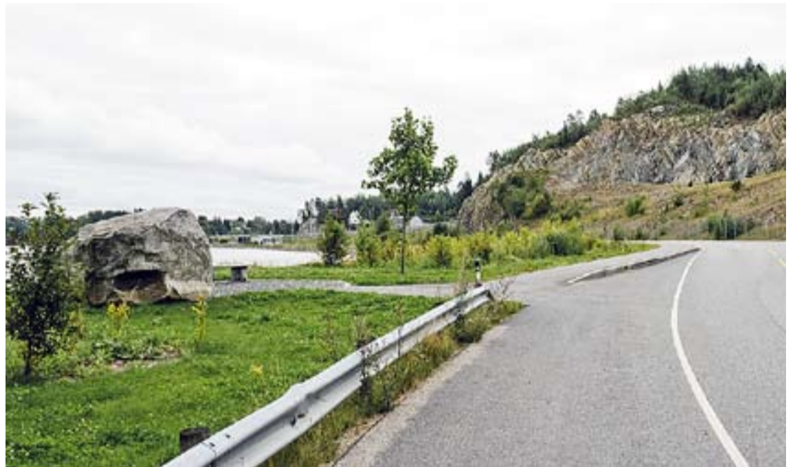
Slik ser det ut der steinen under Ørjeberga ligger i dag.