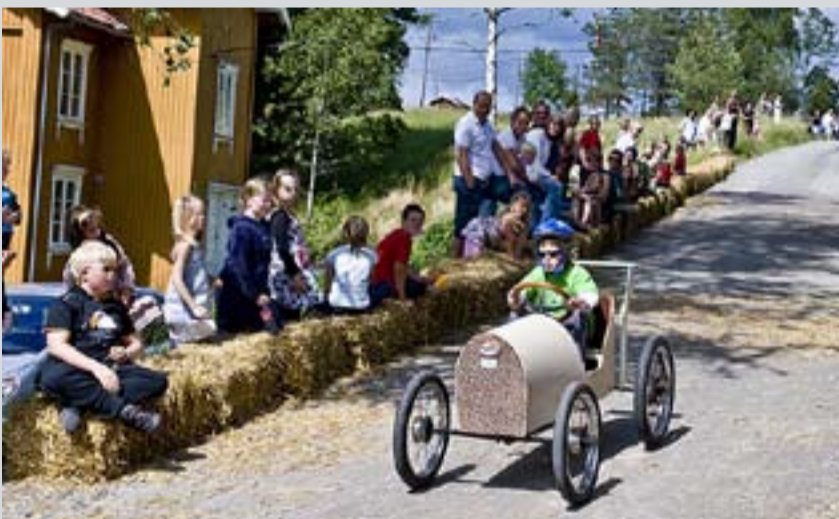
Det gikk unna da barna dundret nedover Engebret Soots vei i sine hjemme snekrede doninger.

Den årvisse Slusefestivalen i Marker trakk store og små til Brugsområdet også i år. Men denne gangen i strålende solskinn. Vaffer og kaffe, rømmegrøt og saft, og et bredt spekter av aktiviteter sørget for at store og små storkoste seg på Ørje den siste helgen i juni.