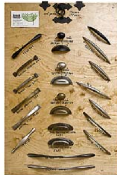
Flere produkter fra Aremark Produkt & Design.

– Målet er å ha satt opp noen boliger i løpet av de nærmeste årene. Det var tanken helt fra starten av.