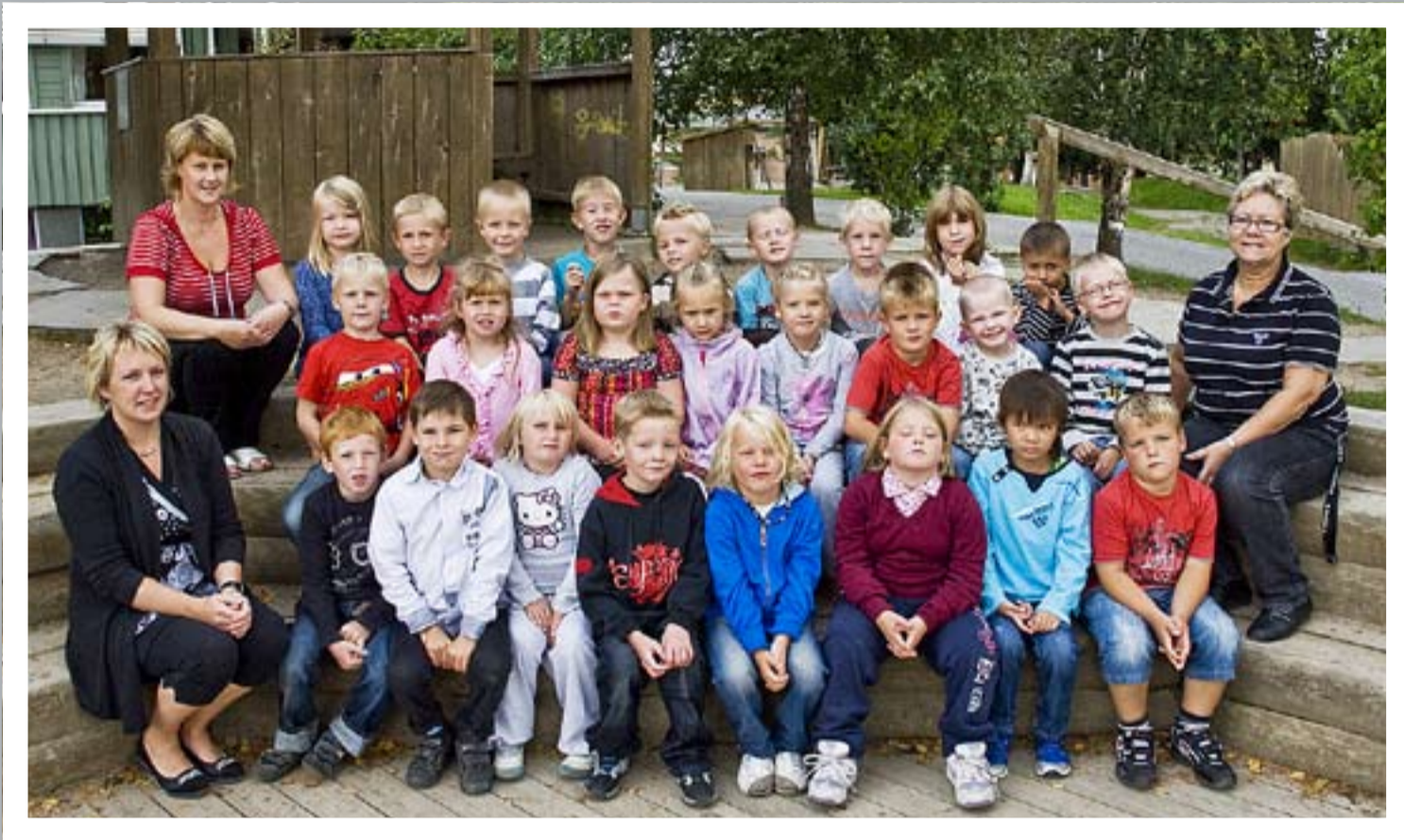
1B Marker skole