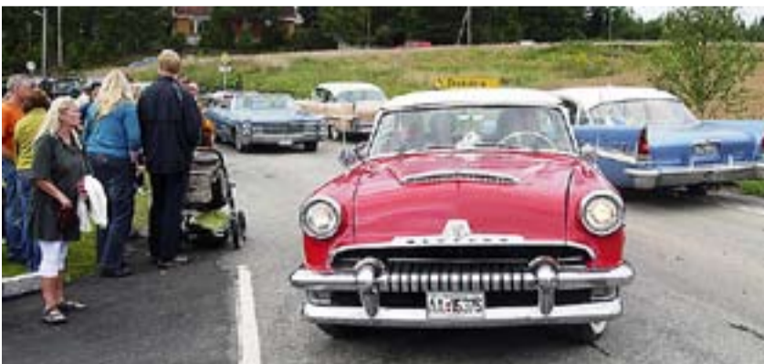
Over hundre amerikanske biler i alle farger og fasonger besøkte Strømsfossdagen.