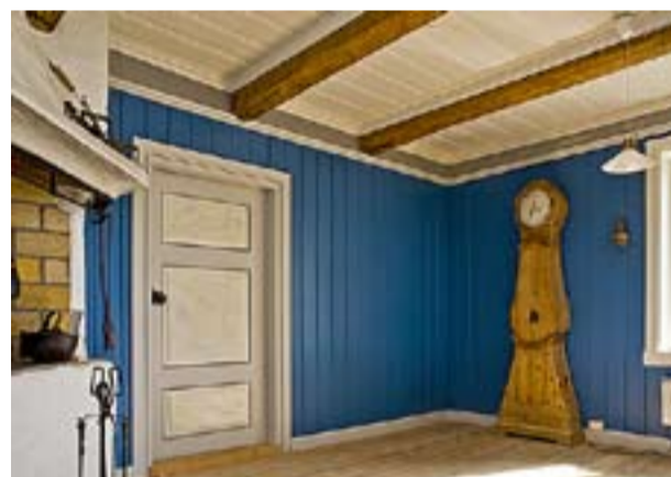
Kjøkkenet i hovedhuset fra 1860 er pusset opp. Resten av huset er det gjort lite med.