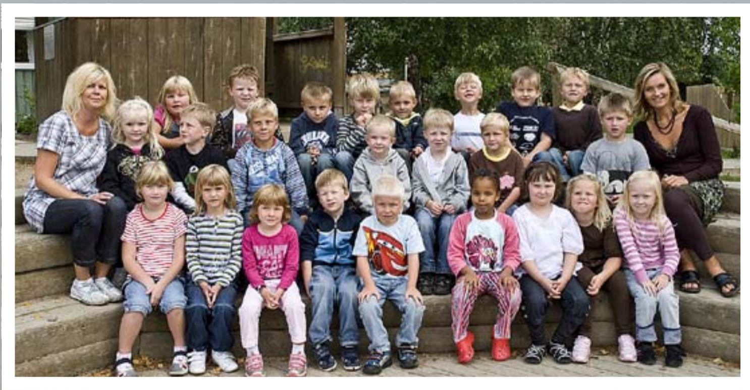
1A Marker skole