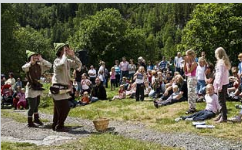
Stubbefolket inntok «scenen», og underholdt mange barn med sitt stykke «Sopp er topp», som hadde premiere på Slusefestivalen.