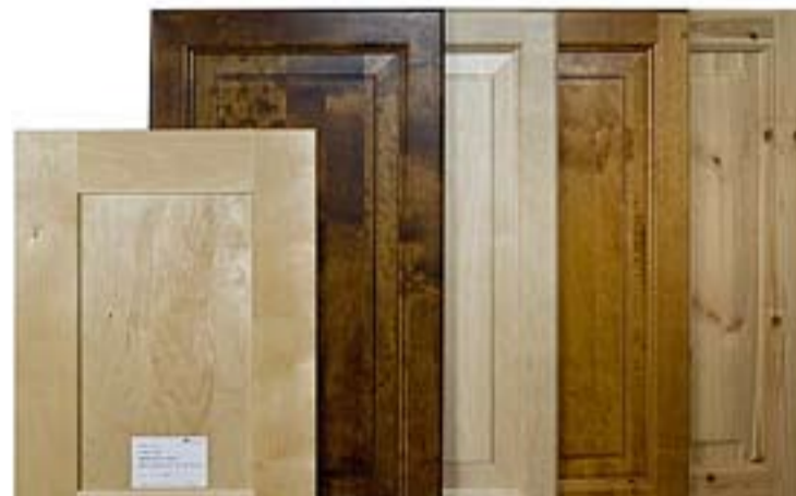
Aremark-bedriften selger kjøkkeninnredninger i heltre.