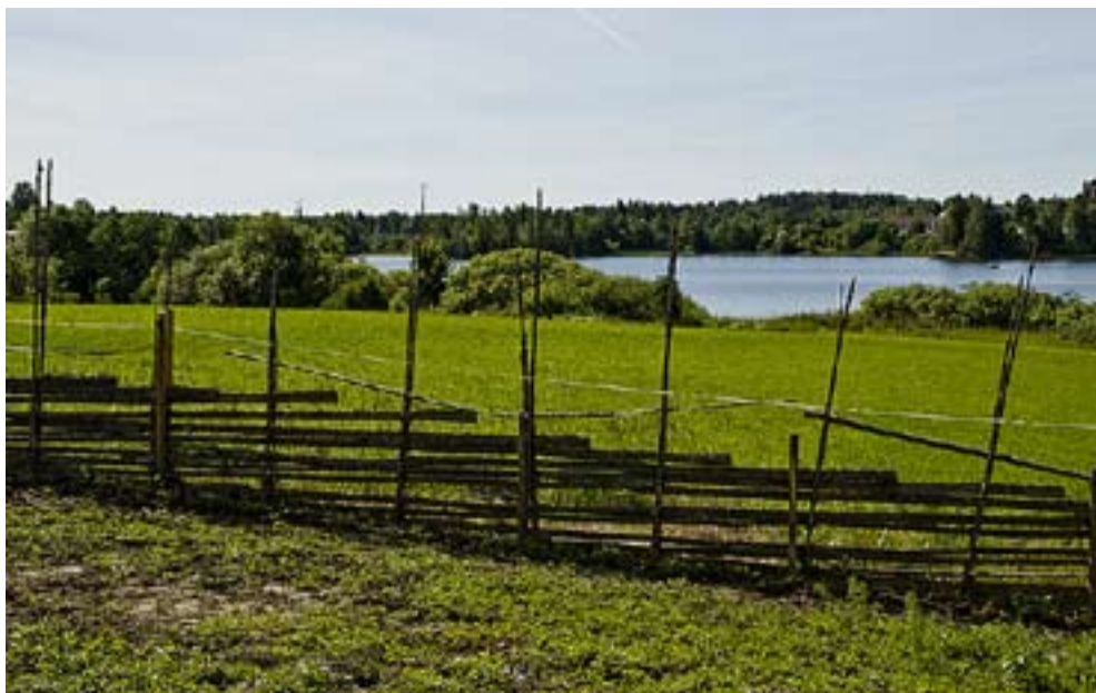
Mosebyødegård ligger vakkert til med utsikt over Rødenes-sjøen.