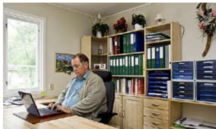
Aremark Produkt & Design holder til i den gamle brannstasjon- nen i Aremark. Her selger de også kontormøbler, som vist på bildet.