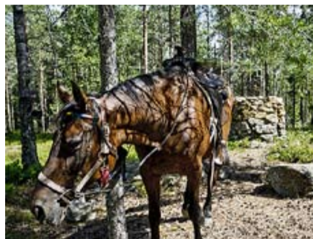
Etter en times ridetur på Anine til grenserøys nummer 35 lar han hesten hvile litt.