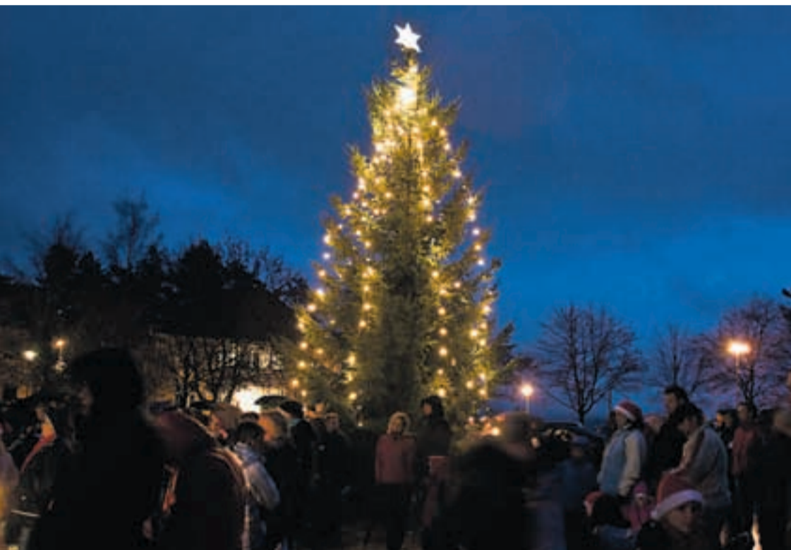
Å gå rundt juletreet hører med til julegateåpningen i Marker. Mange møtte opp til tross for regnværet. Etter oppfordring fra fjerdeklassingene på Marker skole fikk treet en julestjerne på toppen.