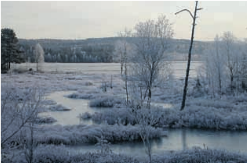
Marker har massevis av kulturtilbud og en flott og til dels uberørt natur som byr på gode opplevelser.

Det ser rett og slett ikke ut som om innbyggerne i Marker noen gang kommer til å bli fornøyde med hvilke muligheter kommunen har å by på. De mest misfornøyde er ungdommen. Vi mener at om innbyggerne her i bygda sier at det er lite å finne på, burde de ta en titt til.