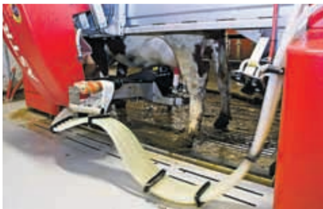
Melkeroboten melker 900 liter melk om dagen. Kuene får kraftfôr mens de blir melket. Informasjon rundt melkingen lagres på datamaskin.