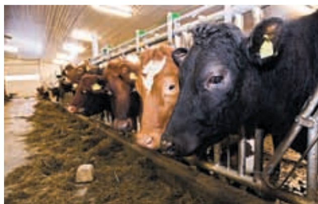
Kuene trives godt i det nye fjøset på Vestre Bøen gård. Her er det mye luft og lys.