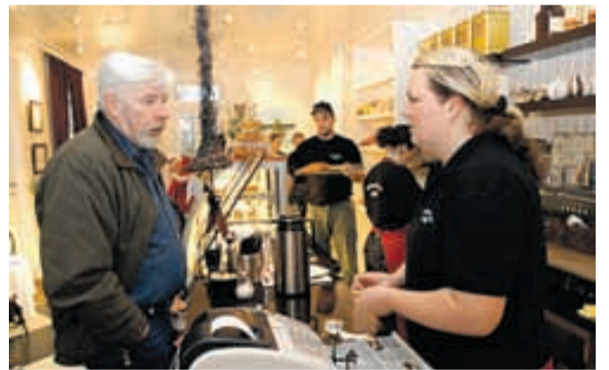
Ansatte i det nye bakeriet på Ørje, Bakergaarden Café, hadde hendene fulle under julegateåpningen. Butikken var til tider stappfull. Det er ikke hver dag en trenger å stå i kø i Grenseland.