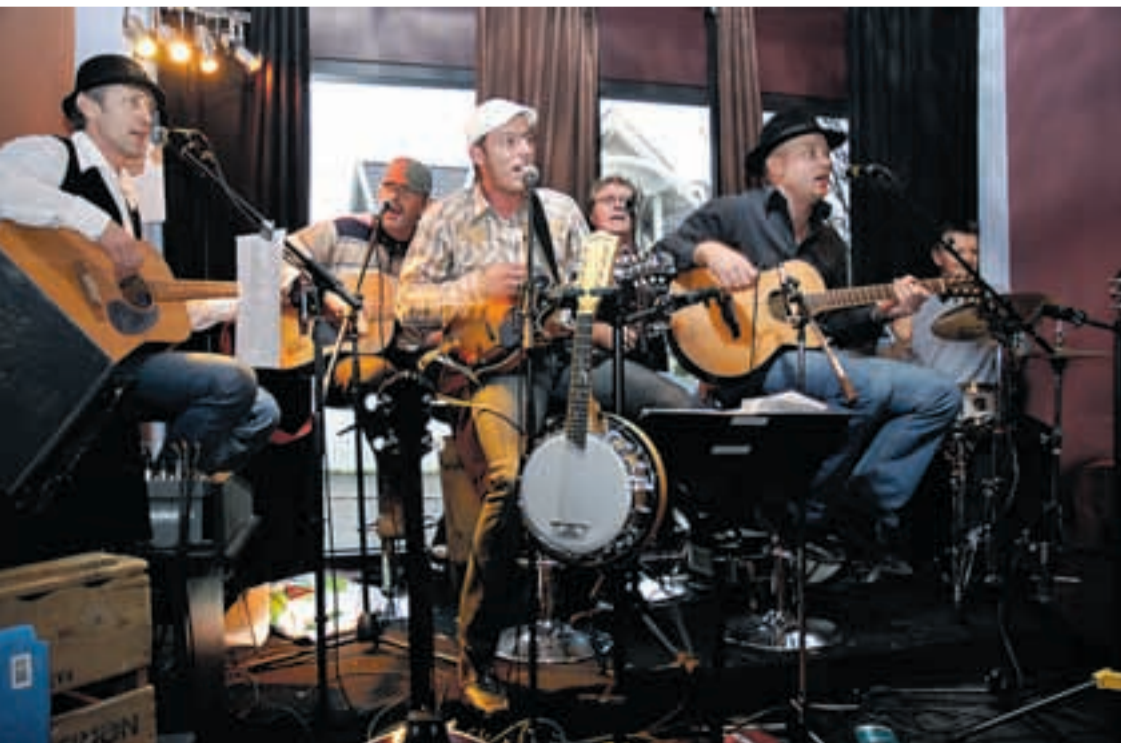
Bandet Dixie Freaks spilte på kafeen «Rått & Rococco» i Ørje sentrum under julegateåpningen.