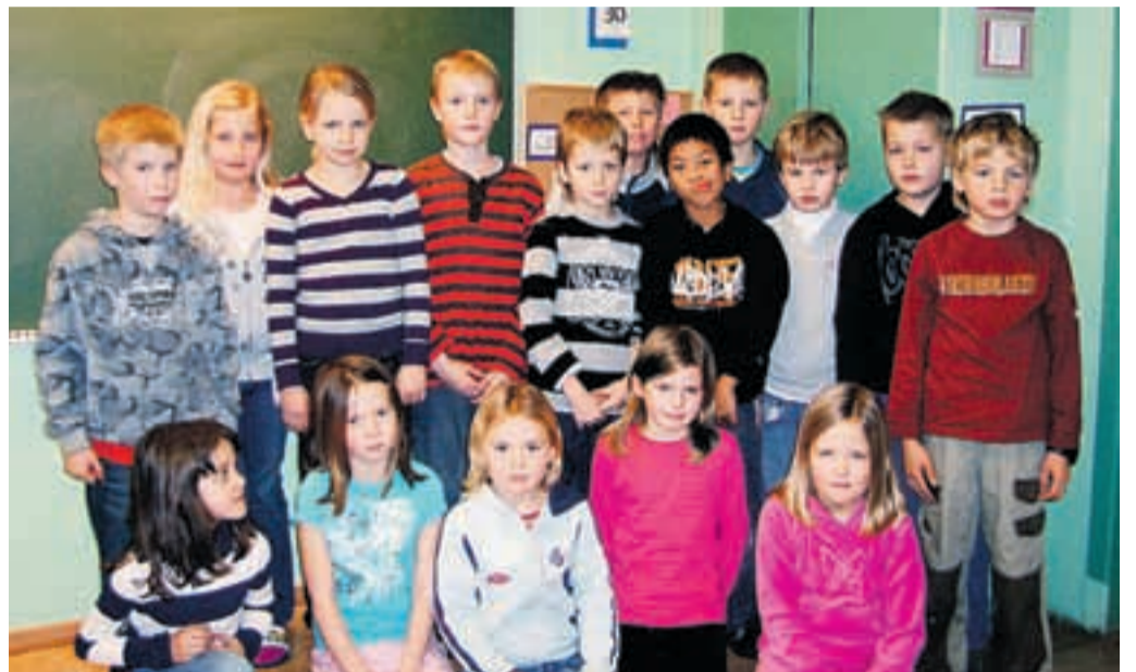
2. og 3. klasse jobber i samme klasserom.