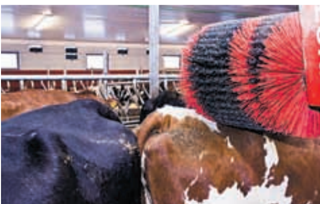
Kuene synes det er godt å klø seg på denne børsten.