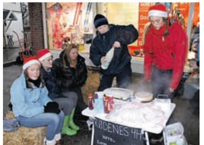
Rødenes 4H solgte vaffel, kaffe og klem i førjulstiden.