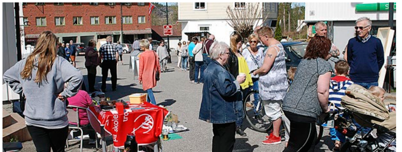
Vårmarkedet i Ørje er en stor sosial happening. I det flotte været var det ekstra trivelig å treffe på kjente for en hyggelig prat.