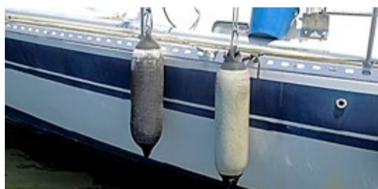
Fenderne – før og etter. Utrolig hva vær og vind i tropiske strøk stiller i stand på bare halvannet år.

Halvannet år og to klamme orkansesonger etter at vi forlot båten i Rio Dulce var «Amanda» en skygge av seg selv. Med jordslag på fendere og utstyr, solbleka presenning samt betydelig