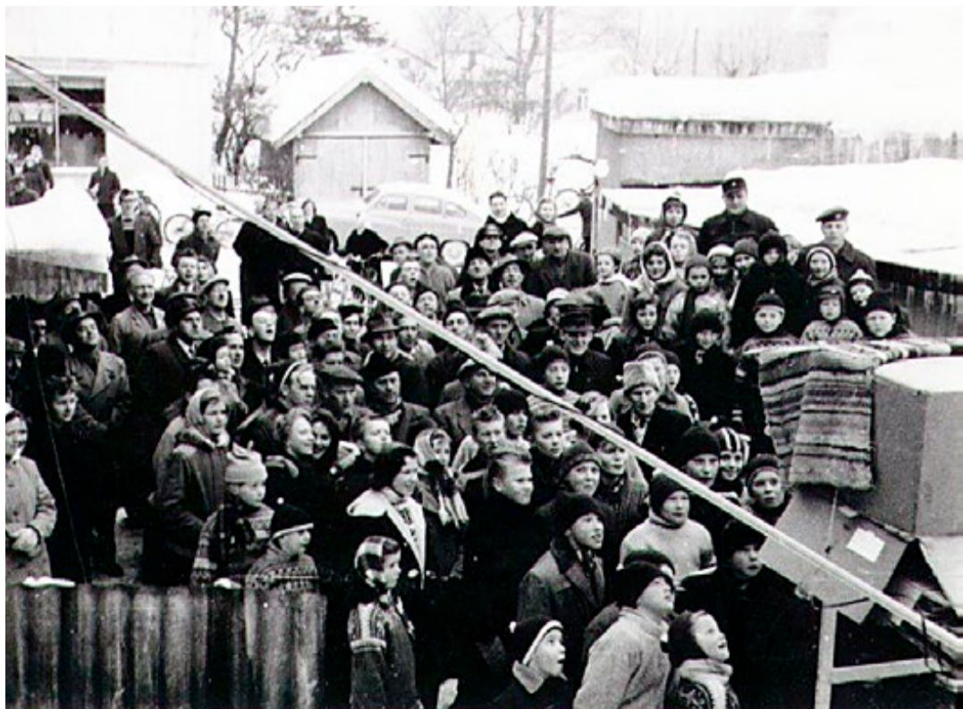
På tv-skjermen vises EM på skøyter i februar 1959. De færreste hadde tv den gang, og folk samlet seg utenfor butikken.

Nilsen Sport og Elektrisk er mer enn en butikk. I anledning 100-årsjubileet er butikken også blitt et mini-museum.