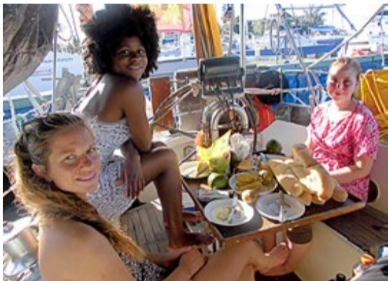
Trivelig gjenforening med venninnegjengen i Cienfuegos på Cuba.

rikere er de på egen kultur, ferdigheter, utdanning og ikke minst livsentusiasme.