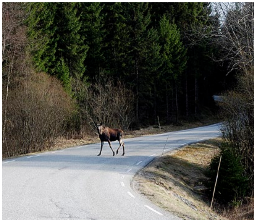
Nesten daglig har vi denne våren opplevd slike møter med skogens konge mellom Fløvik og Ytterbøl. Vær på vakt. Elgpåkjørsler kan få katastrofale følger.

Her i Marker har vi ennå ikke fått de store flokkene av villsvin. Men i Aremark og nord-øst i Halden er det flokker på oppimot 25 dyr. Når disse krysser veien i mørket, kan det skje dramatiske påkjørsler. Mange har opplevd dette i våre nabokommuner i sør. Om ikke så alt for lenge vil vi oppleve det samme i Marker.