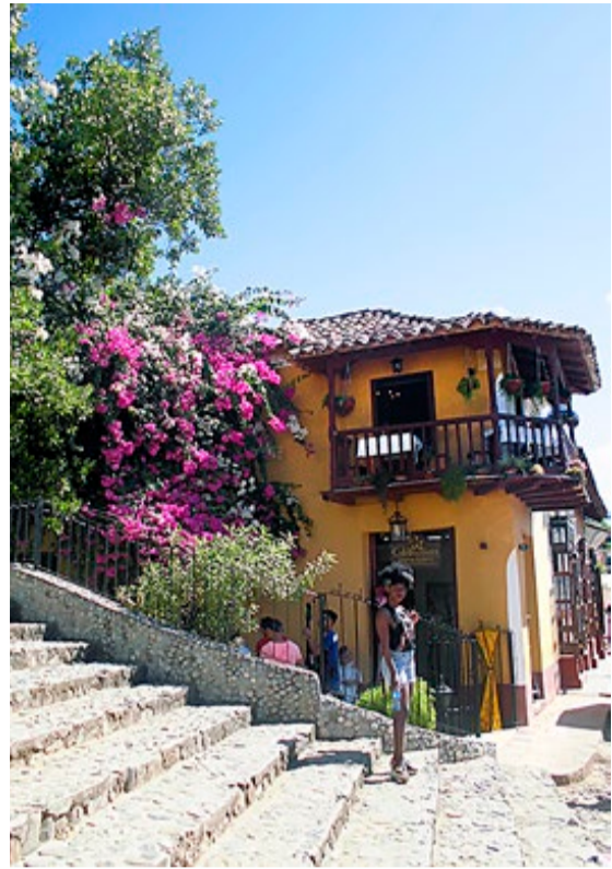
Cuba - Karibiens største øy - var en fargerik drøm.