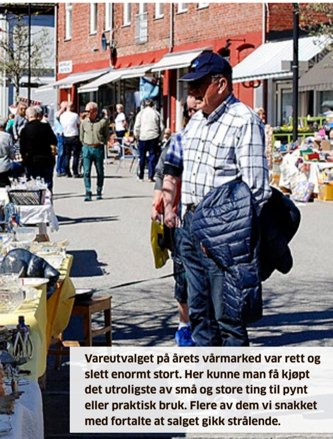
Vareutvalget på årets vårmarked var rett og slett enormt stort. Her kunne man få kjøpt det utroligste av små og store ting til pynt eller praktisk bruk. Flere av dem vi snakket med fortalte at salget gikk strålende.