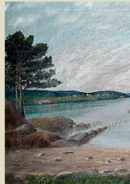
Einar Sandmo malte dette flotte bildet i

Noe av det første Einar S å male et bilde av Ysterud