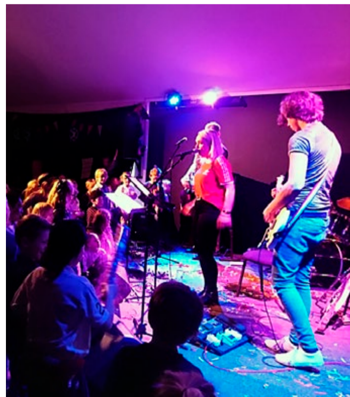
Full stemning både på og foran scenen da rockebandet Feber underholdt på Slåbrock Kidz.