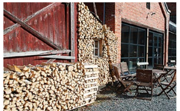
Ved er temaet for årets sommerutstilling i Galleri Ørje Brug.