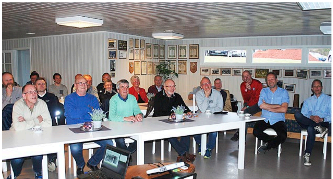
Mange koste seg på Ørje ILs fotballmimrekveld. Her var både gamle storspillere, ledere, fans og andre med et stort hjerte for Ørje. Noen hadde kommet langveisfra for å delta.

av klubbens beste gjennom tidene. Dette laget slo blant annet Kvik fra Halden 5-2 i seriespillet. Samme sesong ble det 3-0 mot Tistedalen, foran over tusen tilskuere hjemme på Ørje. Sesongen ble kronet med avdelingsmesterskap og senere kretsmesterskap etter uavgjort hjemme og seier borte mot Navestad i KM-finalen.