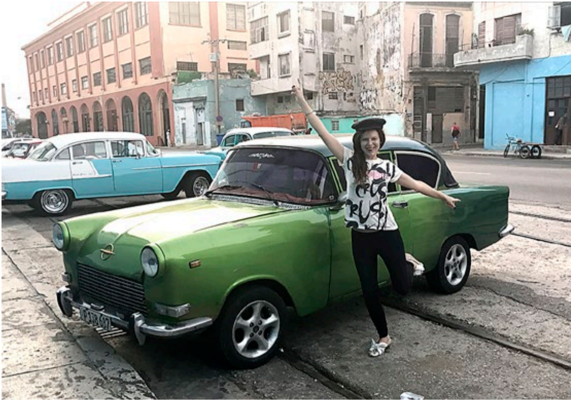
Knæsje veteranbiler er hverdagskost på Cuba.