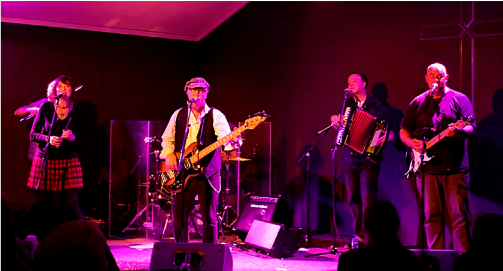
Skotske The Electrics holdt en fantastisk konsert under årets Slåbrock-festival på Stikle.