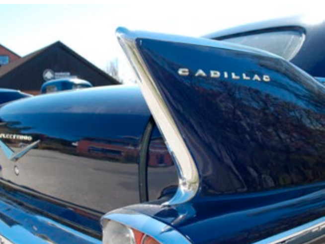
Lokale bilentusiaster hadde parkert sine klenodier slik at folk kunne studere mange lekre detaljer.