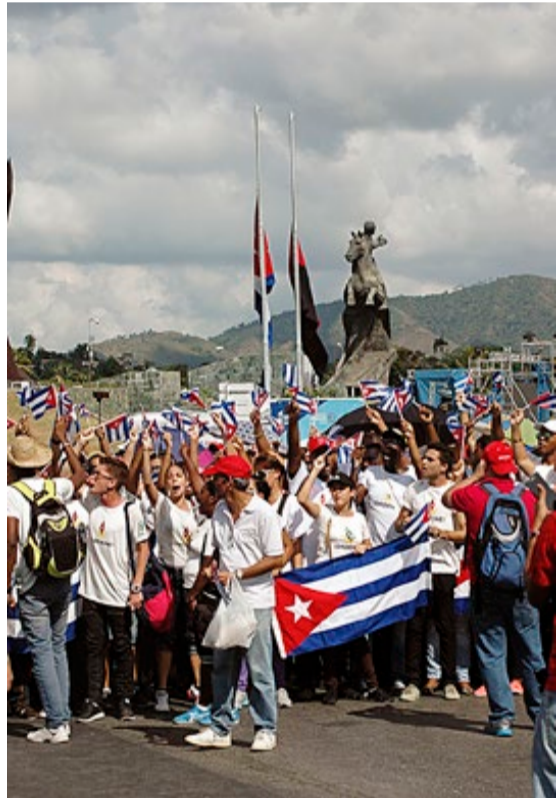
De store folkemassene på revolusjonsplassen i Santiago uttrykte sin sorg over Fidel Castros bortgang.

Flertallet sørget oppriktig da Castro gikk bort, noe vi var vitne til i ukene etter dødsfallet. De er klar over hvilke tiltak han har gjort som gagnar folk flest, noe de vet å sette pris på. På den annen side kan de også sette fingeren på hva som med fordel kan forbedres. Om Cuba kunne vi skrevet en hel bok, så resten av opplevelsene og skildringene får vi ha til gode for ikke å overskrive spalteplassen.