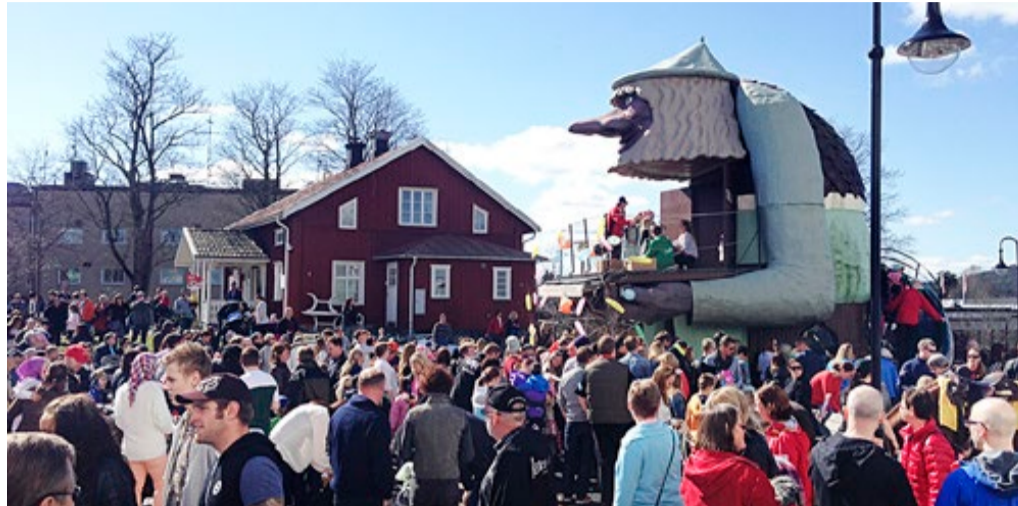
Vårmarkedet i Årjäng samler alltid massevis av folk fra begge sider av grensen. Det meste foregår på plassen foran Årjängstrollet, mellom rådhuset og hotellet.

Vårmarkedet i Årjäng arrangeres av ÅrjängsCentrumOrganisation, en underavdeling av Nordmarkens Näringsliv.