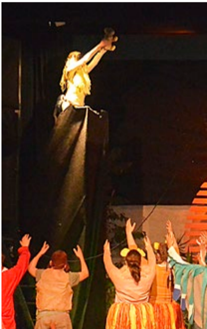
Den nyfødte løven blir hyllet på Pride Rock.