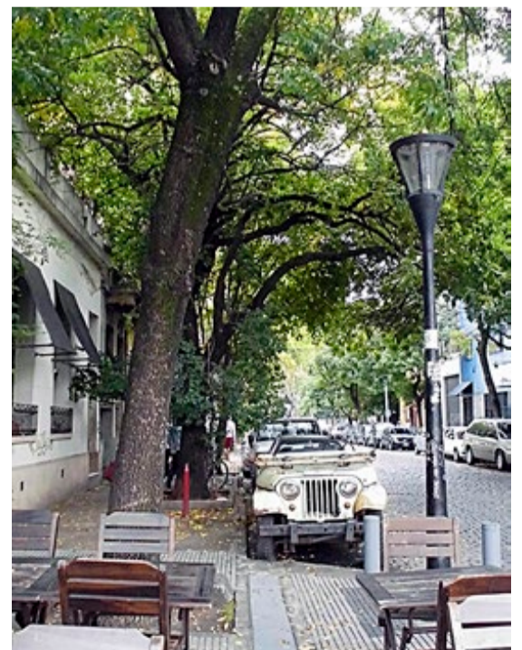
Argentinas vakre hovedstad har mange grønne lunger.