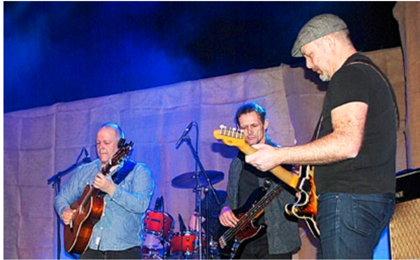
Ødemark er ett av flaggskipene i Markers musikk liv. De rutinererte ringrevne sørget nok en gang for fengende god musikk og tekster med meningsfylte budskap.