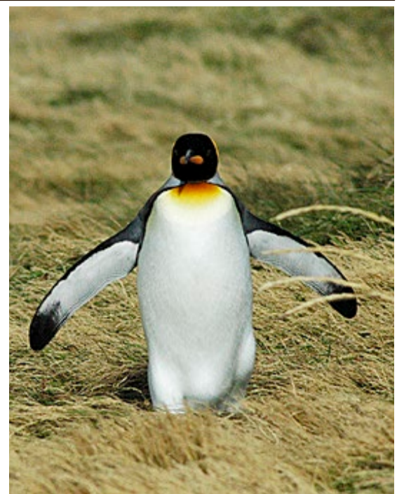
Pingu på luftetur.

Regionen Patagonia omfatter nedre del av Chile og Argentina og kan skilte med verdens sydligste fastland – så ved bomveien tok det brått slutt. Enda lenger sør, avgrensa av Magellanstredet, ligger Ildlandet, som kan nås med ferge. Det var her nede vi besluttet at seilplanene våre