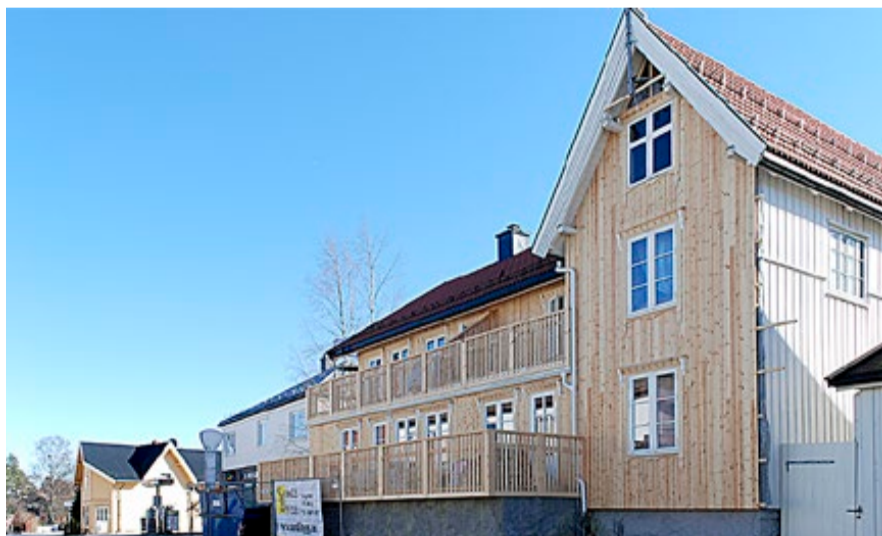
Omfattende restaureringsarbeider pågår for tiden i Storgata i Ørje sentrum.

M idt oppe i alt dette er det særdeles gledelig å registrere at et enstemmig kommunestyre i Marker har vedtatt å bidra økonomisk til at Grenseland kommer ut til alle husstander, hyttefolk og besøkende i hele 2017. Forhåpentligvis også i årene som følger. Dette betyr at kommunen ser det som viktig å sørge for informasjon til innbyggerne og fortsatt satsing på omdømmebygging. Et lokalsamfunn fungerer best når innbyggerne spiller på lag. Da må man ha en felles plattform og en felles forståelse for hva som er viktig.