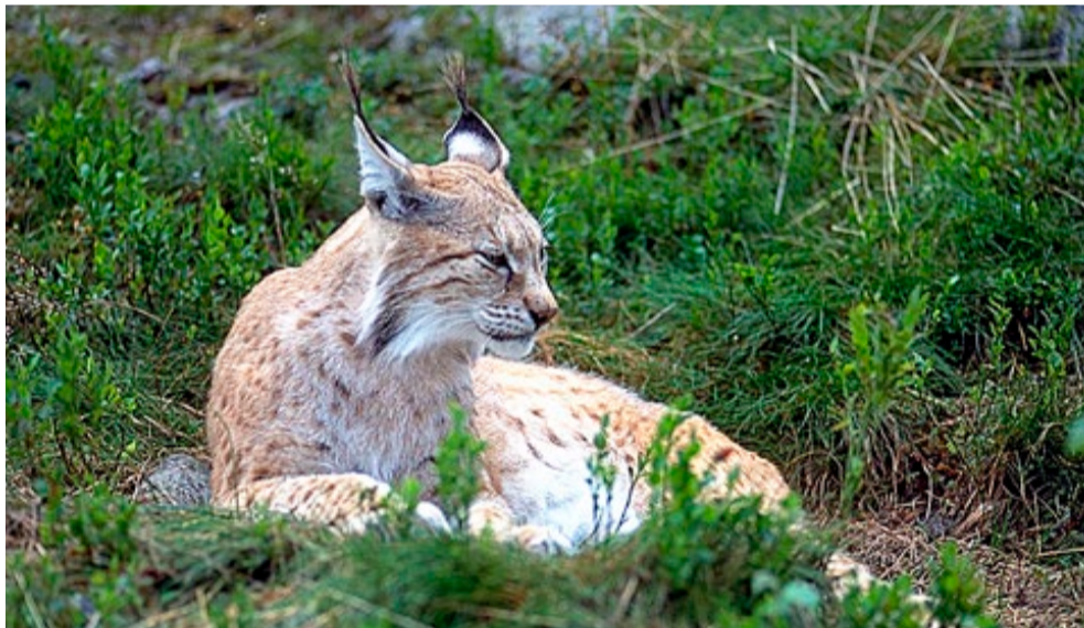
Tåler gaupebestanden å bli jaktet på? Det var hovedspørsmålet da jegere og forvaltere møttes på Ørje Brug.