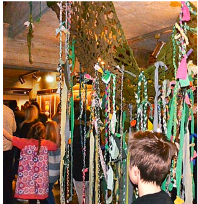
I gangen sørget lianene fra taket for at man fikk ordentlig jungelfølelse.