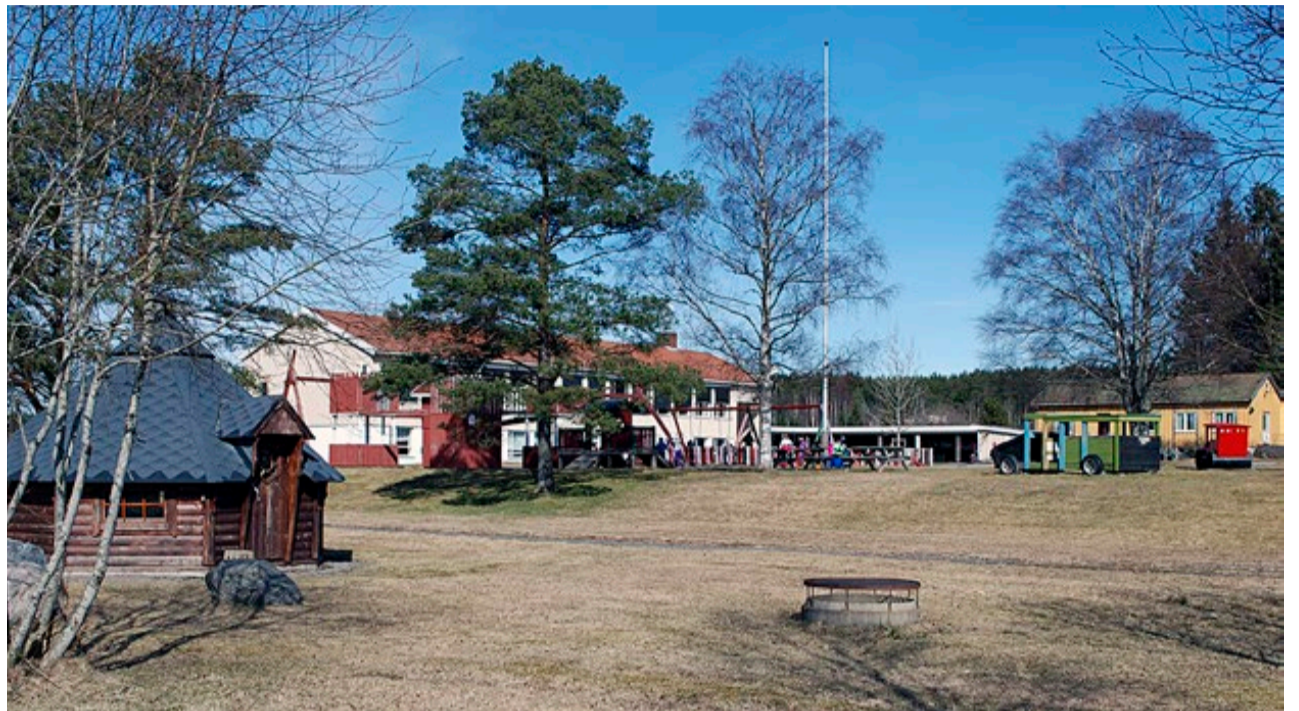
Kommunestyret har vedtatt at ny kommunal barnehage skal bygges i Ørje sentrum. Det betyr at Grimsby barnehage blir lagt ned.