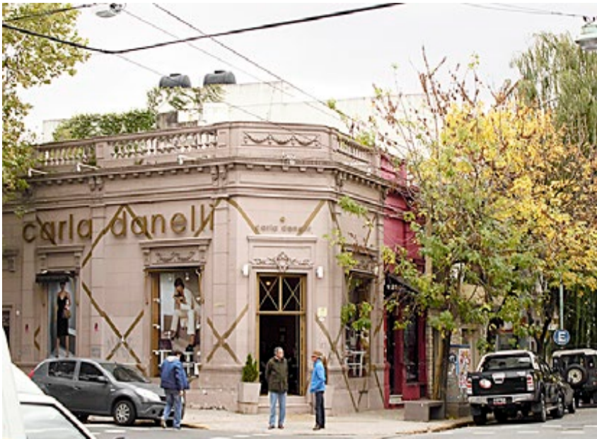
Ethvert gatehjørne i Buenos Aires bærer preg av den staselige byggestilen som baserer seg på Paris' arkitektur.