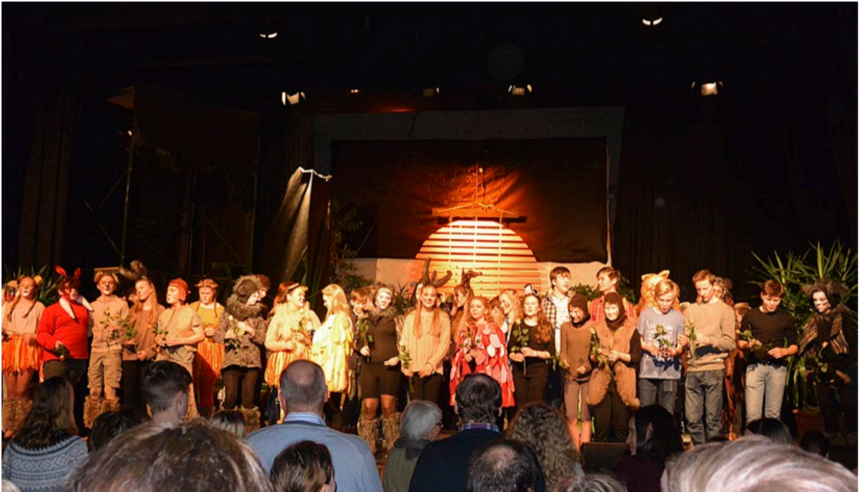
Alle elevene har gjort en stor jobb, og resultatet ble en kjempesuksess for «Løvenes Konge»..