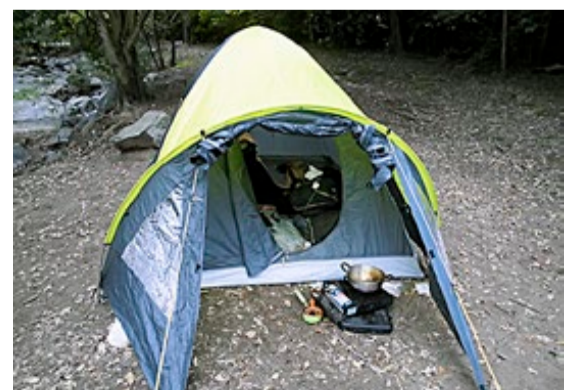
Slik så tilværelsen ut de siste ukene av Sør-Amerika-turen.