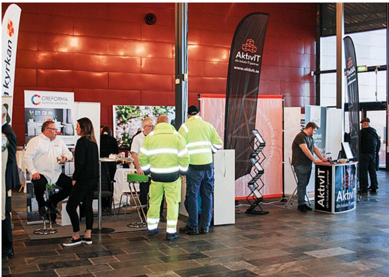
Mange besøkte næringslivsmessen i Töcksfors Shoppingcenter, men det var langt færre norske utstillere enn forventet.

Arbeidene med nye E18 går fort fremover, og om ikke mange månedene åpner den nye veien. Den spektakulære brua Norgesporten ligger som et puslespill her ved Kilebu, og arbeidene med å montere brua er i gang.