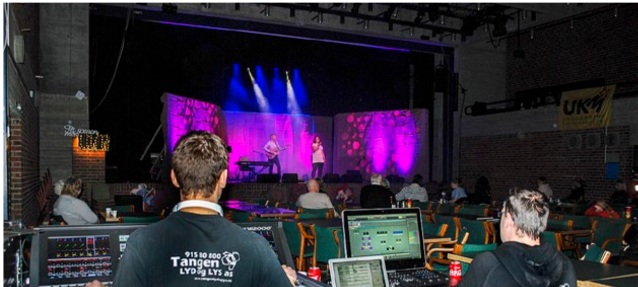
Tangen Lyd og Lys gjorde en strålende jobb under kulturvåren i rådhuset.