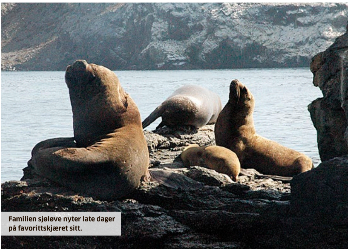
Familien sjøløve nyter late dager på favorittskjæret sitt.

Midt i Altiplanoørkenen går grensa mellom Bolivia og Chile, og vi skulle nå stifte nærmere bekjentskap med verdens lengste land. Senere skulle vi få vite at naboene i øst, argentinerne, omtaler sitt eget land som biffen, mens Chile «kun» er randen på entrecôte.