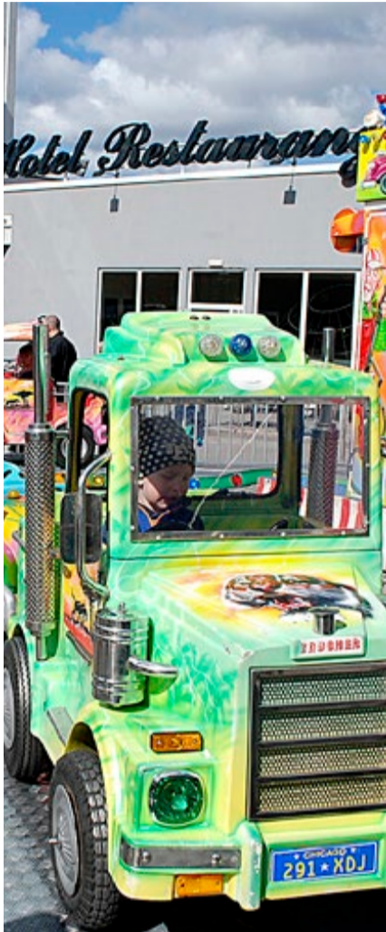
Egedes Tivoli sørger for at barna har nok å gjøre under vårmarkedet i Årjäng.

Våren er i anmarsj også hos våre grannar i vest. Vårmarkedet i Årjäng har lange tradisjoner. I år arrangeres det i påsken.