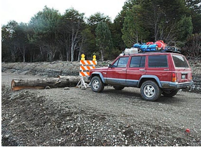
Lenger sør kom vi ikke, ved Fort Bulnes i Patagonia sa det stopp.

trengte hjelp til noe. I så fall var det bare å plinge på døra hans.