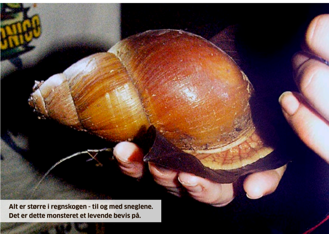
Alt er større i regnskogen – til og med sneglene. Det er dette monsteret et levende bevis på.

På humpete grusveier, endeløse asfalterte strekninger, langs bratte fjellskråninger og på tvers av et par elver hadde vi totalt tilbakelagt hundrevis av mil. Nå var det ikke mange land igjen på lista. Peru skulle bli landet vi tilbrakte mest tid i, men selv sju uker holdt ikke for å få med seg alt som var verdt å se.