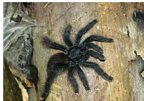
Denne tarantellarten liker seg best i palmene.

Etter å ha lekt litt Tarzan oppe i trekronene med svaiende hengebruer og en porsjon zip-lining,