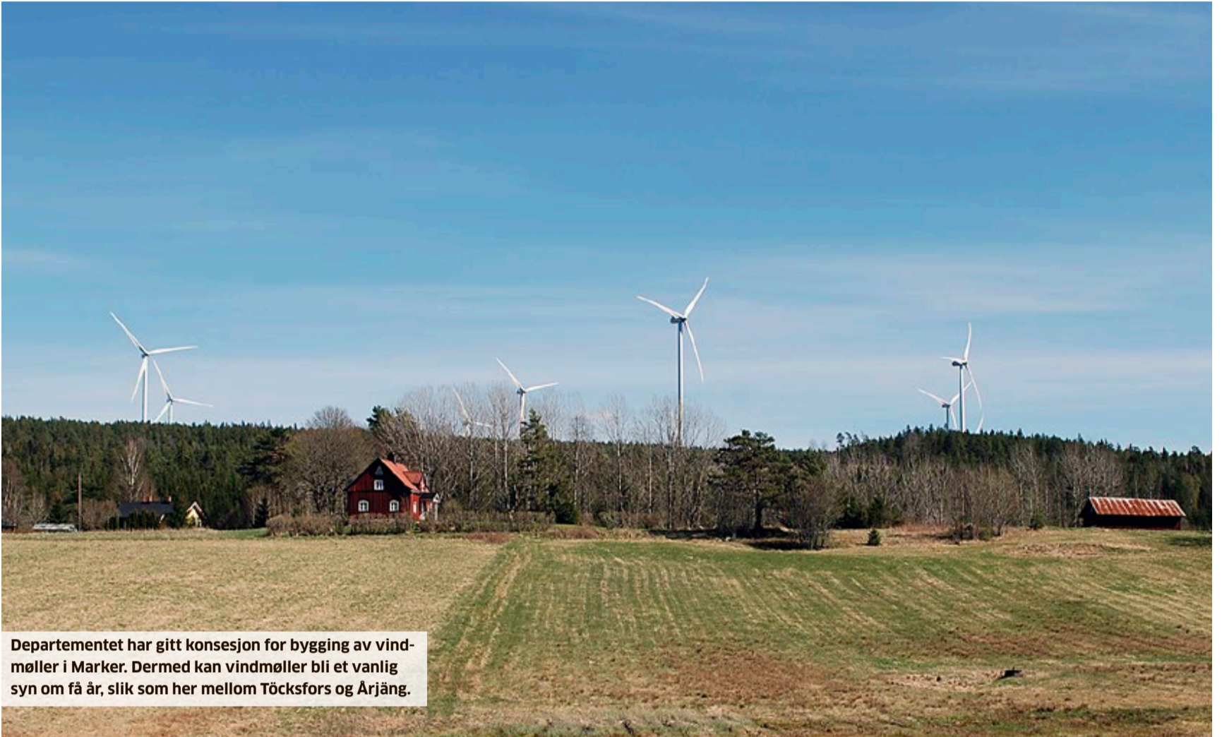
Departementet har gitt konsesjon for bygging av vindmøller i Marker. Dermed kan vindmøller bli et vanlig syn om få år, slik som her mellom Töcksfors og Årjäng.

Meningene er delte i Marker etter at olje- og energiminister Terje Søviknes (Frp) sa ja til at Scanergy AS får konsesjon til utbygging av vindkraftverk på Høgås og Joarknatten.