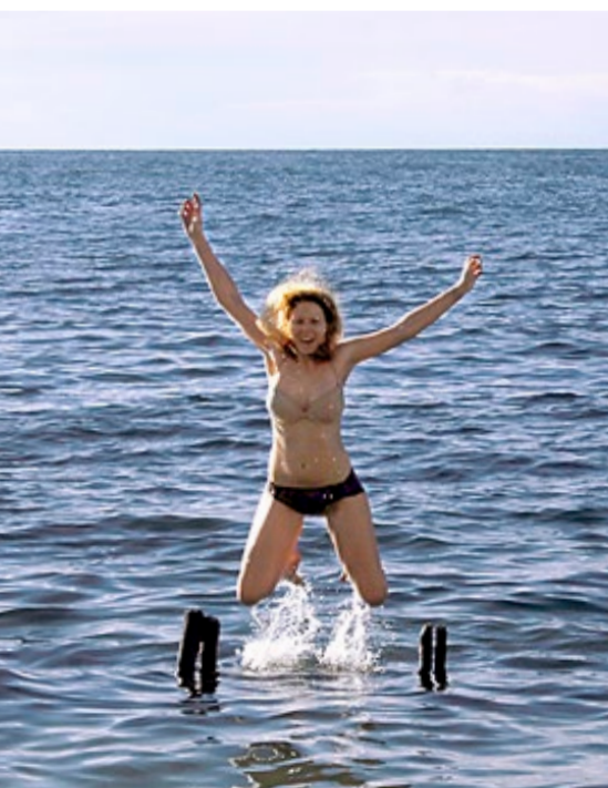
Et forfriskende bad 4.000 meter over havet.

I motsetning til sin velkjente navnebror i Brasil, er Bolivias Copacabana en liten by idyllisk plassert på en odde i Titicacasjøen. Ikke bare landskapet er annerledes, bading oppe på 4.000 meters høyde kan ikke helt sammenlignes med