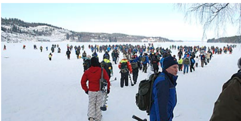
I februar 2013 så det slik ut da horder av store og små isfiskere strømmet ut på isen på Rødenessjøen. Denne vinteren har mildværet sørget for at båt er et mer egnet redskap enn isbor og pilk.

Hva fremtiden vil bringe gjenstår å se. Enn så lenge er Marker herre i eget hus. Da er det viktig å holde huset i orden. Det gjør man blant annet gjennom fornuftig drift, ansvarsfulle politikere og fortsatt gode arbeidsvilkår for et imponerende stort antall dyktige og ivrige kulturarbeidere. 2017 blir ganske sikkert nok et hyggelig år i Marker. Alt ligger til rette for det. Folk i Marker viser år etter år at de både kan og vil.