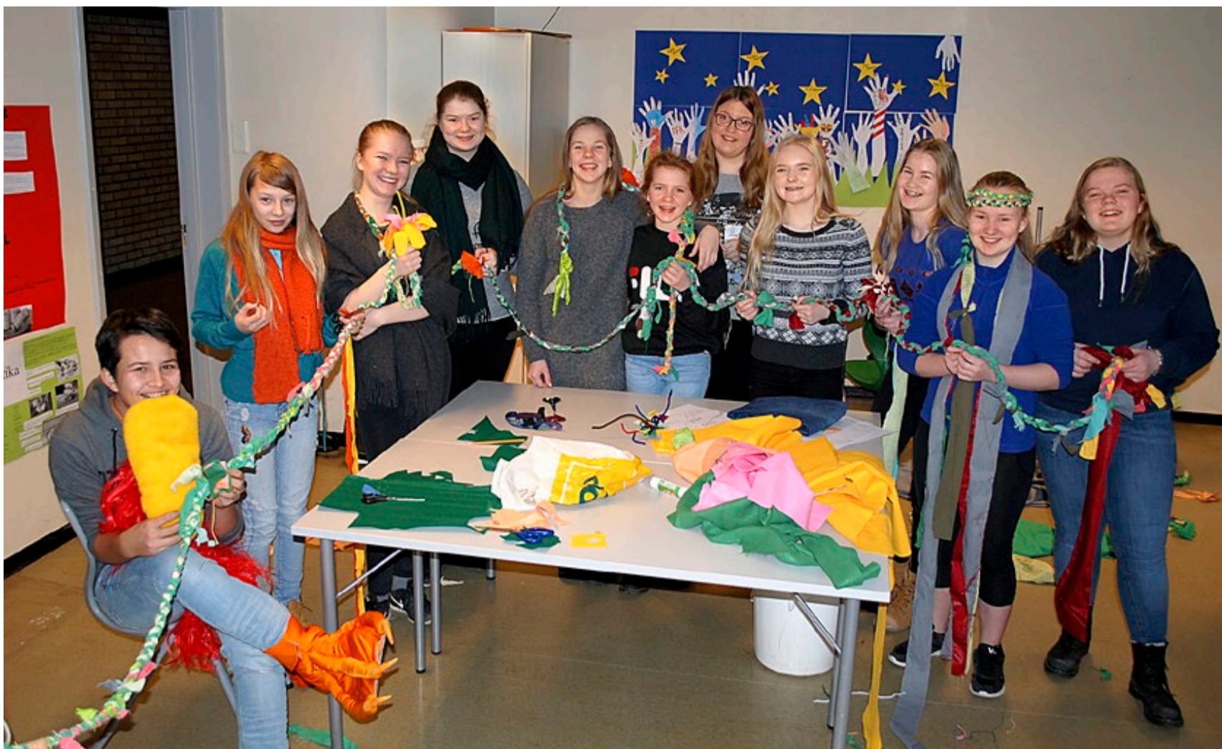
Kostymer og rekvisitter lages av denne blide gjengen av niendeklassinger. Her med en kjempelang liane, som selvsagt hører hjemme i jungelen.