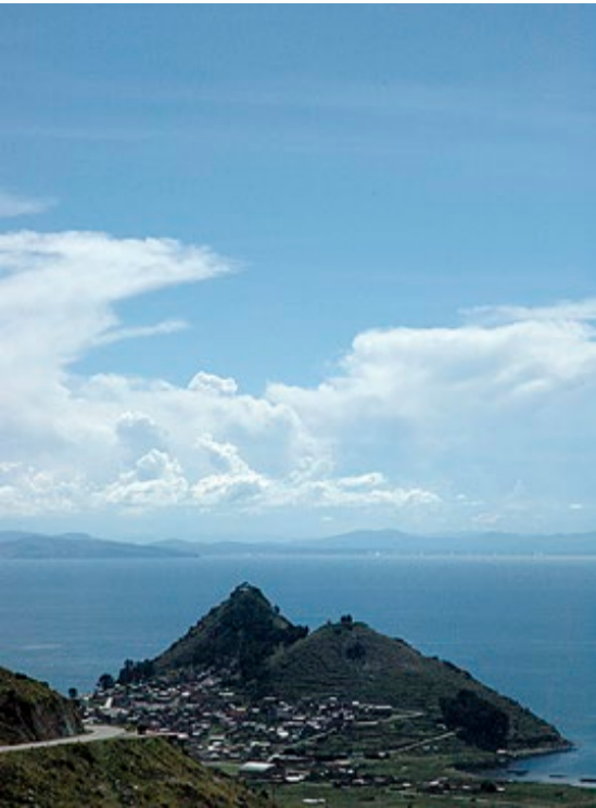
Bolivias Copacabana ligger idyllisk plassert på en odde i Titicacasjøen.

Med en flokk mennesker til stede var slangen heldigvis ufarlig. Den ville ikke ha kommet langt med sine kvelertak. Vi anslo diameteren til rundt 30 centimeter, så det kunne godt hende at den nylig hadde spist. Det kan jo gå lenge (les: måneder) mellom måltidene der i gården. Nå hadde den ikke noen annen utvei enn å prøve å spille død, men da vi fortsatt ikke mista interessen, begynte den å dirre for å vise sin misnøye. Så var forestillingen over, og mens anakondaen krøp innover i bushen igjen, vendte vi tilbake til stien og tilbakela røtter og store gjørmepytter i ekstase. Hvorfor gå på slangesafari når man kan se et king size eksemplar på høylys dag – uten engang å lete? For en opplevelse!