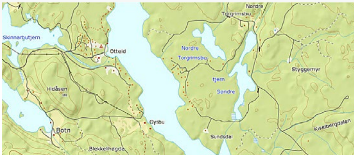
Det aktuelle området ligger sørøst i Marker.