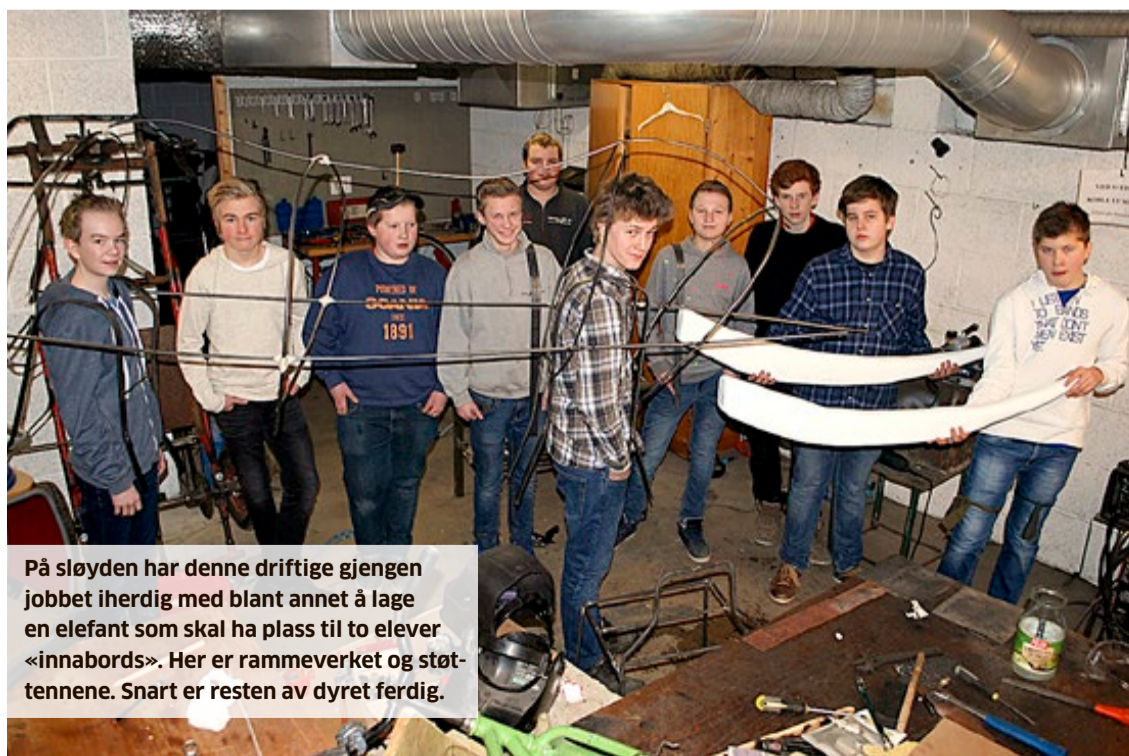
På sløyden har denne driftige gjengen jobbet iherdig med blant annet å lage en elefant som skal ha plass til to elever «innabords». Her er rammeverket og støttene. Snart er resten av dyret ferdig.

Billettene – 600 i tallet – legges ut for salg hos O. Mosbæk i Storgata fra mandag 6. februar. Løp og kjøp!