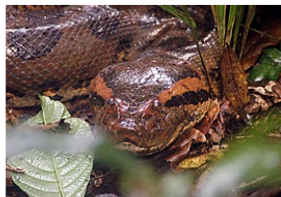
Amazonas-regnskogen bød på et tilfeldig møte med en gedigen anakonda.

Padleturen ble en våt fornøyelse, og tilbake ved brygga var vi en smule skuffa over den labre aktiviteten innsjøen hadde å by på. Imidlertid var høydepunktet rett rundt hjørnet. Vi skal love at folk fikk fart på seg da slangealermen gikk. Den digre reptilen syntes ikke noe om å bli forstyrra midt i middagshvilen og pilte inn i bushen, med de lokale gutta hakk i hæl. Taktikken deres funka, og de klarte å geleide slangen tilbake slik at vi fikk tatt en nærmere titt. Nå lå den der sammenslynga rett foran nesa på oss. Meter på meter med skinnende, kamuflert slangeskinn tilsa at dette var langt fra et gjennomsnittseksemplar. Det var en diger anakonda som var like lang som halve båten vår!