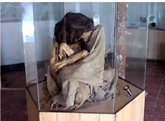
I dette museet fikk vi vårt første møte med en av flere mumier.

Med en blanding av fascinasjon og andakt iakttok vi skikkelsene, som fortsatt hadde klær og hår i behold, men som var blitt frarøvet sine offergaver av frekke gravplyndrere som hadde fått snusen i gull og glitter.