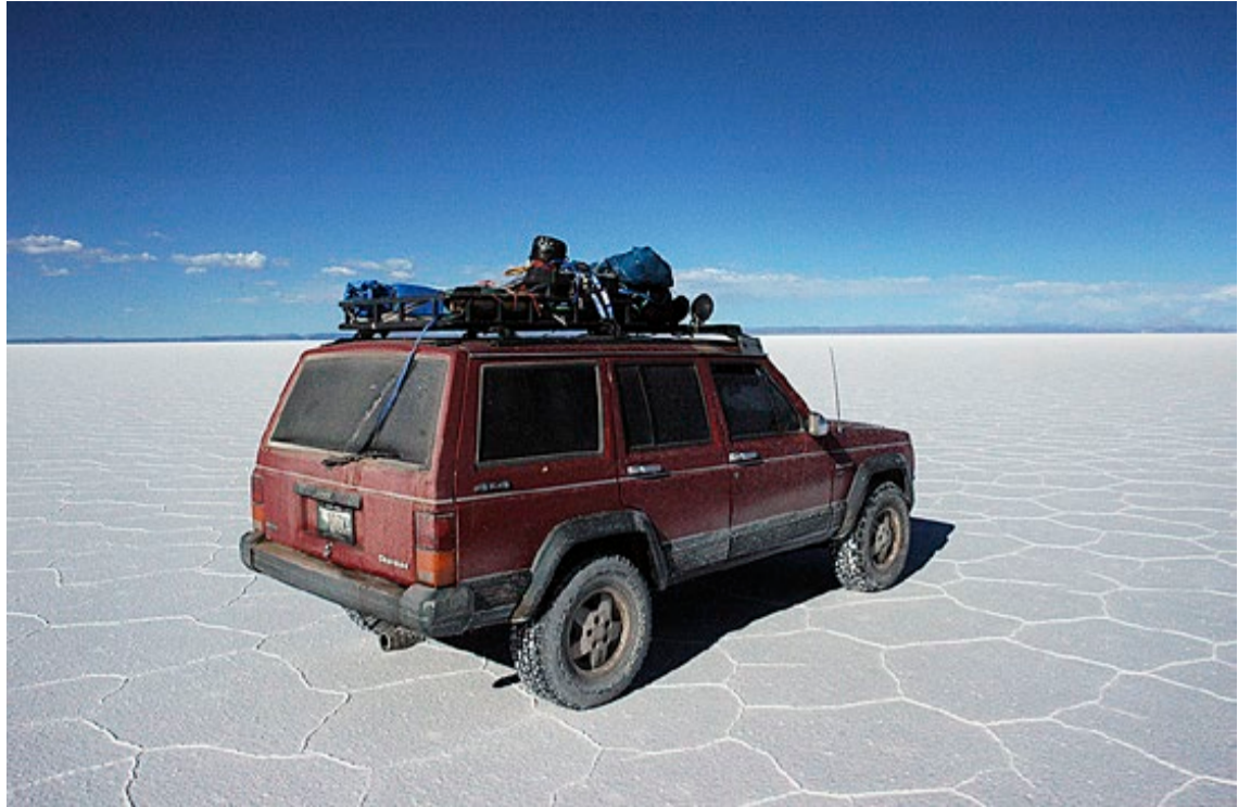
På tvers av det uendelige lappeteppet av salt.

temperaturene på en strand ved Atlanterhavskysten. Likevel var det duket for en forfriskende dukkert, etterfulgt av en kopp kakao mens vi nøt solnedgangen over de kritthvite bergtoppene i bakgrunnen.