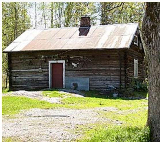
Styggemyr slik stedet så ut i 2014.