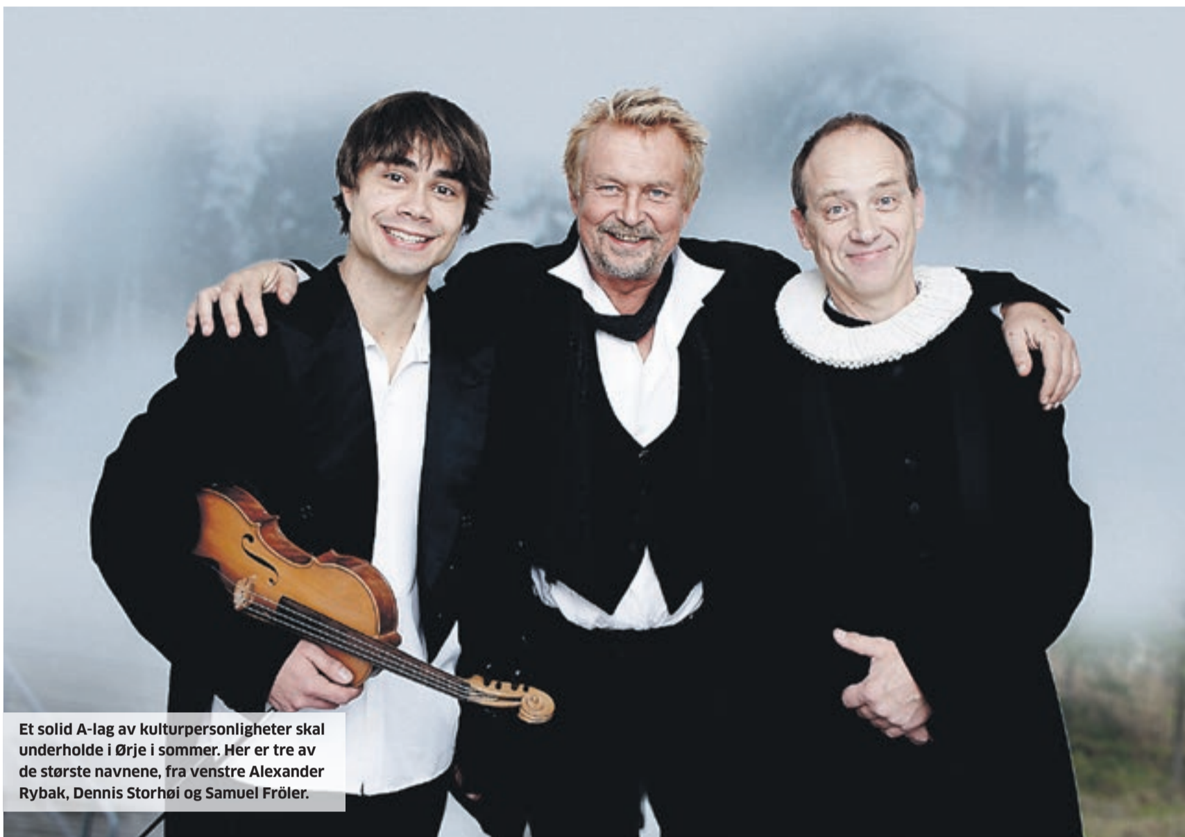
Et solid A-lag av kulturpersonligheter skal underholde i Ørje i sommer. Her er tre av de største navnene, fra venstre Alexander Rybak, Dennis Storhøi og Samuel Frøler.