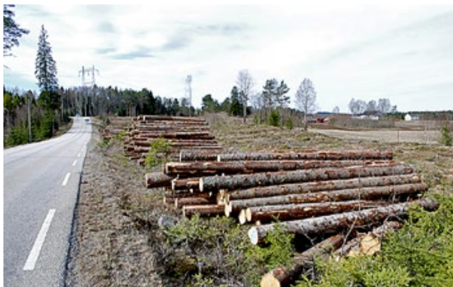
Ingen som ferdes langs Haldenvassdraget, har unngått å legge merke til den store hogstaktiviteten. Mange steder er landskapet helt forandret. Her fra Bøen, nord i Aremark.

Landskapet langs Haldenkanalen har endret seg mye det siste året. Det skyldes omfattende hogst, som igjen er et resultat av gode tømmerpriser.