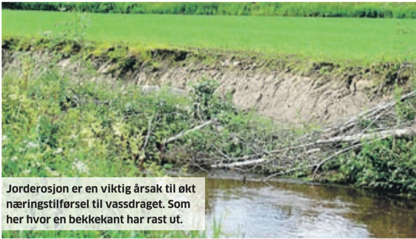
Jorderosjon er en viktig årsak til økt næringstilførsel til vassdraget. Som her hvor en bekkekant har rast ut.

Haldenvassdraget fikk status som pilotvassdrag i 2012, noe som betyr at man skal få fram ny kunnskap og bygge erfaringer som skal komme andre områder i Norge til nytte i arbeidet med å få rent vann.