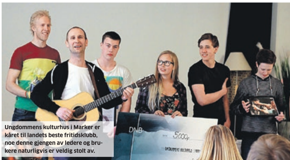
Ungdommens kulturhus i Marker er kåret til landets beste fritidsklubb, noe denne gjengen av ledere og brukere naturligvis er veldig stolt av.

– På fritidsklubbene er det uvanlig høy tetthet av hverdagshelter. Det kan være klubblederen som utrettelig kjemper ungdommenes sak, selv når ingen andre gjør det. Eller det kan være jenta som alltid tar ansvar for at ingen faller utenfor