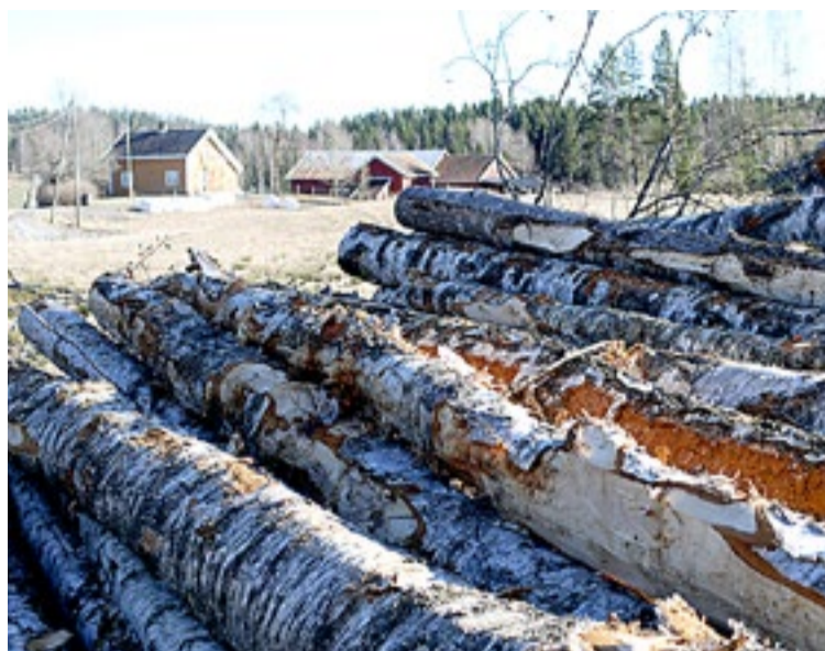
Nord for Otteid i Marker er det tatt ut mye tømmer.