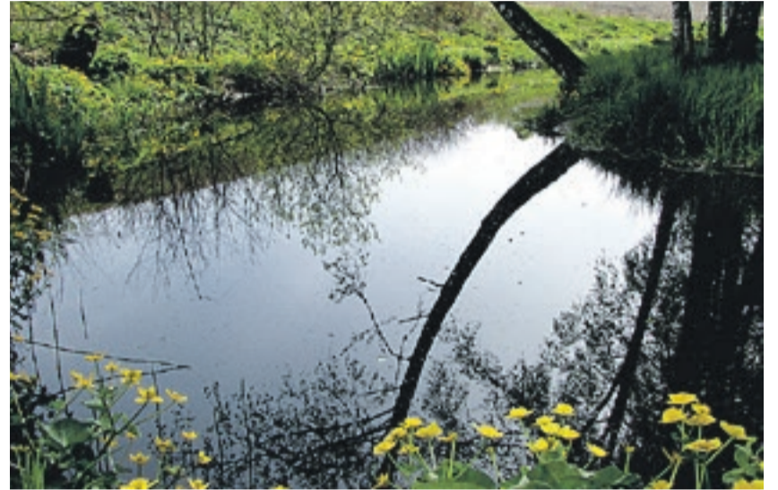
Vegetasjon helt inntil bekker og elver hindrer avrenning og gir bedre vannkvalitet.

Planen det jobbes etter, sier at det skal investeres 500 millioner kroner i vann og avløp i sentrum av Halden de nærmeste årene. I fjor ble det investert 88 millioner kroner i forbedringer, vesentlig utskifting av gamle rørledninger fra fellessystem til separatsystem.