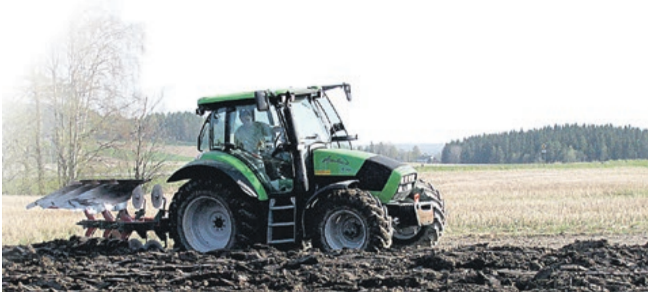
Jordene må pløyes, men tidspunktet for jordbearbeidingen kan være avgjørende for å minske avrenningen.

Hovedutfordringen for å oppnå god vannkvalitet i hele Haldenvassdraget er å få til nok tiltak innenfor landbruket. Bioforsks beregninger sier at landbruket står for om lag 50 prosent av tilførselen. Det handler i hovedsak om å hindre at jorda renner ut i vassdraget. Det er bundet fosfor til leirjord, og fosfor er mat for alger. Det vil alltid være avrenning fra jordbruksarealer, men det gjelder å benytte produktionsmetoder og kunnskap som reduserer avrenningen mest mulig.