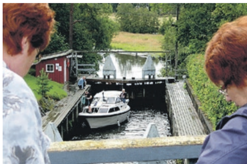
Sluseanleggene i Haldenkanalen er imponerende. Her er det to skuelystne som følger med når en fritidsbåt tar seg oppover gjennom Strømsfoss sluse.