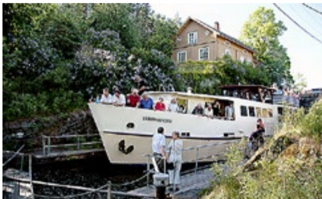
MS «Strømsfoss» går i rutetrafikk på Haldenkanalen.