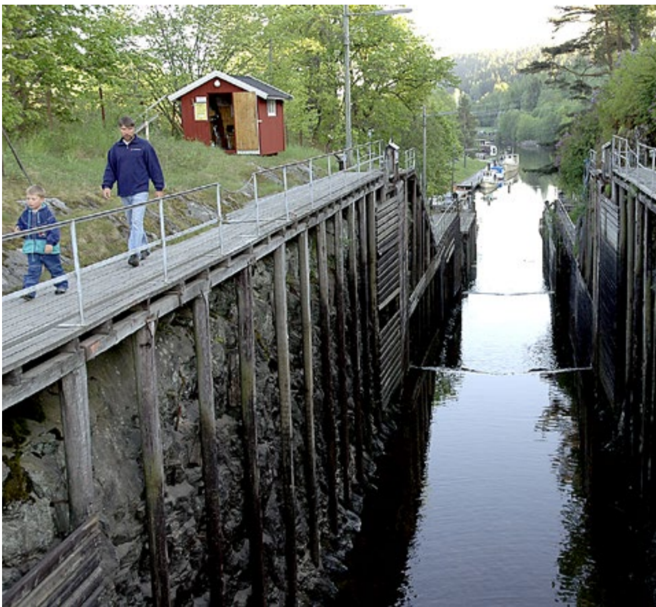
Det er slik reiselivsnæringen og alle som ferdes på vassdraget ønsker å se Ørje sluser; åpne og i fri bruk både oppover og nedover. Slusene har vært stengt siden 2008. Påvist krepsepest på begge sider kan imidlertid føre til gjenåpning allerede i sommer.