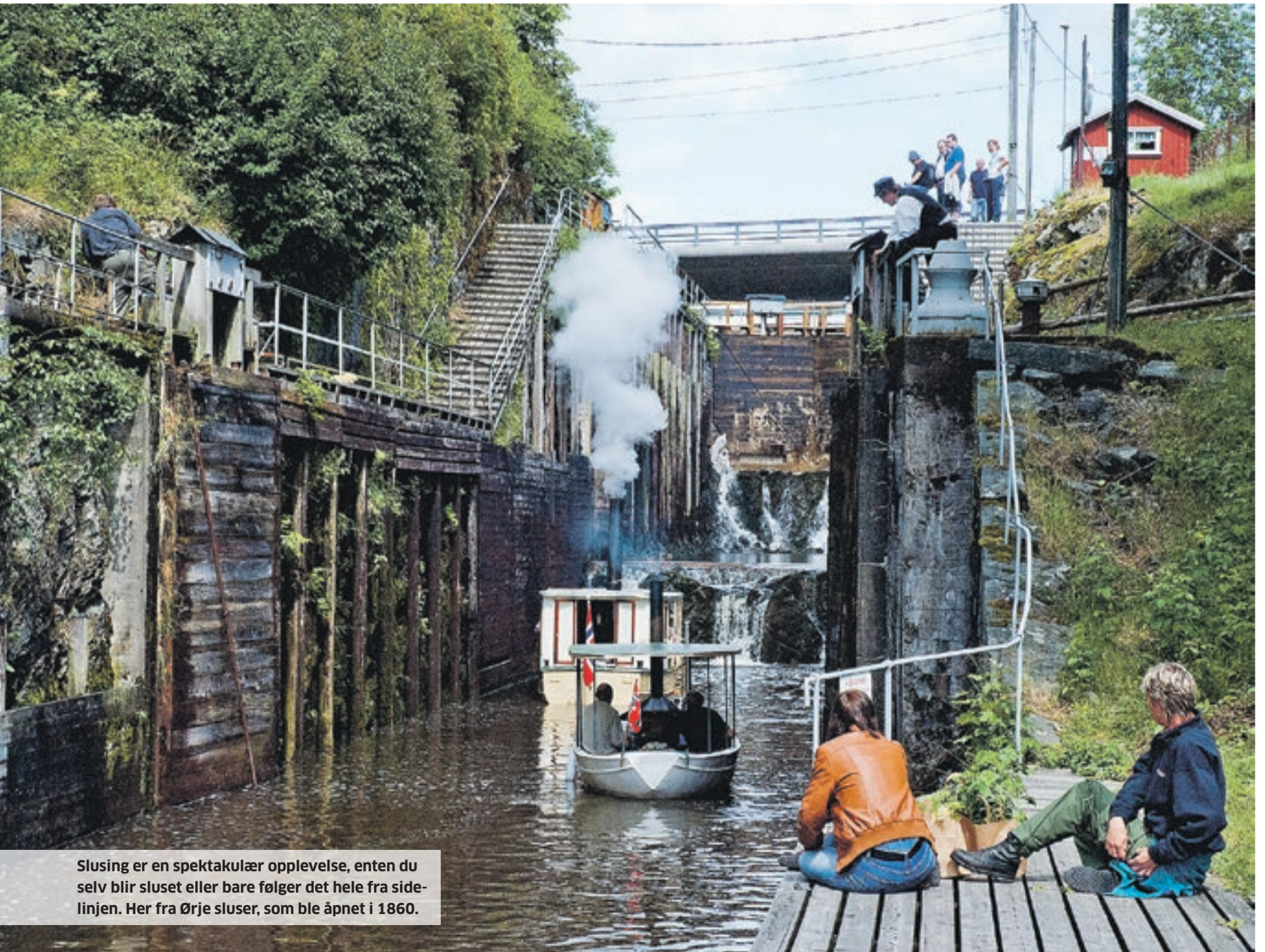
Slusing er en spektakulær opplevelse, enten du selv blir sluset eller bare følger det hele fra side-linjen. Her fra Ørje sluser, som ble åpnet i 1860.

2014: Fra Riksantikvaren får Kanalselskapet lønnsmidler til kanalreparatørene, samt midler til materiell; til sammen kr 1.648.000. Kanalselskapet får kr 5.329.986 i prosjektmidler, fordelt på istandsetting av Båtslippen i Vadet, Tistedal (kr 3.998.256) og kr 1.331.730 til betaling av tidligere innkjøpte jernbaneskinner til Skulerud.