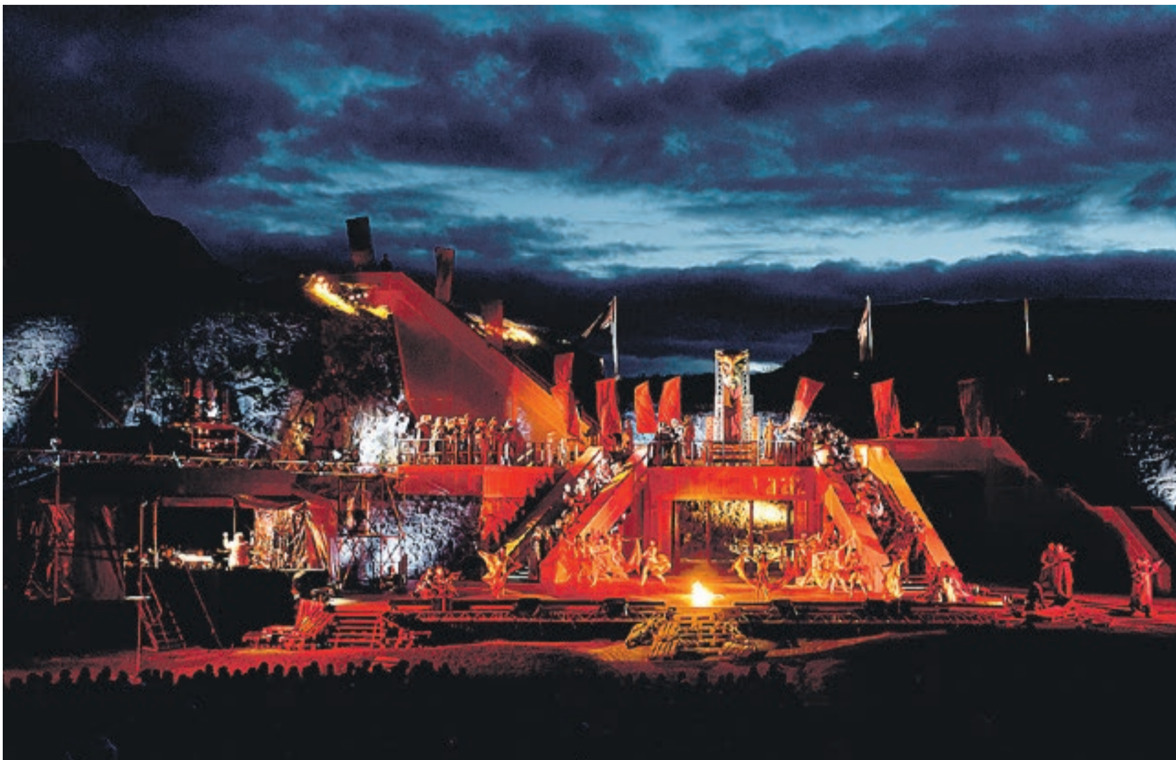
Utendørsopera på Fredriksten festning er spektakulært og en fantastisk opplevelse. Her fra «Nabucco» i 2013.