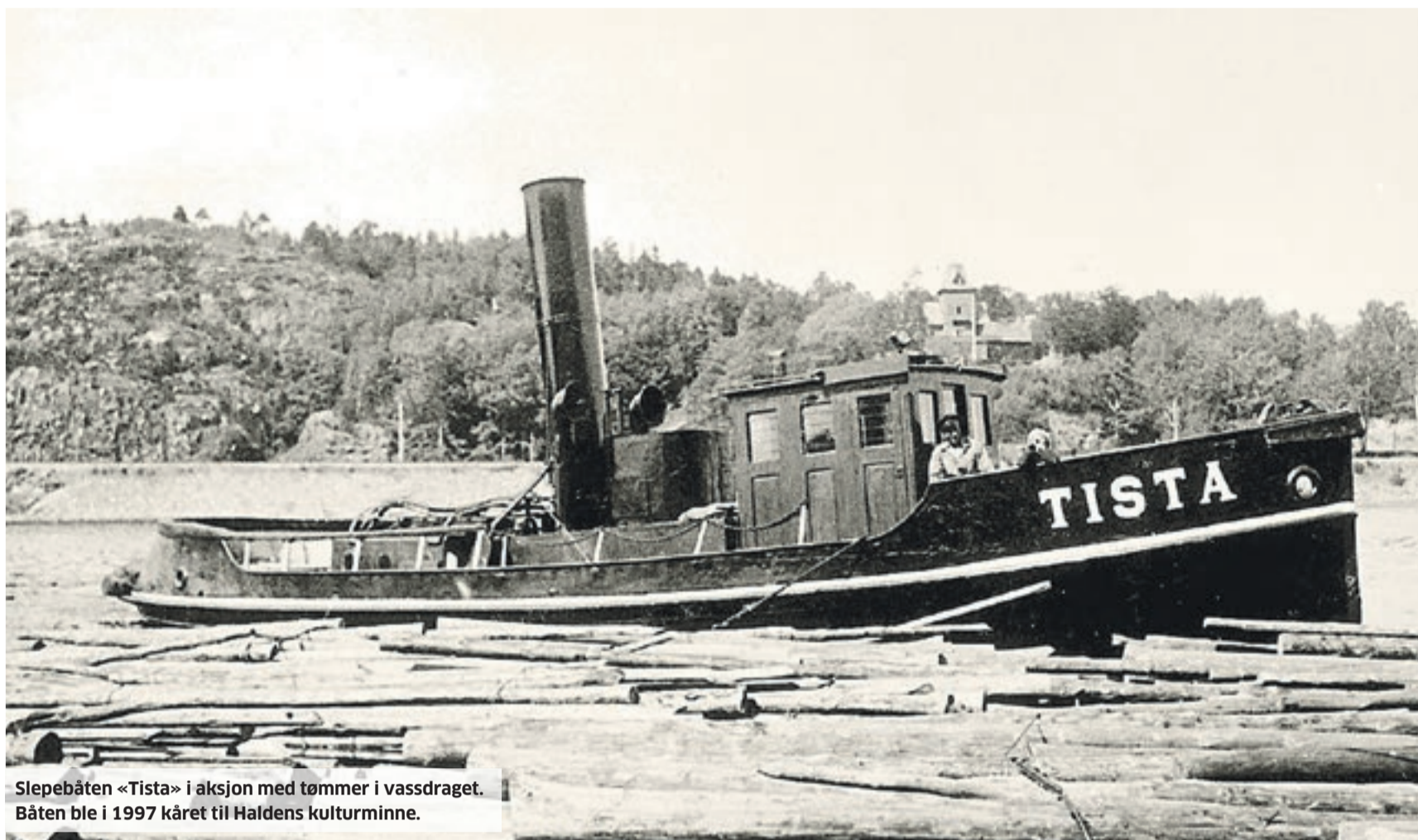
Slepebåten «Tista» i aksjon med tømmer i vassdraget. Båten ble i 1997 kåret til Haldens kulturminne.