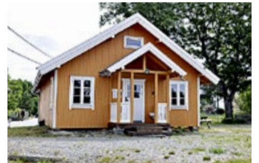
Fjøset i Strømsfoss.