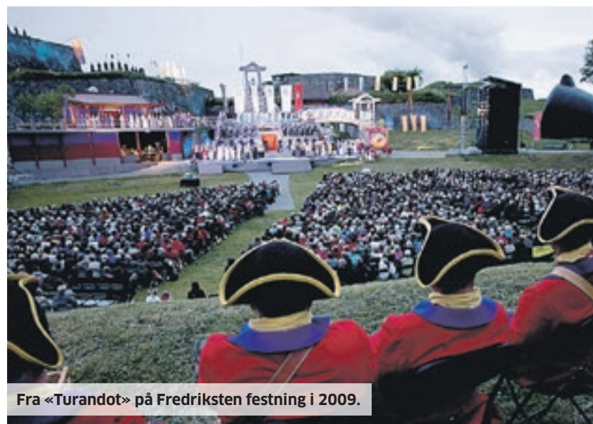
Fra «Turandot» på Fredriksten festning i 2009.