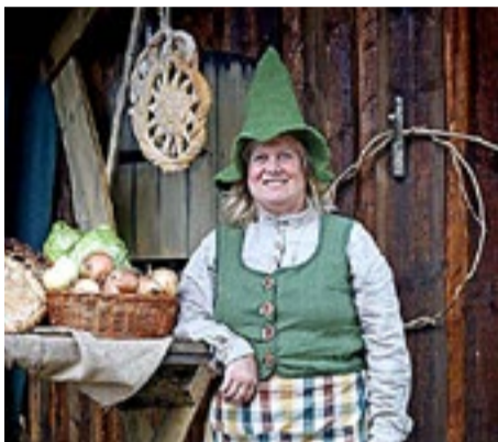
Stubbefolket og Barnas Greseland støttes av Regionalparken.