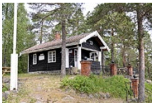
Flagghytta i Øymark.