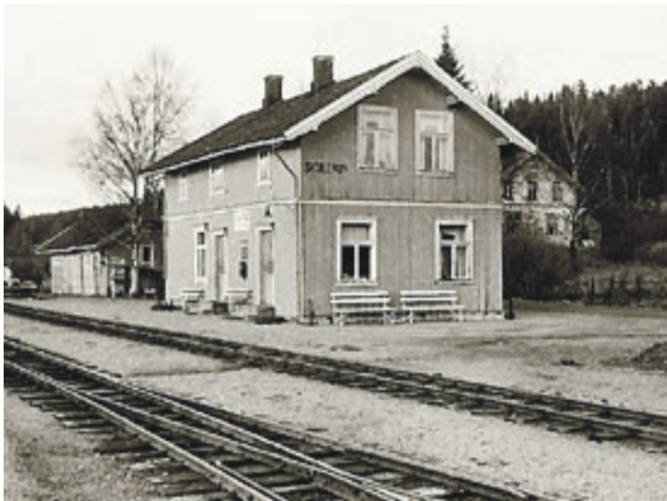
Skulerud stasjon er borte, men det arbeides med planer om å bygge stasjonsbygningen opp igjen, helt etter tidligere spesifikasjoner.