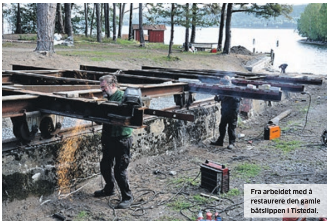
Fra arbeidet med å restaurere den gamle båtslippen i Tistedal.

De siste årene har Haldenkanalen Regionalpark tilrettelagt for bygging av en rekke nye gapahuker og bålplasser som egner seg godt til rast og overnatting. Plassene er ment for både padlere og andre som liker en natt eller to ute i naturen. De nyeste gapahukene er bygget i solid tømmer og plassert på strategisk steder fra Tistedal i sør til Rømskog og Aurskog-Høland i nord.