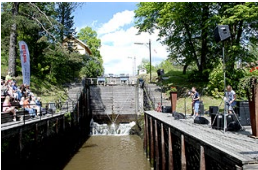
«Lørdag i slusene» i Ørje er et gratis kulturtilbud til alle gjennom hele sommeren.