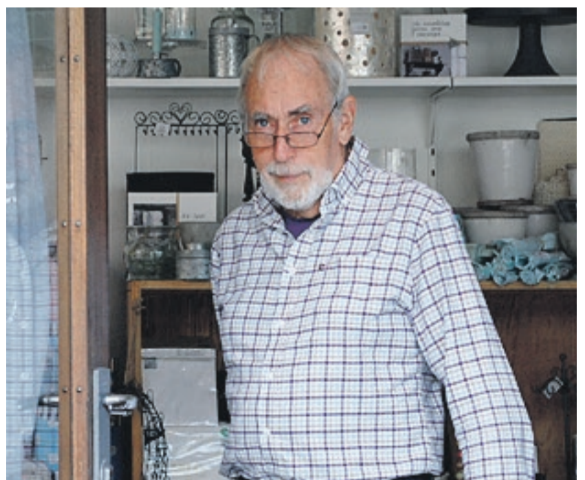
Eilif Mosbæk har skrevet boken om Engebret Soot.

Tlf.: 419 08 486 • 69 81 32 66 • www.bondestua.no