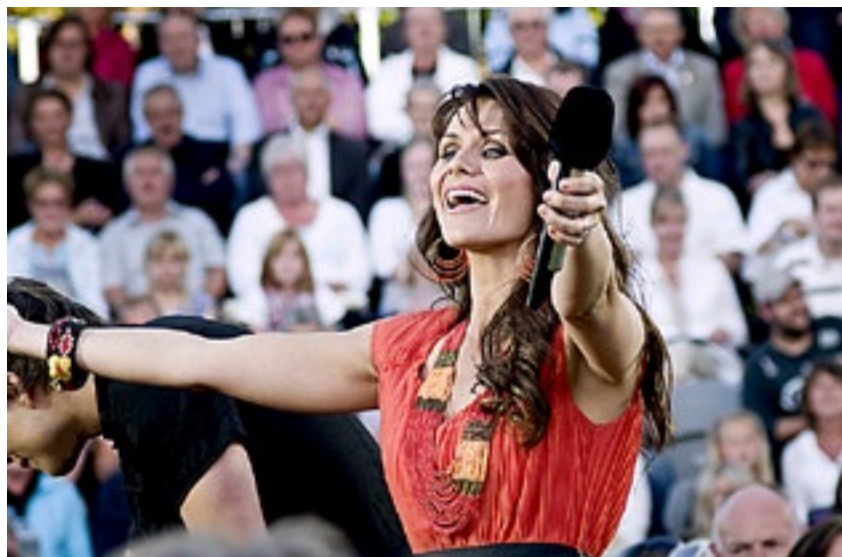
Kathrine Moholt er en populær programleder for Allsang på Gresen.