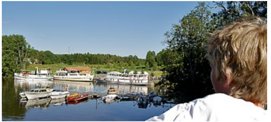
Strømsfoss er en idyll. Her er gjestehavn for småbåter, brygge for damp- og passasjerbåter og mye, mye annet.