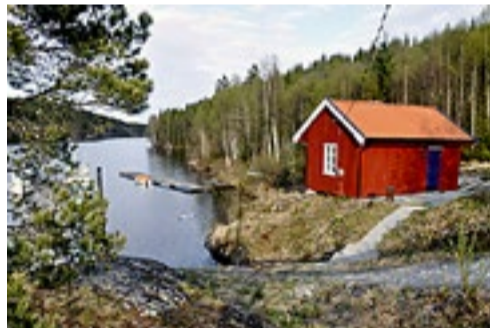
Fløterhytta på Brekke i Halden.