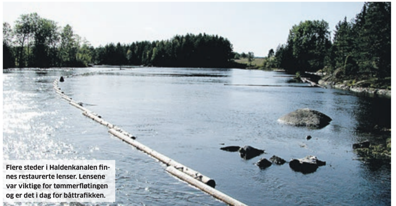
Flere steder i Haldenkanalen finnes restaurerte lenser. Lensene var viktige for tømmerfløtingen og er det i dag for båttrafikken.

Vi må også huske at vi har god vannkvalitet i våre skogsbekker og skogsvann. Det har vært utfordringer med at vannet har blitt surt grunnet mye tilførsel av sur nedbør sydfra. Nå har disse tilførselene blitt mye mindre, og