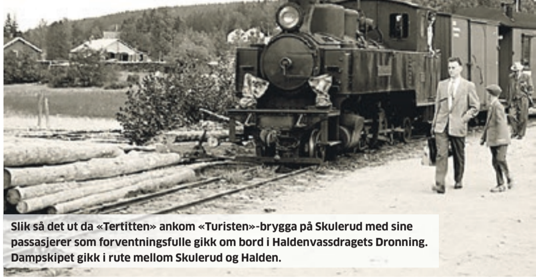
Slik så det ut da «Tertitten» ankom «Turisten»-brygga på Skulerud med sine passasjerer som forventningsfulle gikk om bord i Haldenvassdragets Dronning. Dampskipet gikk i rute mellom Skulerud og Halden.

Det gamle knutepunktet Skulerud, helt syd i Aurskog-Høland, har vært et særdeles rolig sted de siste tiårene. Men slik var det ikke i «gamle dager». Det er på Skulerud Haldenkanalen starter, og det var her DS «Turisten» i sin tid møtte «Tertitten».