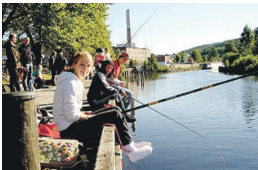
Haldenkanalen brukes i dag hovedsakelig til rekreasjon. Disse ungdommene prøver fiskelykken i Tista i Halden, bare noen hundre meter før vassdraget møter Iddefjorden.