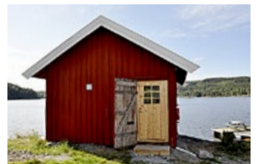
Smia i Skulerud i Aurskog-Høland.