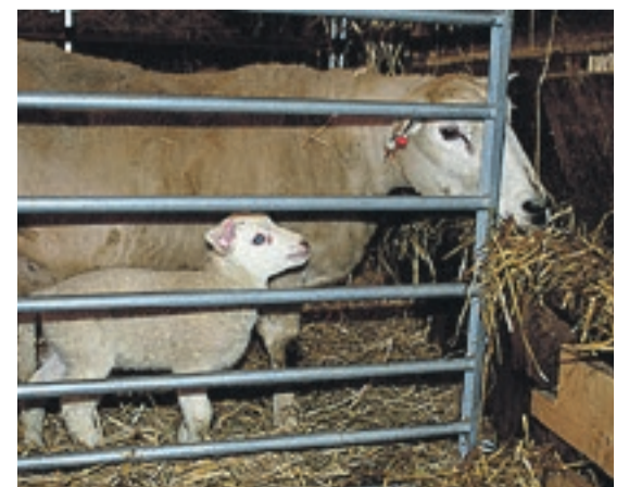
Det kan være vanskelig å se forskjell på lammene, men det gjør sauemor. Derfor er det viktig å ha god kontroll så ingen lam blir utstøtt.

– Men akkurat nå er det lammingen som gjelder, sier han.