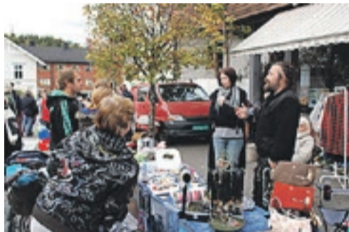
Marked i Ørje betyr mye folk, spennende tilbud og en stemning som minner om langt sydligere breddegrader.