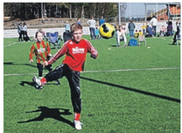
Grenseland Cup bød på et fullpakket program med mye fotball og tilhørende kos i det flotte været.