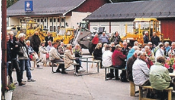
Mange fant veien til Vegmuseet under Ørjedagen i fjor. I år arrangeres dagen 4. juni.

Interessen for Vegvesenets gamle maskiner og utstyr er stor. Derfor har noen entusiaster sørget for å bygge opp et attraktivt Vegmuseum på den gamle veistasjonen like sør for Ørje sentrum. Der arrangeres hvert år en åpen dag - Ørjedagen. Da kommer det massevis av folk for å minnes tidligere tider, men også for hygge seg blant venner og bekjente med samme interesse.