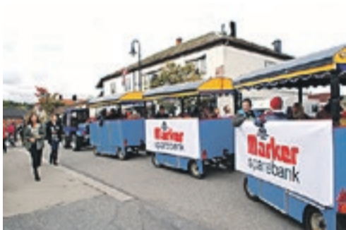
Marker Sparebank-toget er et populært innslag i Ørjes sentrumsgater.