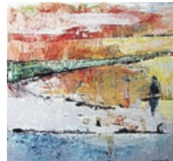
Asbjørn Strøms bilde «Koloritt» fra 1992.