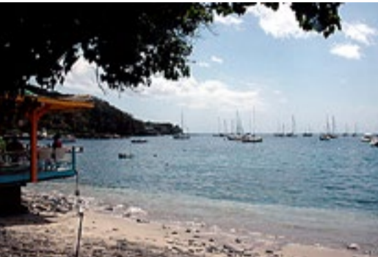
Strandstemning på Guadeloupe.

om kvelden ble avslutta med en deilig gryte bestående av ris, papaya, kokos og grønne bananer tilberedt på leirbålet på stranda.