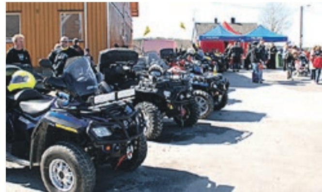
Alt som durer stilles ut under Vårmonstringen i Aremark. Her fra fjorårets folkefest. Biler og mc-er på travbanen (øverst) og nye ATV-er ved Fosby skole.