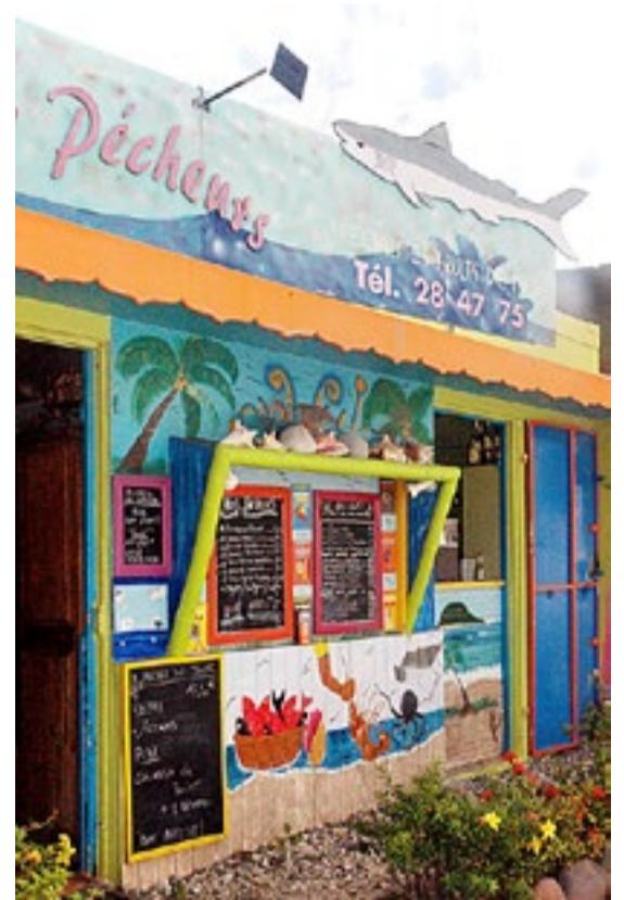
Karibiske farger de luxe!

Neste morgen satte vi seil for hovedstaden, som skulle bli siste stopp for vårt ekstramannskap. Flyet deres gikk dagen derpå, og vi ville ha muligheten til å se litt av byen, som ifølge brosjyrene skulle ha en staselig gamleby som minna om pirattiden. Førsteintrykket av byen og havna var imidlertid ikke så bra. Et stort cruiseskip tok opp hele på kaia, og en mulighet for oss å legge til fantes ikke. Vi måtte derfor finne et sted å kaste anker, og det eneste egnede stedet var ved utløpet av et renseanlegg. Det kunne ikke bare sees, men i tillegg forderva det luktesansen vår. Vi pella oss på land så fort som mulig og havna i en stor handlegate stappfull av