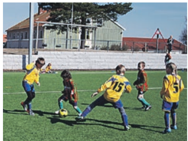
Friske dueller og mye godt spill å se på Marker Kunstgress da den aller første Grenseland Cup ble arrangert på påskens siste dag.