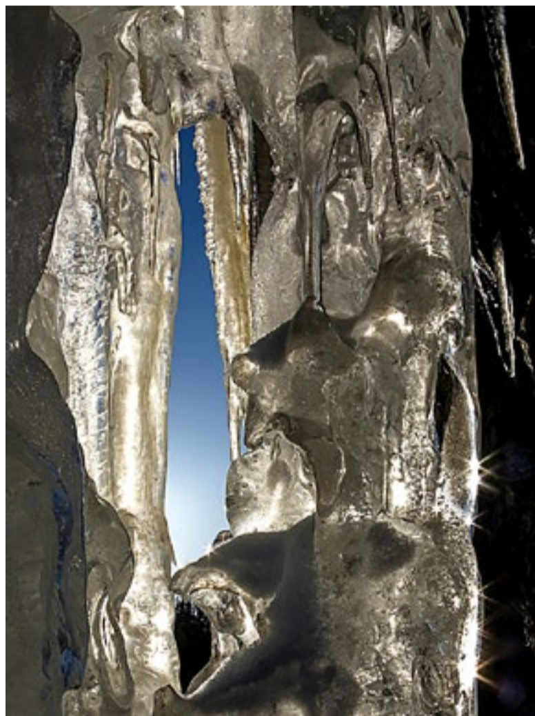
Sigmund Heeds vinnerbilde i fargeklassen.