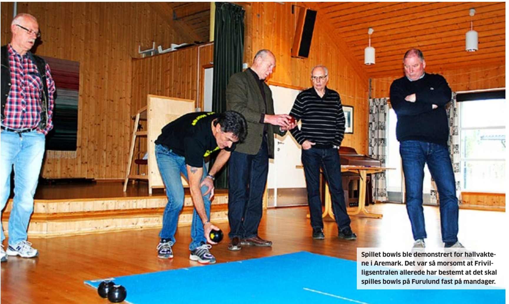
Spillet bowls ble demonstrert for hallvaktene i Aremark. Det var så morsomt at Frivilligsentralen allerede har bestemt at det skal spilles bowls på Furulund fast på mandager.