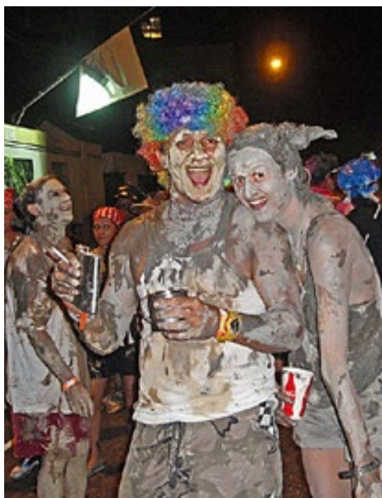
Noen tok den heeeelt ut.

Først måtte vi løsne hele roret fra skroget. Det var lettere sagt enn gjort. Det satt dønn fast! Tretti år med saltvann hadde gjort sitt til at det hadde grodd fast, og boltene lot seg ikke rikke. Etter ørtentfor ti forsøk med diverse bor, meisel og vinkelslipere løsna omsider hovedskruene,