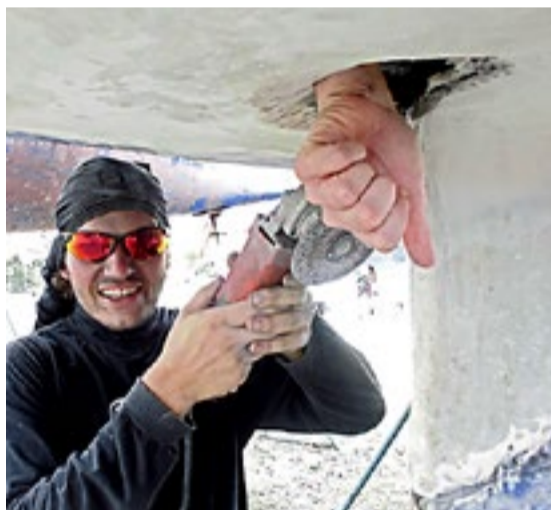
Oops - vi har et problem!

Så var det duket for den største overraskelsen, dessverre et resultat av en verfttabbe. Laget med antifouling, som skal beskytte bunnen av skroget mot alger og plastpest, hadde på mistenkelig vis flassa av i større mengder rundt og rett bak kjølen. Dette kunne da neppe være en tilfeldighet, tenkte vi mens vi ga oss i kast med slipemaskinen.