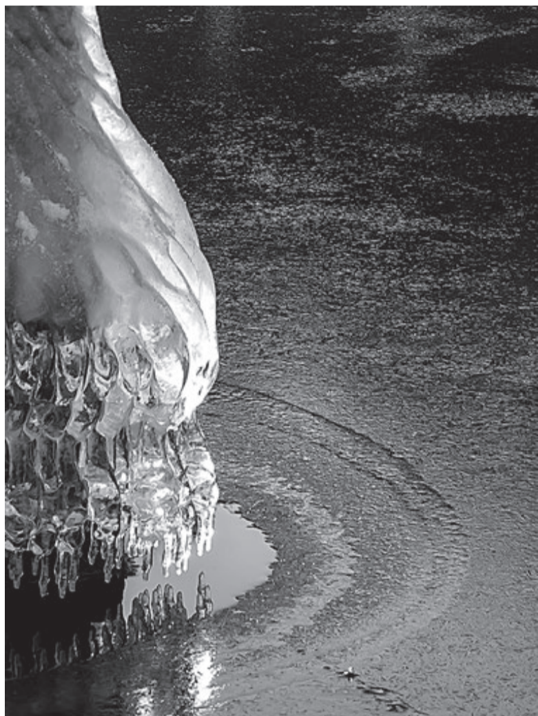
Sigmund Heeds vinnerbilde i svart/hvitt-klassen.