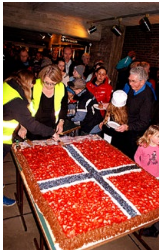
Bakergaarden hadde bakt en gedigen sjokoladecake med norsk flagg laget av jordbær, blåbær og krem.