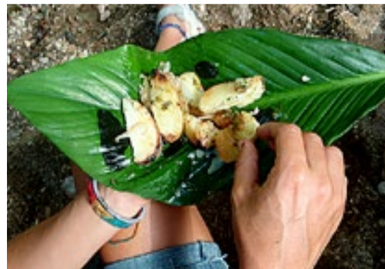
Hvorfor bruke tallerken når man har bananblader ...

Etterpå spiste vi et godt måltid, servert på naturens egne tallerkner, bananblader. Mens vi spiste, slo vi av en prat med de andre seilerne. Et herlig sted, og antageligvis noe à la øyene vi skal besøke etter Trinidad.