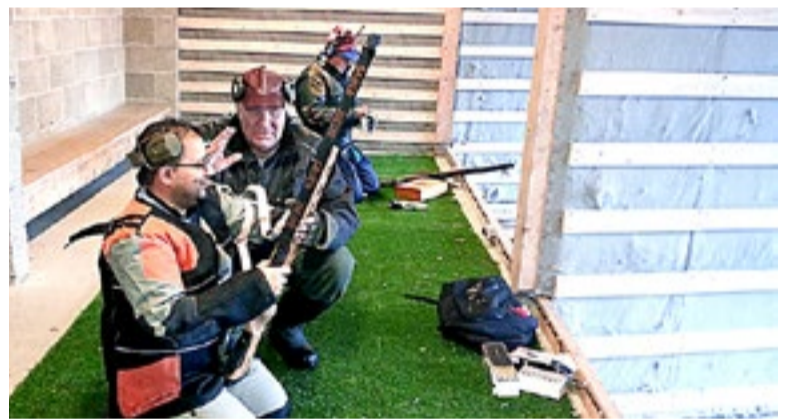
Rømskog Skytterlag har arrangert grovfeltskyting på skytebanen.