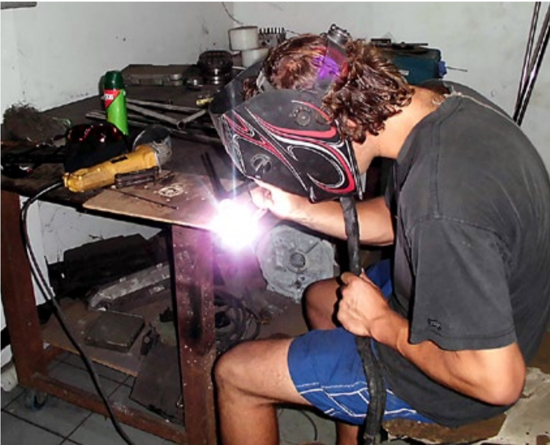
I full gang med sveisinga.

Da vi kom til Trinidad, hadde vi ikke regna med å bli her så lenge. Vi skulle jo bare fikse noen ting for så å dra videre til Grenadinene. Men i skrivende stund er vi fortsatt her. Nå ser vi imidlertid en ende på alle prosjektene.