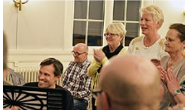
Kor og musikere samlet rundt flygelet.