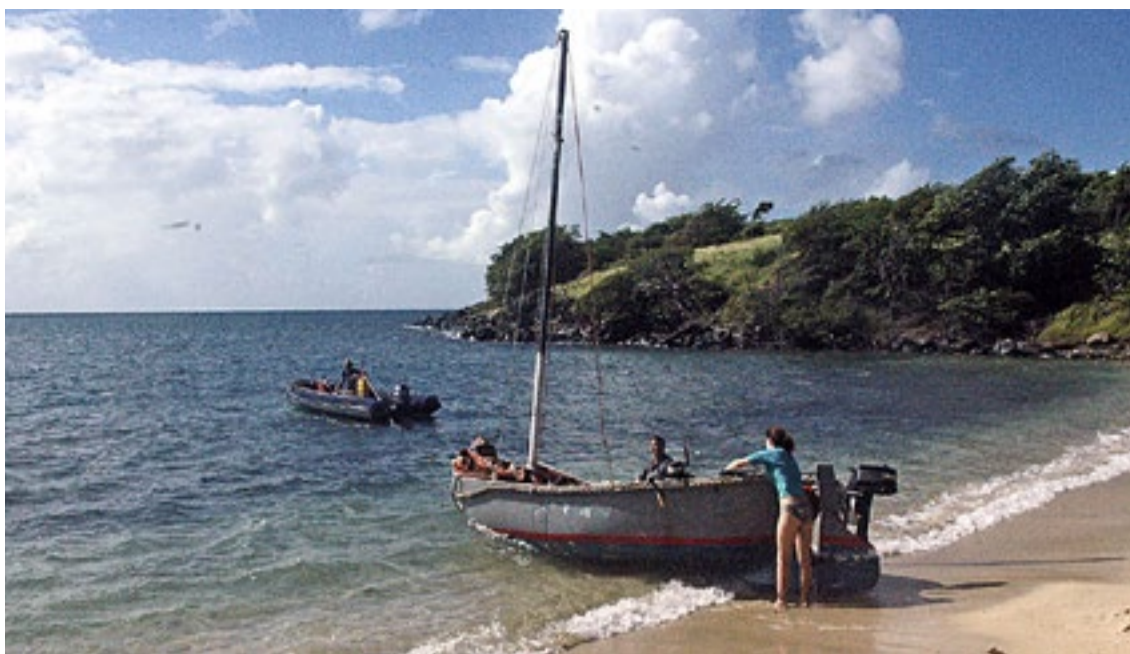
Redningsaksjonen er i gang, og vi har fått «Scrappy» på gli.

kvarter er det hverken spor etter redningsmannskap eller et duppende hode på utsida av odden. Fortsatt ikke noe svar på VHF-en, og båtene i nabobukta later heller ikke til å ha våkna til liv denne søndagsmorgenen.