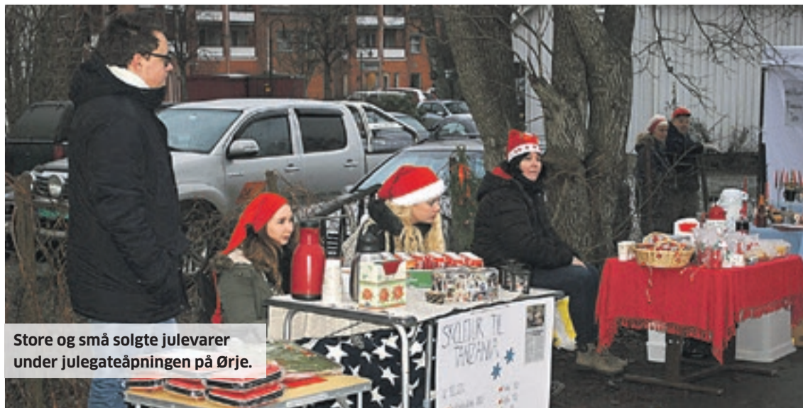
Store og små solgte julevarer under julegateåpningen på Ørje.

Vi nevner også de flinke ungdommene fra UKH, som sammen med Rødenes Bygdekvinnelag hadde egen stand på Torget i Ørje. Der laget de for åpen scene en nydelig suppe av rotgrønnsaker og kyllingkjøtt. Mange lot seg friste til å kjøpe en tallerken, og de ble ikke skuffet.