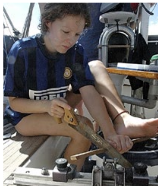
Dugnad om bord.

Som vi har merka tidligere, er Trinidad et sted hvor man lett kan gro fast. Denne gang er det faktisk ikke prosjekter på vår egen båt som holder oss her, men tilbud om jobb på andre båter ved marinaen. Slikt er alltid nyttig å få med seg. I tillegg har jakten på en ny påhengsmotor pågått helt fra vi kom hit. På Grenada var vi nemlig så dristige at vi solgte den gamle til en særdeles interessert nordmann, og man kan trygt si at det har blitt noen stående padleturer på oss siden det. Stående fordi åregaglne er defekte.