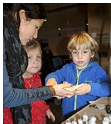
Barna i Annen Etasje barnehage i Ørje fikk spise så mange kaker de ville på Bakergaarden.