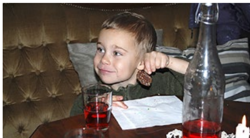
De lekreste kakebitene «fikk ben å gå på».

det konsumert saft og de lekreste kaker. Den hemmelige beundreren skal vite at gaven virkelig ble satt pris på.