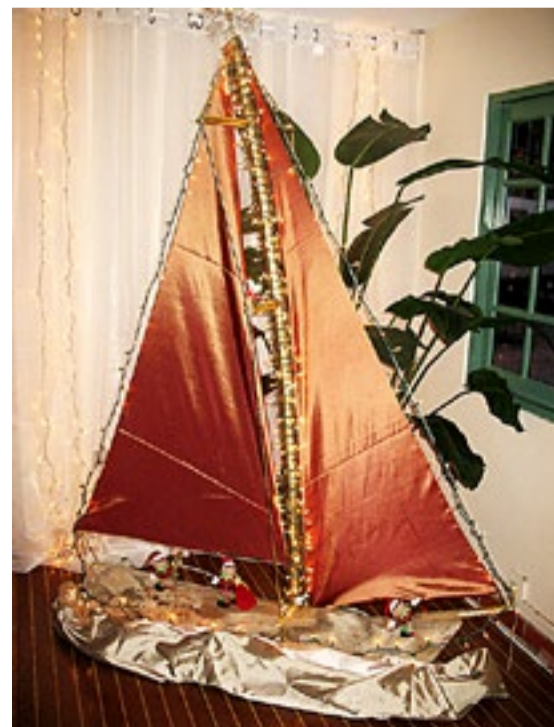
Med dette stemningsfylte bildet ønsker vi leserne en riktig god jul!