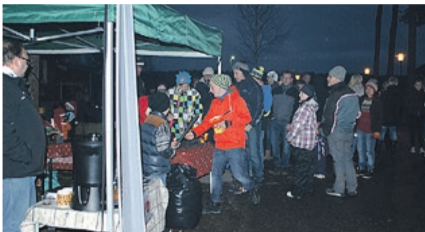
Furulund i Aremark var fylt til trengsel av julehungrige aremarkinger og et stort antall utstillere som hadde masse fint å tilby.