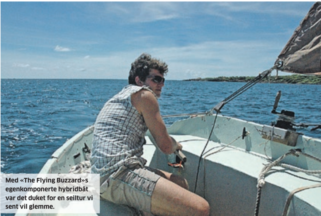
Med «The Flying Buzzard»s egenkomponerte hybridbåt var det duket for en seiltur vi sent vil glemme.

Fire måneder med henholdsvis jobbing i hjemlandet og stormvakt og vedlikehold på ankringsplassen i Grenada er historie. Nå er mannskapet lykkelig gjenforent og klare til å fortsette ferden.