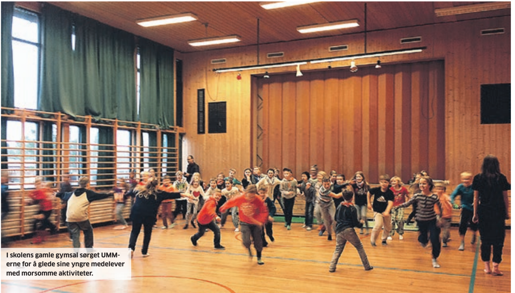
I skolens gamle gymsal sørget UMM-erne for å glede sine yngre medelever med morsomme aktiviteter.