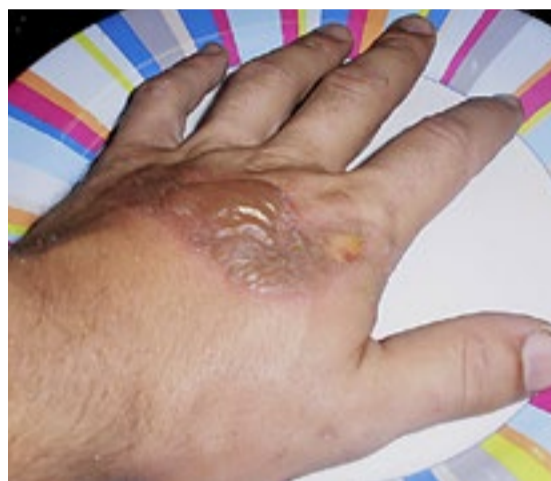
Brannskader i forbindelse med kaffekoking kommer høyt opp på lista over de vanligste kildene til ulykker ombord på en seilbåt.

I tillegg var det klart for et etterlengta opphold i marinaen for å ordne ting og tang. Det er mer komplisert når man ligger for anker.