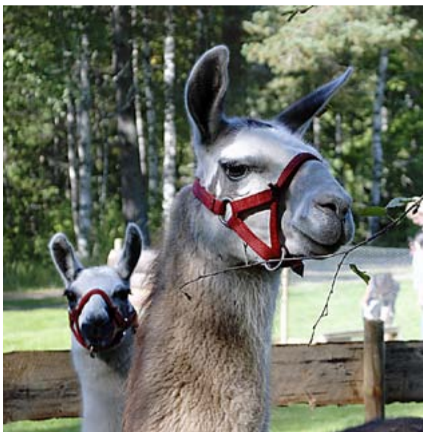
Lama er fascinerende og spennende dyr. På Kørren fikk både store og små nærkontakt.