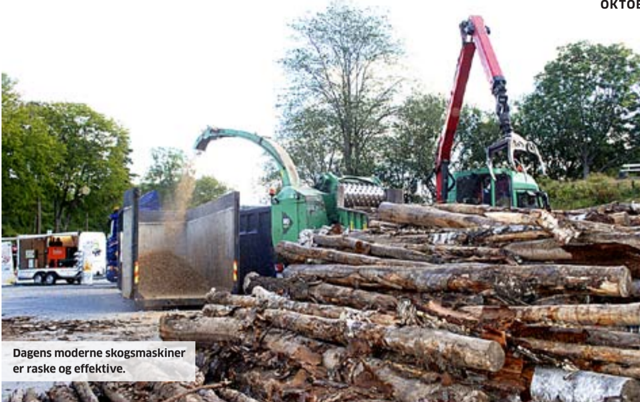
Dagens moderne skogsmaskiner er raske og effektive.