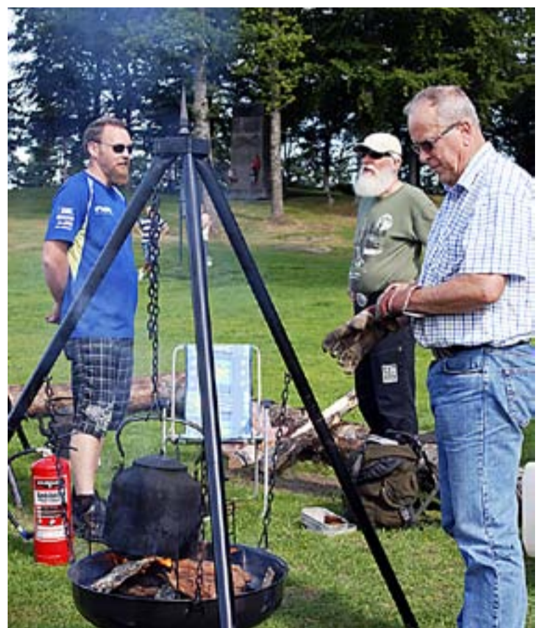
En kaffetår på ekte skogsvis. Intet smaker vel bedre enn svart kaffe rett fra bålet?

Familieskogdagen på Fredriksten var så vellykket at det er å håpe på lignende arrangementer i årene fremover. Det er ingen grunn til å vente til neste jubileum.