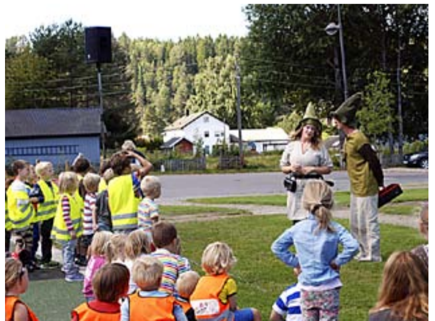
De mange fremmøtte barna fikk en liten Stubbefolk-forestilling mens de lekte i den nye parken.

parken og inviterte de mange fremmøtte barna direkte inn i lekeapparatene, mens han selv avsluttet «talen» og inviterte store og små på kommunale pølser i kommunalt brød/lompe, med kommunal saft som tilbehør. Ekstra morsomt var det med en mini-forestilling av Stubbefolket. Kort sagt en strålende åpning i strålende vær. Og nok et eksempel på at Marker får det til. For ved siden av lekeparken ligger den flotte skatebanen, som ble åpnet tidligere i år. Bortenfor har vi sandvolleyballbane og enda noe til. For ikke å snakke om den store idrettshallen og det imponerende kunstgressanlegget. Med skolen og rådhuset som nærmeste nabo er Ørje sentrum virkelig blitt et barne- og ungdomsvennlig sted å være. Også for ventende foreldre og foresatte.