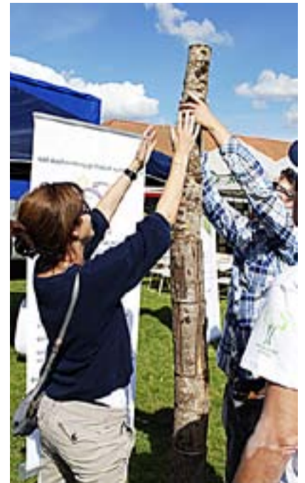
Ikke lett å stable vedkubber når det blir mange av dem...