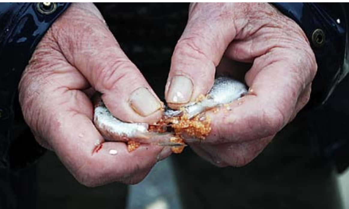
En liten knekk, og flott rogn i betydelige mengder kommer ut. Med kyndig bearbeiding blir det lekker kaviar som i smak kan måle seg med hva som helst.