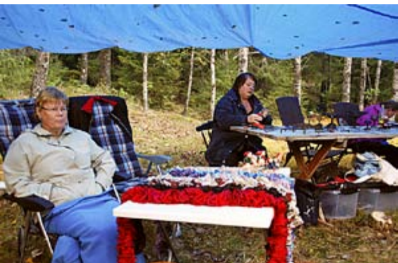
Taterne har alltid vært dyktige håndverkere. Disse damene demonstrerte ulike teknikker.