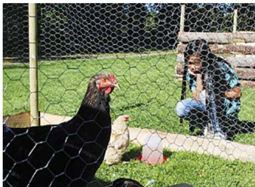
Barn og dyr - en uslæelig kombinasjon.