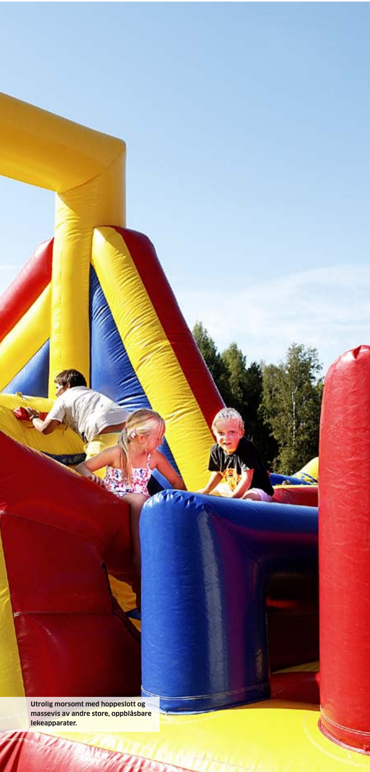
Utrolig morsomt med hoppeslott og massevis av andre store, oppblåsbare lekeapparater.