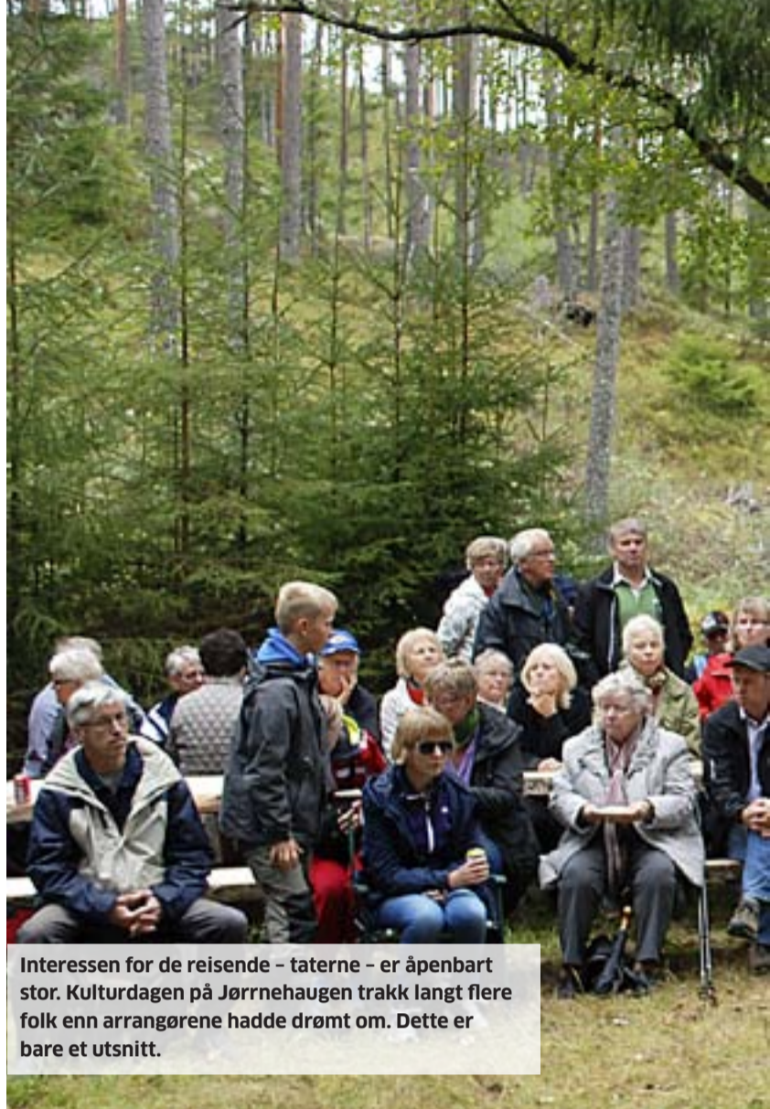
Interessen for de reisende – taterne – er åpenbart stor. Kulturdagen på Jørnehaugen trakk langt flere folk enn arrangørene hadde drømt om. Dette er bare et utsnitt.