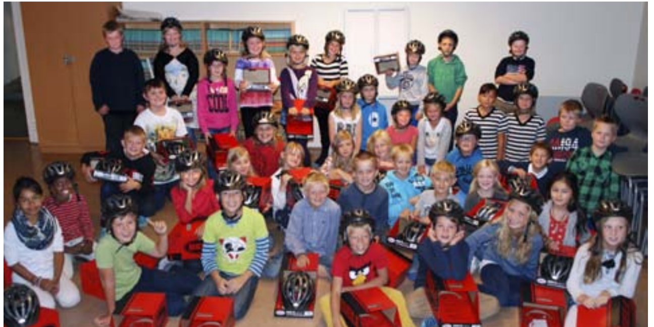
En flott gjeng med fjerdeklassingene i Marker ble både glade og stolte da de fikk hver sin flotte sykkelhjelmer av Gjensidige Marker.

I neste utgave av Avisa Grenseland skal vi presentere fjerdeklassingene i Rømskog og Aremark med sine nye sykkelhjelmer.