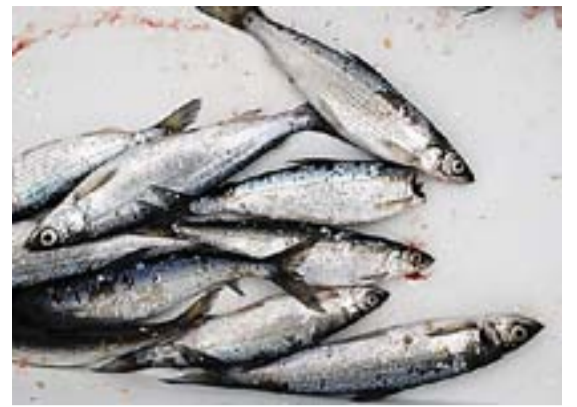
Slik ser den ut, lagesilda, som byr på Femsjøens ukjente delikatesse; kaviar.

Lokale patrioter hevder at den smaker bedre enn sin langt mer berømte russiske slektning. Og vesentlig billigere blir den også, for råvarene hentes med egne hender opp fra Femsjøen. Denne idylliske innsjøen helt nederst i Haldenkanalen.