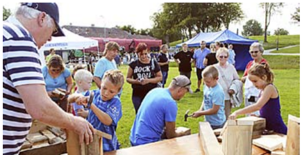
Barnas favorittstand under skogdagen på Fredriksten. Her fikk alle snekre så mye de ville.