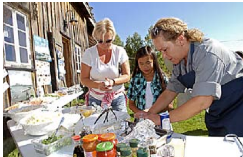
Godfisk tilbød lekkert dandert sjømat direkte fra grillen.