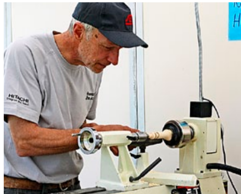
Lokale håndverkere fikk vist både ferdigheter og ferdige produkter.