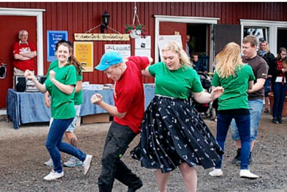
Unge dansere fra Aremark sørget for danseoppvisning.