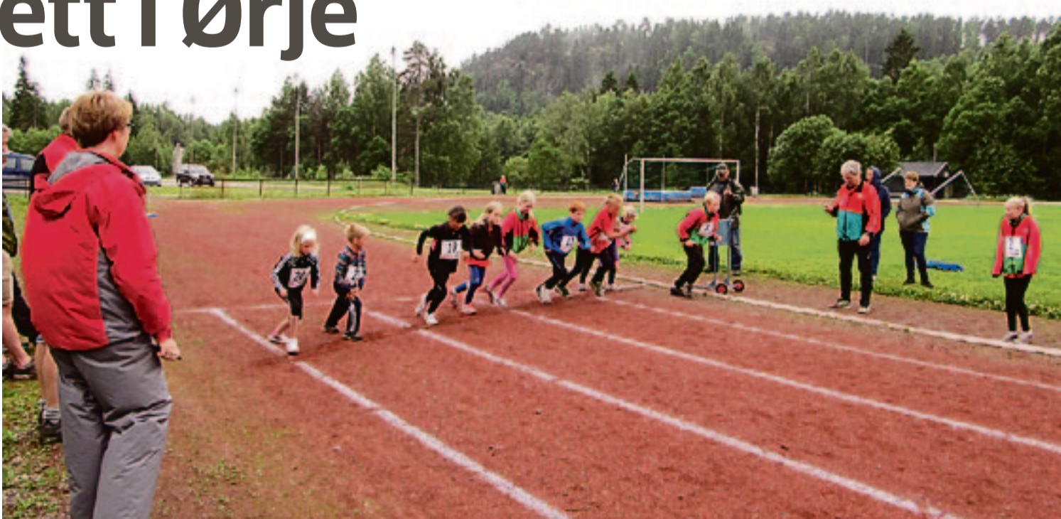
Samtlige deltakere gjorde en stor innsats under Markermesterskapet i friidrett.

På programmet sto 60 meter for alle klasser, høyde G/J 7-10 år, høyde G/J 11-14 år, kule G/J 11 år og eldre, lengde G/J 7-10 år, spyd G/J 11 år og eldre, lengde G/J 11 år og eldre og til slutt 800 meter for alle klasser.