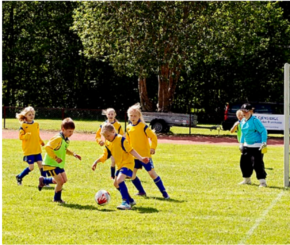
Ikke noe å si på innsatsen fra de mange knøttetotballspillerne under G-Sport-turneringen på Ørje.