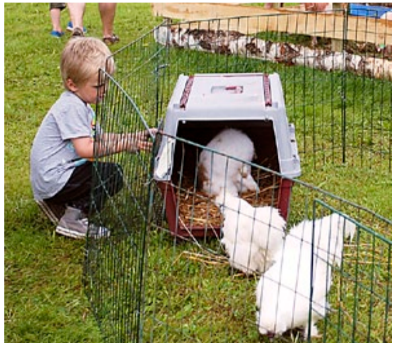
Spennende med dyr. Og på bondegårder er det alltid dyr. Åpen Gård kunne by på høner, griser, sauer, hester og storfe.