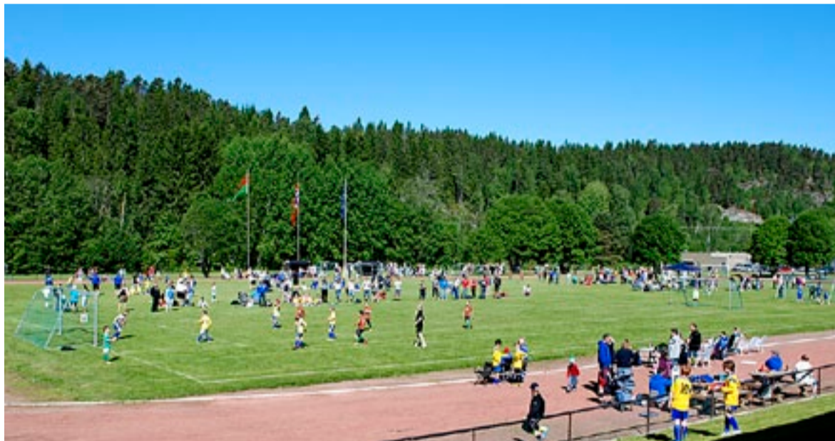
Marker Idrettspark sydet av liv da den årlige knøttetturneringen ble arrangert i strålende sommervær.

I tillegg til det sportslige, var det populært for både deltakere, foreldre og andre publikummere å kunne nyte både forfriskninger og grillmat fra selvbetjente griller.