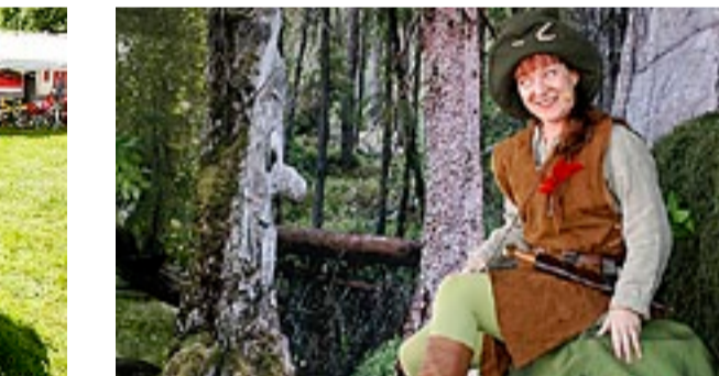
Stubbefolket serverte en spennende forestilling fra hovedscenen.