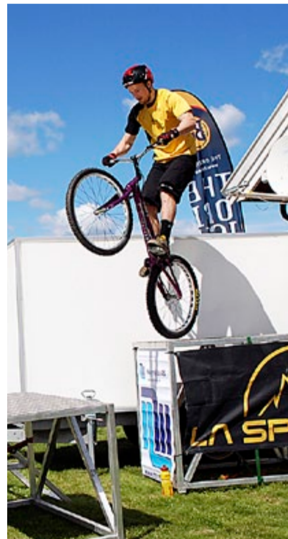
Spektakulære sykkelstunts fikk folk til å måpe av beundring.