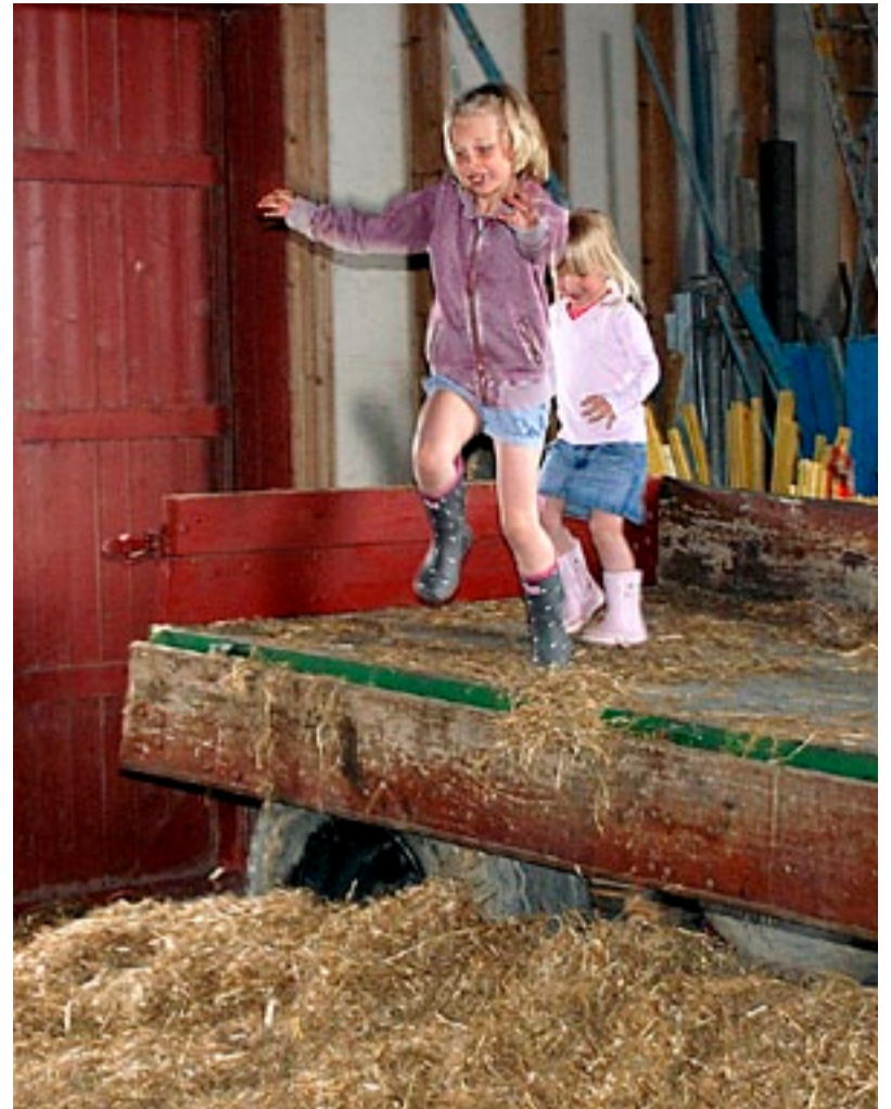
Det hører med å hoppe i høyet når man er på en bondegård.