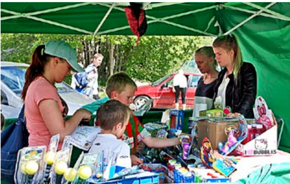
Det er mer enn fotball som frister når store og små er med på en fotballturnering som varer hele dagen.