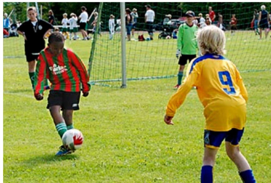
Denne unge gutten fra Ørje IL gjør alt riktig; ser på ballen, har god balanse og sender innsiddepasningen til en medspiller.