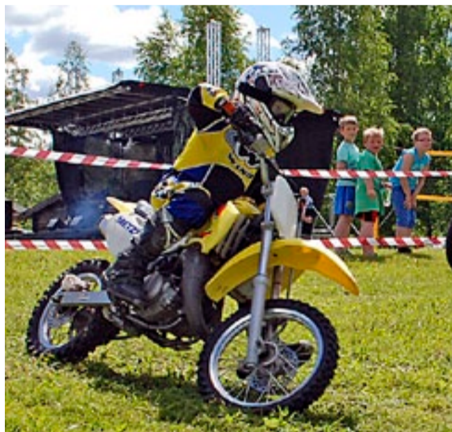
Det var populært å kjøre motorsykel, ikke minst med en NM-vinner som instruktør.