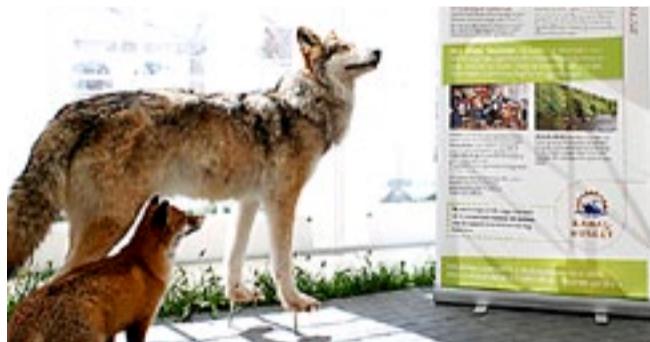
Ulv i Grenseland. Her en utstoppet variant fra standen til Haldenvassdragets Kanalmuseum.