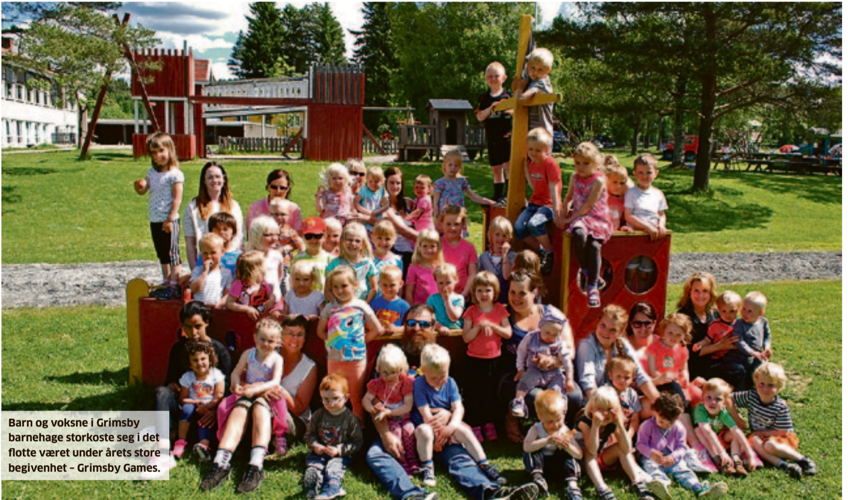
Barn og voksne i Grimsby barnehage storkoste seg i det flotte været under årets store begivenhet - Grimsby Games.