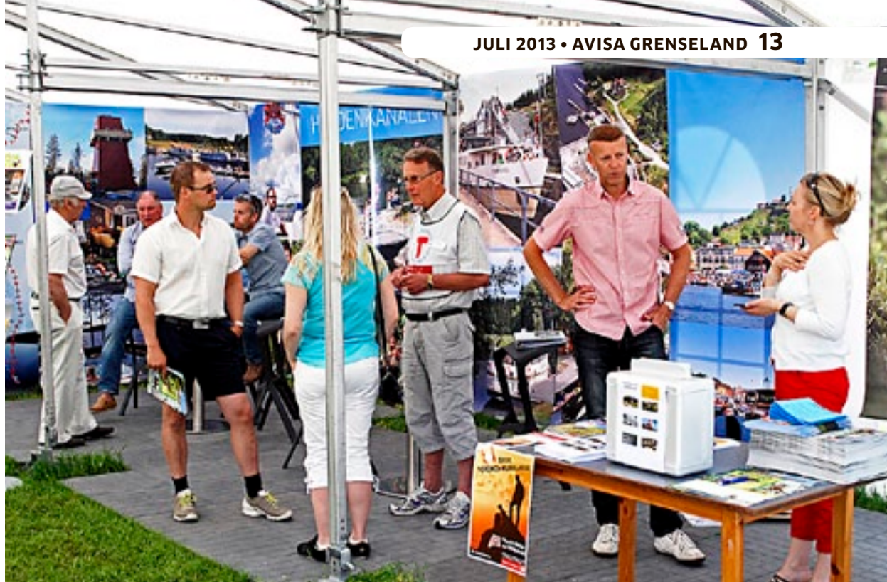
Regionalpark Haldenkanalen fikk vist seg frem på en stor og flott stand.