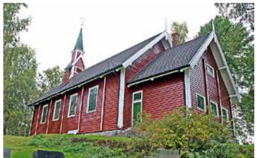
Holmgill kirke i Bjørkebekk er blitt malt utvendig.

Mye av jobben er finansiert gjennom et lån som menighetsrådet har tatt opp til formålet. Resten er oppsparte midler og en betydelig dugnadsinnsats.