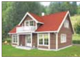
Veslesmeden kr 2.396.000,-