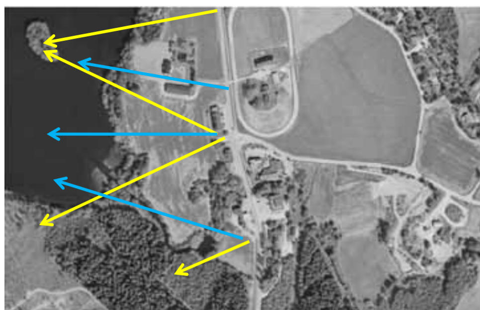
Siktlinjer i landskapet