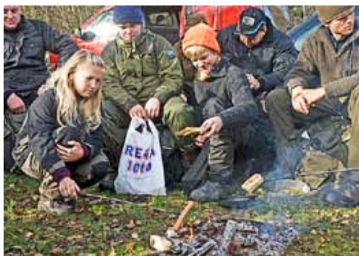
Lunsj ved bålet. Den yngre garde blir gjerne med på jakt.