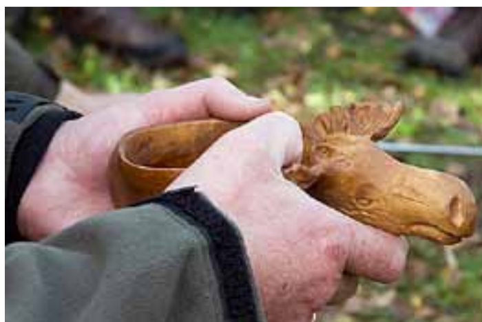
Skogens konge til kaffen.