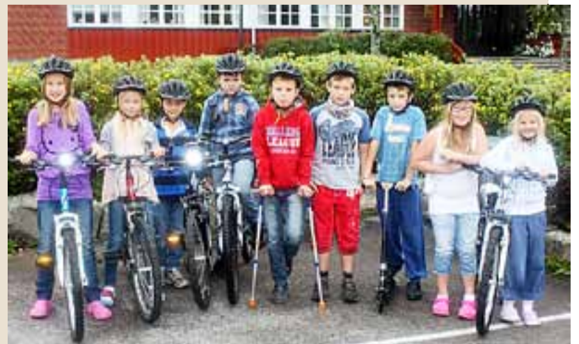
4.-klassinger ved Rømskog skole med nye hjelmer.