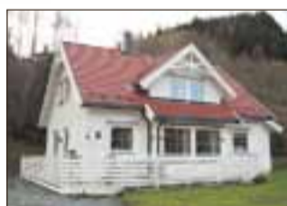
Skauthø kr 2.356.000,-