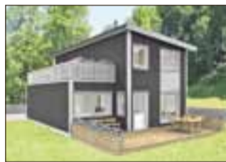
Spiterhøy kr 2.110.000,-