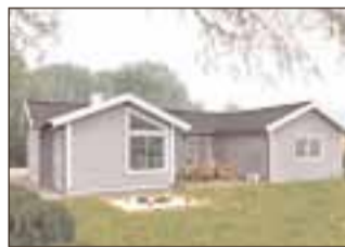
Ringstind kr 2.086.000,-