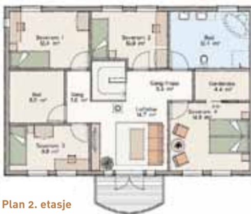
Plan 2. etasje