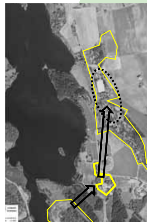
Senter «Nord» Fritid &amp; Utdanning