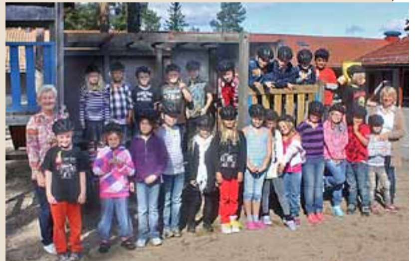
4.-klassinger ved Aremark skole med nye hjelmer.

Tradisjonen tro har Marker Gjensidige Brannkasse delt ut sykkelhjelmer til alle 4.-klassingene i Rømskog, Marker og Aremark. I forrige utgave hadde vi bilde av noen elever i Marker. Her er elever i Aremark og Rømskog med nye hjelmer.