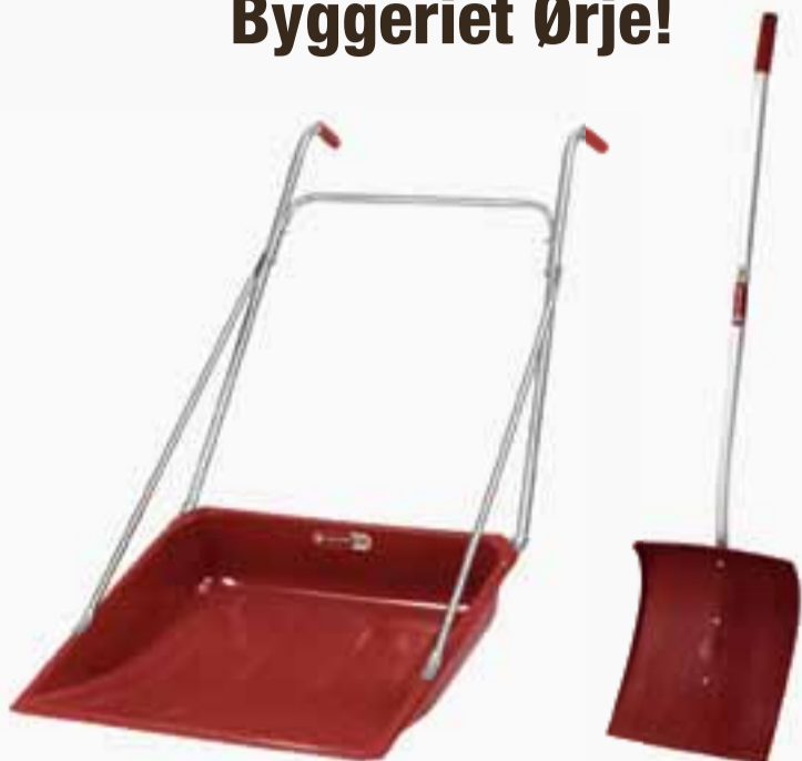
Snørydder stor belagt Fiskars 9088