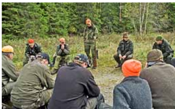
Hva nå? Laget etter det andre drevet. Heretter løsnet det - bokstavelig talt. To piggokser ble felt den første dagen i elgjakta.