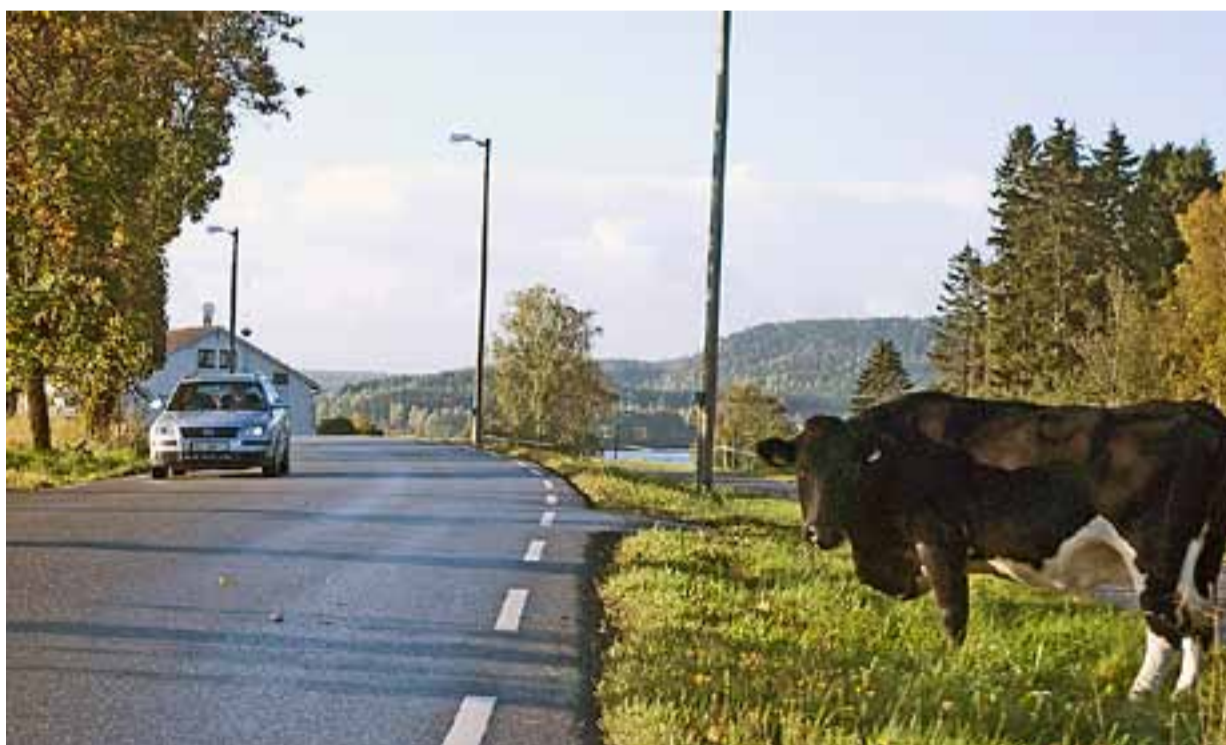
Denne kua nyter friheten på landet.

Alltid hyggelig å være på landet og nyte synet av beitende dyr, som her ved Solstrand Terrasse like syd for Ørje sentrum. Her om dagen synes denne kua at nok var nok – gresset var jo grønnere på den andre siden av gjerdet. Eller rettere sagt i veikanten. Kua så ut til å storkose seg mens resten av flokken ropte småforstyrret etter rømlingen fra innsiden av gjerdet. Den tilsynelatende fornøyde kua forsynte seg langs riksvei 21 i noen timer og rautet intenst til en og annen bil som kjørte pent forbi.