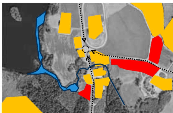
Oversiktsplan «Syd 1»