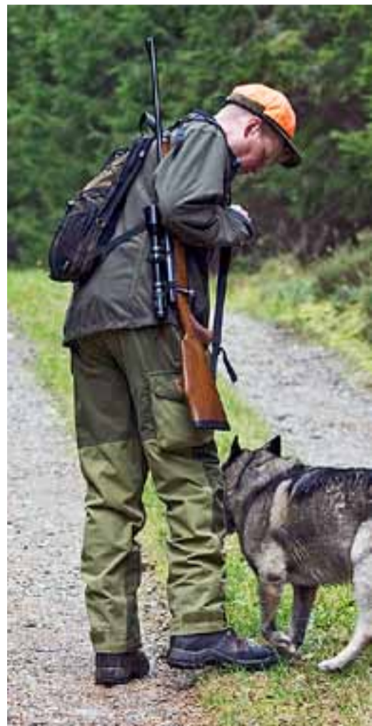
– Her var elgene, konstaterer jaktlederen.