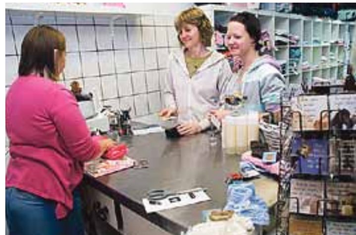
Mange mammaer fant veien til den nyåpnede butikken.