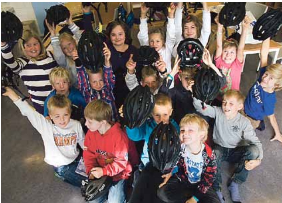
4B i Marker med sykkelhjelm.