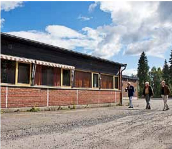
- Her mangler det bare én ting: initiativ! Sier Eng.