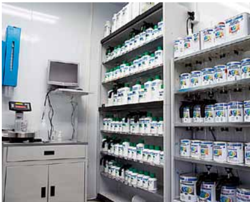
Et helt nytt og strøket blandingsrom står klart til bruk.

- Det har alltid vært en liten drøm å drive for meg selv.