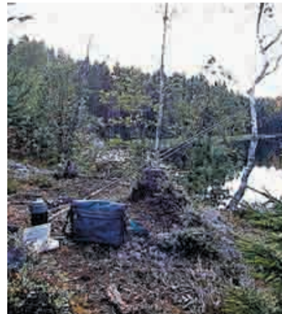
Det er mange som benytter seg av mulighetene for fiske og friluftsliv i Vestfjella.