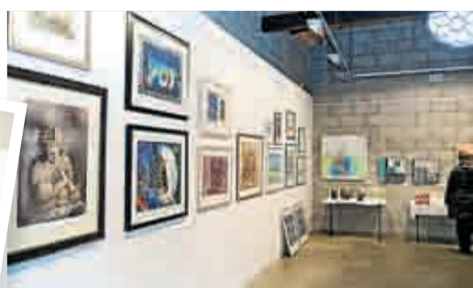
Variert salgsutstilling på Galleri Ørje Brug.