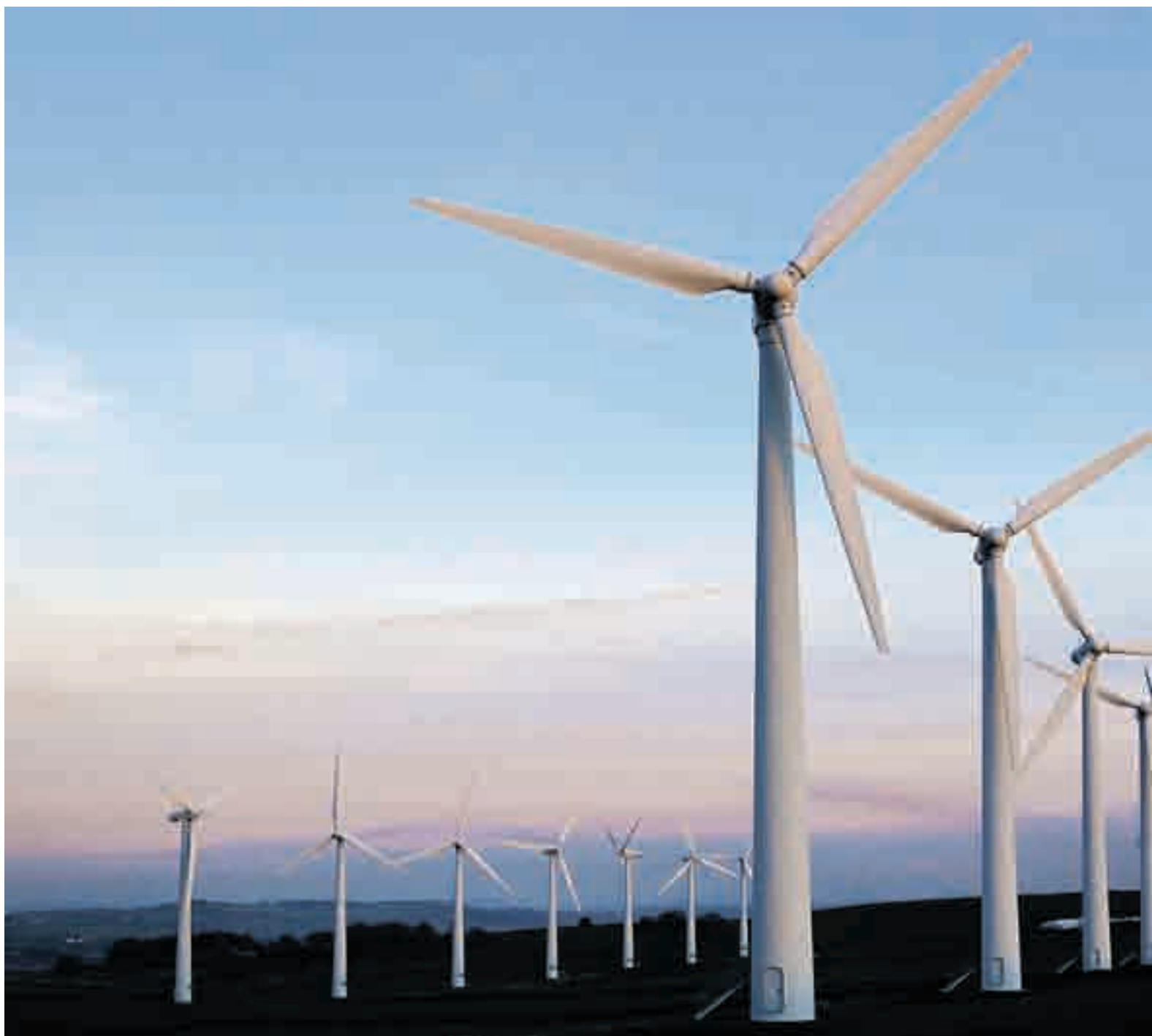
Vindmøller har en dominerende posisjon i landskapet.