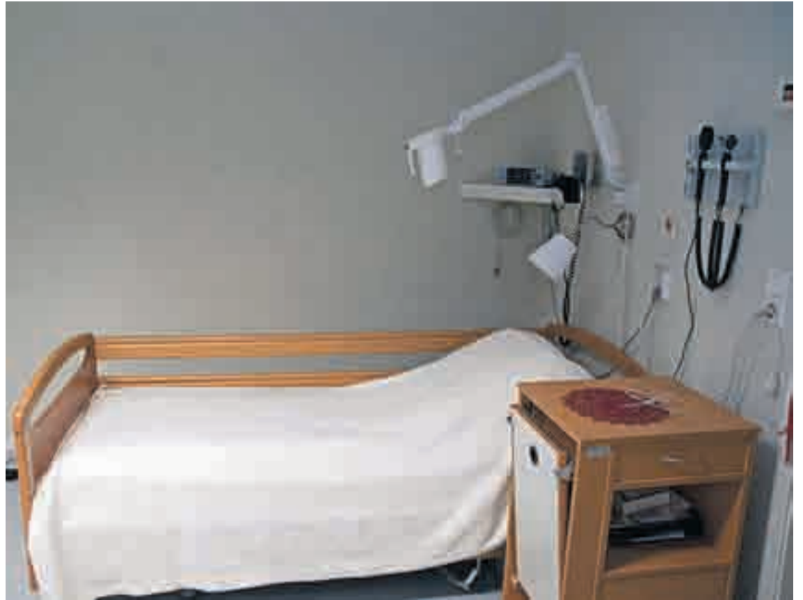
Det nye korttidsrommet ved sykehjemmet i Rømskog. Her var det blant annet garderobe før.