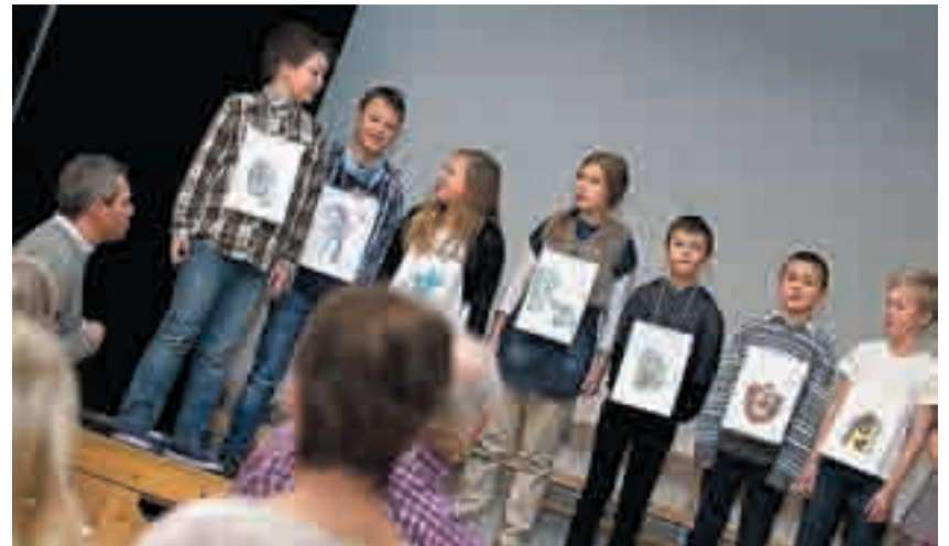
Flinke elever fikk vist frem sine engelskkunnskaper gjennom sang fra scenen i gymsalen.

Rømskog skoles førjulsfest for pensjonister har gjennom årene blitt til en høyt verdsatt tradisjon. Første gang festen ble arrangert var midt på 1980-tallet. Innholdet har blitt noe forandret med årene. Men hensikten er fortsatt den samme; å skape en hyggelig arena hvor rømsjinger treffes på tvers av generasjonens skiller. Ikke tvil om at besteforeldre nøy synet av flinke barnebarn som stolt sto på scenen og sang. Og ikke tvil om at barna synes det var stas at bestemor og bestefar, eller oldemor, kom for å se på dem!