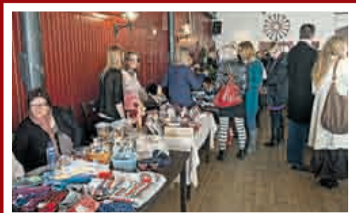
Årets julemesse på Ørje Brug var godt besøkt.