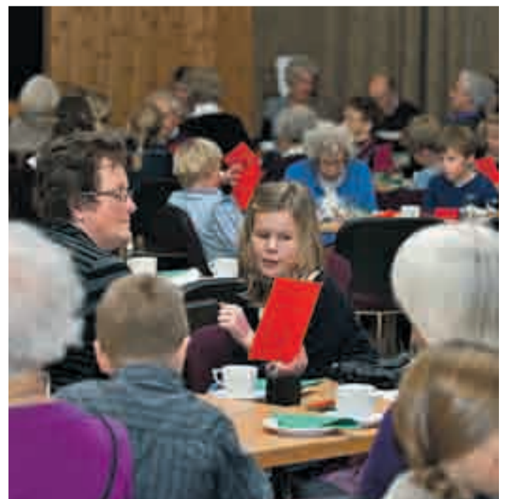
I gymsalen var bordene dekket, og barna hadde lagt bordkort til seg selv. Innimellom underholdningen fra scenen, var det sang av diverse kjente og kjære julesanger.