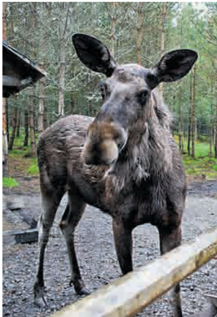
Elgen skal igjen stå i sentrum når det inviteres til en novellekonkurranse i forkant av neste år Elgfestival.

Vi tipper at boka vil gå som varmt hvetebrød når den skal selges på Elgfestivalen i Aremark 7., 8., og 9. september 2012.