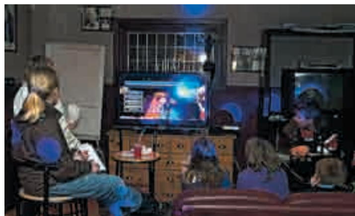
Tv-spill er populært på Myrland.