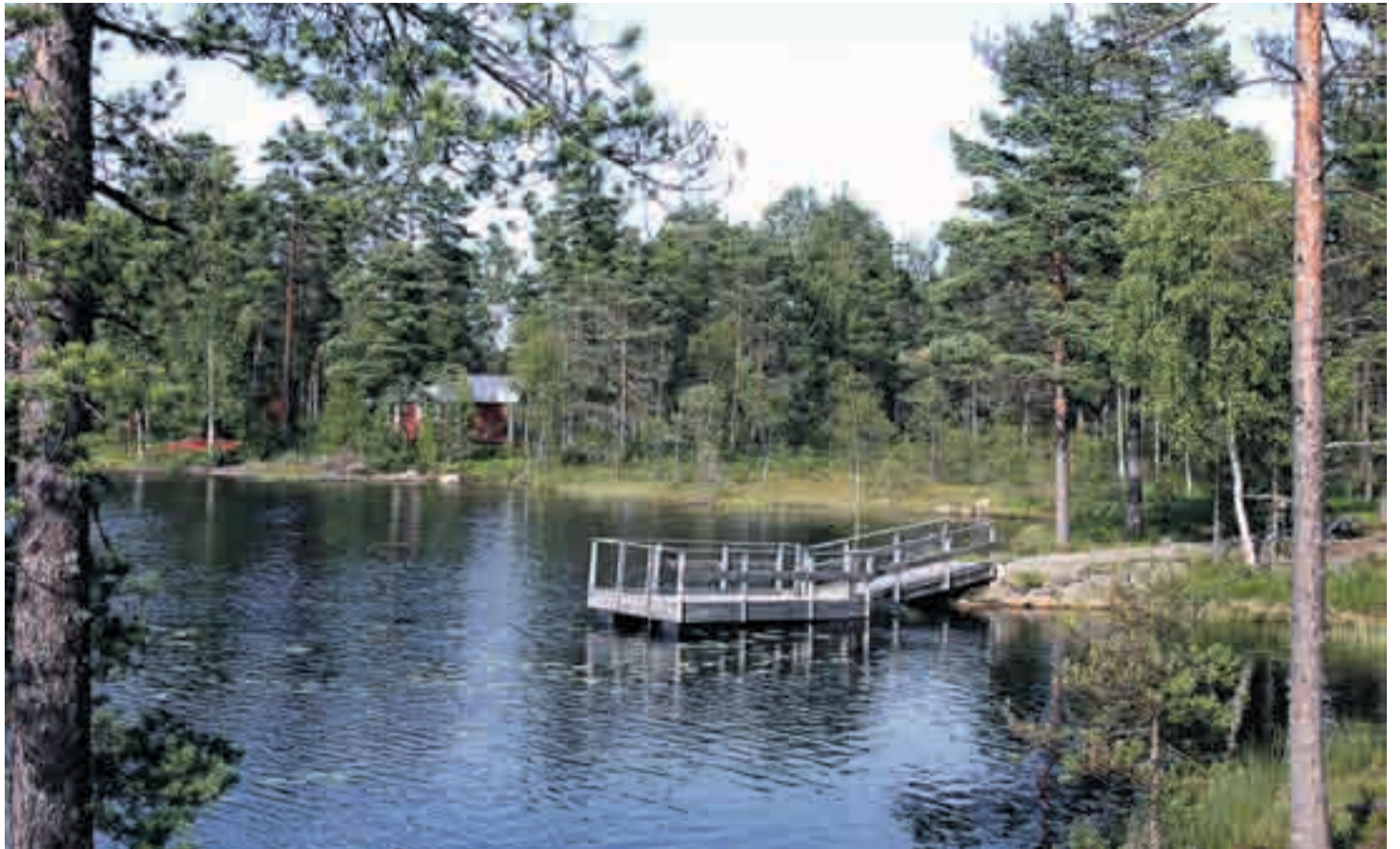
Vestfjella byr på en rekke naturperler. Disse vil påvirkes kraftig av en vindmøllepark.