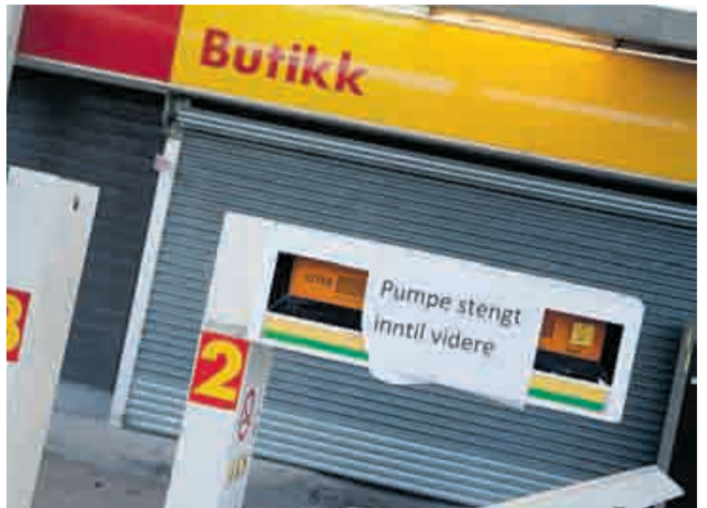
Lappen på bensinpumpa i Aremark er snart historie. Shell blir til Best på nyåret. Senest 1. april er det igjen bensinstasjon i full drift i bygda.

Åpner klokka seks. Utvidelsen av stasjonen på cirka femti kvadratmeter skjer på baksiden av den eksisterende butikkdelen, på høyde med vaskehal-