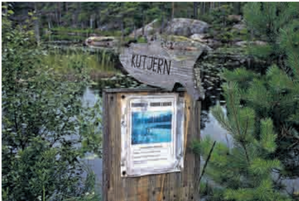
Kutjern er ett av veldig mange små fiskevann som preger Østfolds største uberørte villmark - Vestfjella.