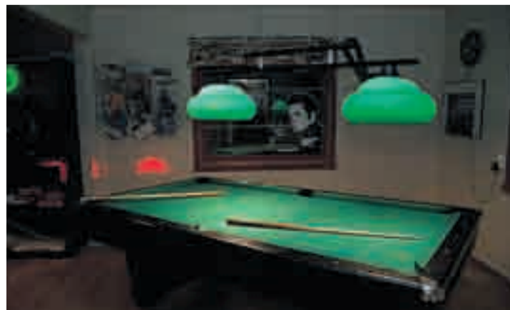
Biljardbord skal det være på et sted som dette.