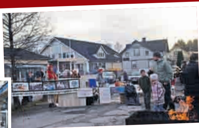
Tradisjonen tro deltok speiderne i Marker under julegateåpningen i slutten av november. Mange var innom julemarkedet.