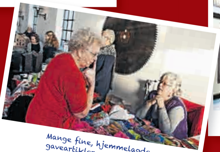
Mange fine, hjemmelagde gaveartikler var til salgs.