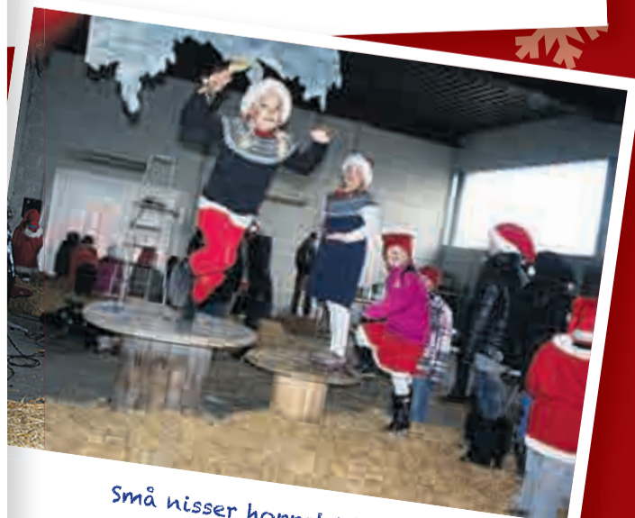
Små nisser hoppet i høyet.