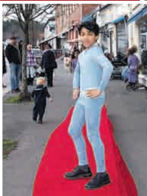
Moteshow med visning av vinterens barnemote i regi av Mamsen & Mini med unger var et artig og nytt innslag under julegateåpningen i Ørje.

Helt i slutten av november var det igjen tid for julegateåpning og tenning av juletreet i Ørje. Her kommer noen glimt fra arrangementet.