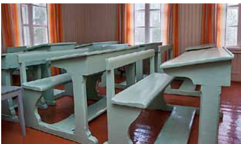
Skolestua på Trosterud.