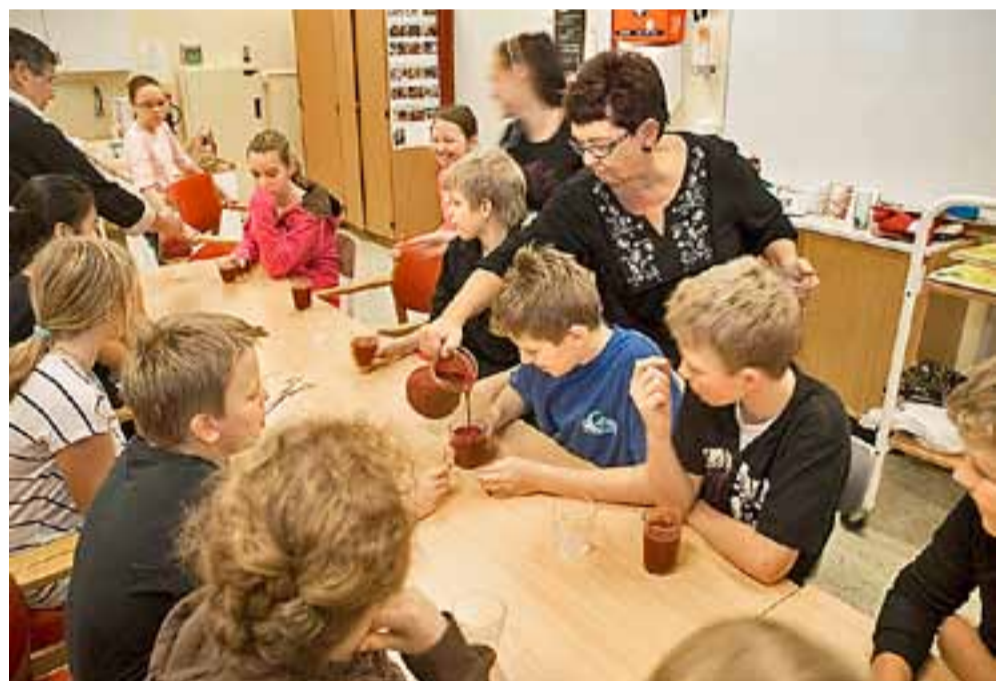
Egenprodusert smoothie til hele klassen.