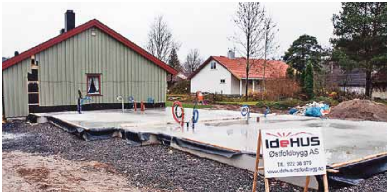
Firmaet har flere jobber lokalt i Ørje. De tar på seg byggeprosessen fra A til Å.