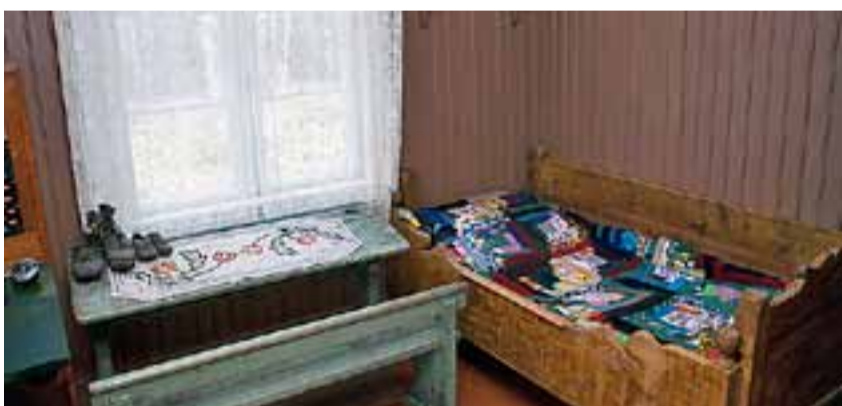
Soveværelset til læreren i riktig gamledager.