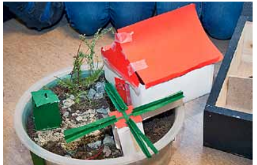
Denne postkassa sender posten direkte til huset. Man trenger ikke å hente posten ute lenger.

Elevene ble veldig overrasket og glad for at de gikk videre med sine prosjekter, og de gleder seg til messa i april neste år.