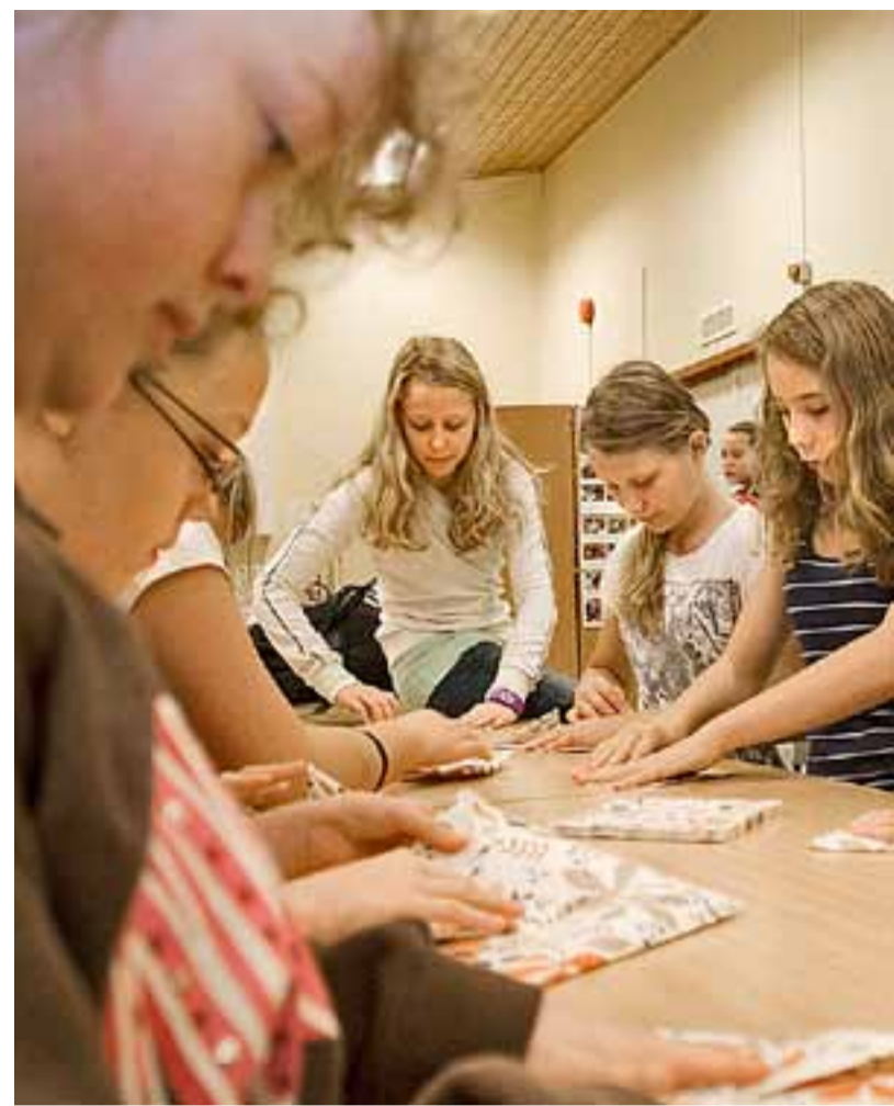
Jentene bretter serviettene.