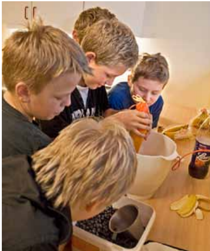
Gutta er ivrige når de samarbeider om å lage smoothie med blåbær til hele klassen.