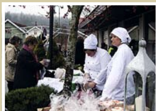
Blide bakere med gode tilbud på bakervarer som gikk som varmt hvetebrød.