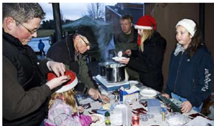
Grøten til Kvisler 4H smakte bra i ruskeværet.