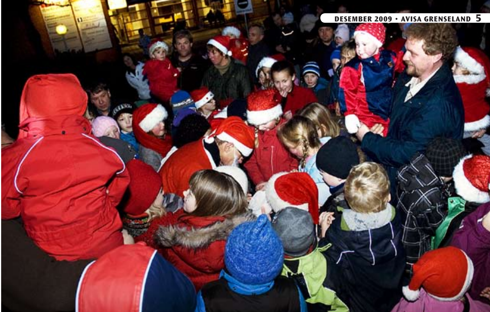
Store og små nisser sikret seg godteposer da julenissen var i Aremark i forbindelse med juleveipningen.