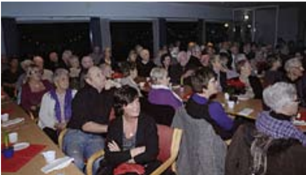
Allsang er populært som aldri før, og helt opp mot 150 mennesker har flokket seg når Skogstad og hans ensemble har slått an tonen i høst.