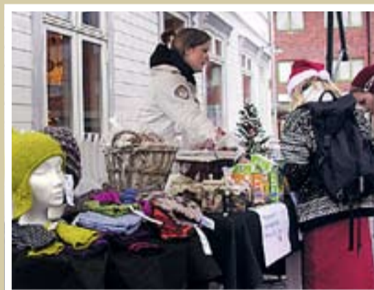
Luer og andre duppeditter i Ørje.