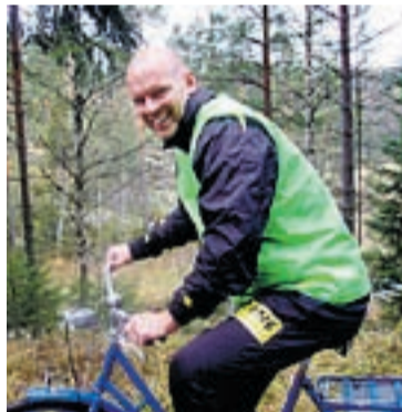
Lillestrøms kjente trener Henning Berg på sykkel.