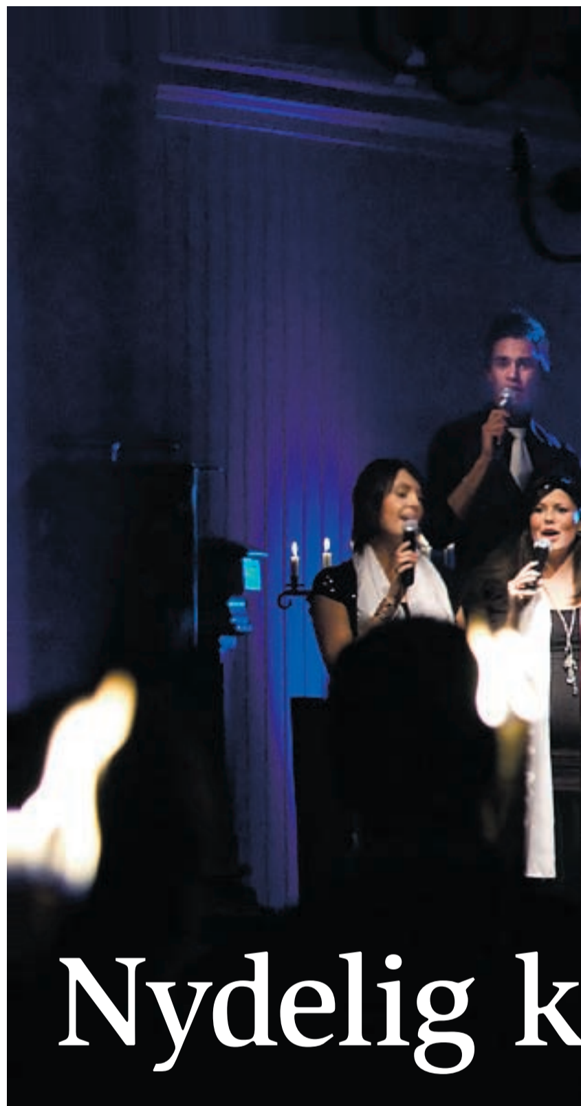
Sound of Sisters holdt en nydelig konsert i en fullsatt Øymark kirke søndag 6. desember.

Sound of Sister har for tredje året på rad levert en strålende julekonsert. I likhet med fjoråret ble konserten holdt i Øymark kirke, som var fylt til randen og vel så det.