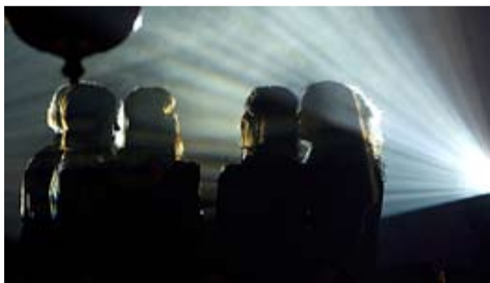
Stemningsfullt i kirken. Sangere, musikere, og lyssettere gjorde en strålende jobb.