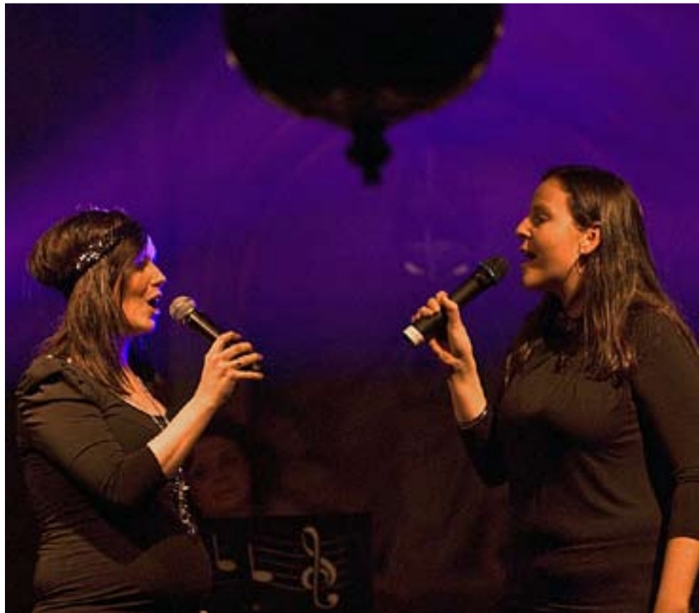
Repertoaret bestod for det meste av stemningsfulle svenske og norske julesanger.