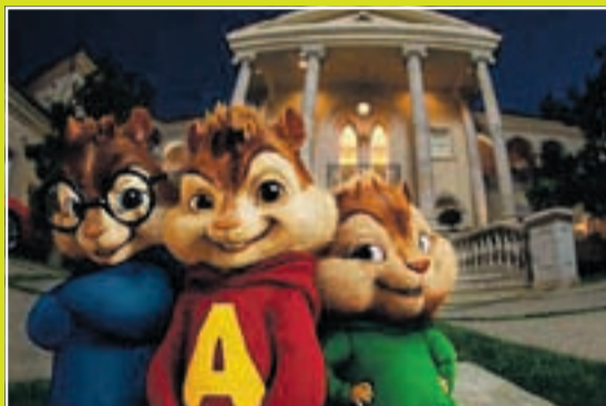
«Alvin og gjengen 2» vises i januar på Bygdekinoen i Rømskog og i Marker.

Onsdag 6. er det Bygdekino i Marker rådhus. Filmene som vises er «Alvin og gjengen 2» og «2012».