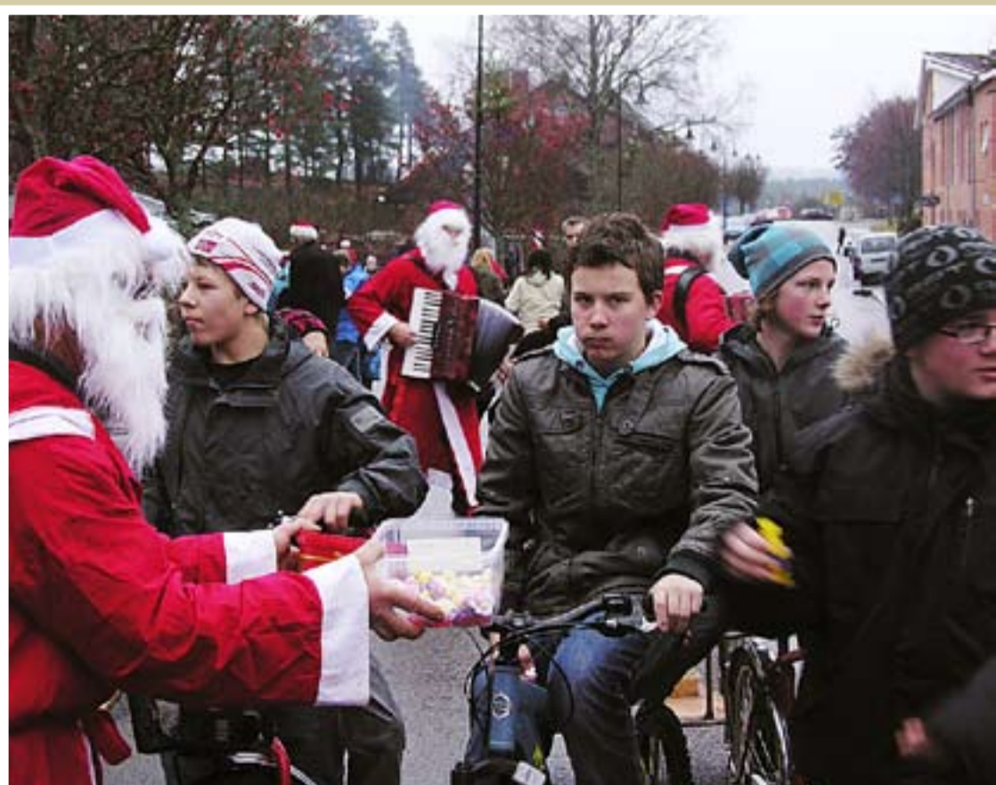
Populære nisser med godsaker. Og musikk- og sangnisser i Ørje sentrum under julegateåpningen 28. november.