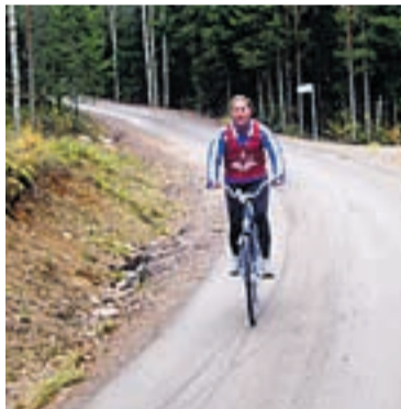
Syklingen gikk greit.