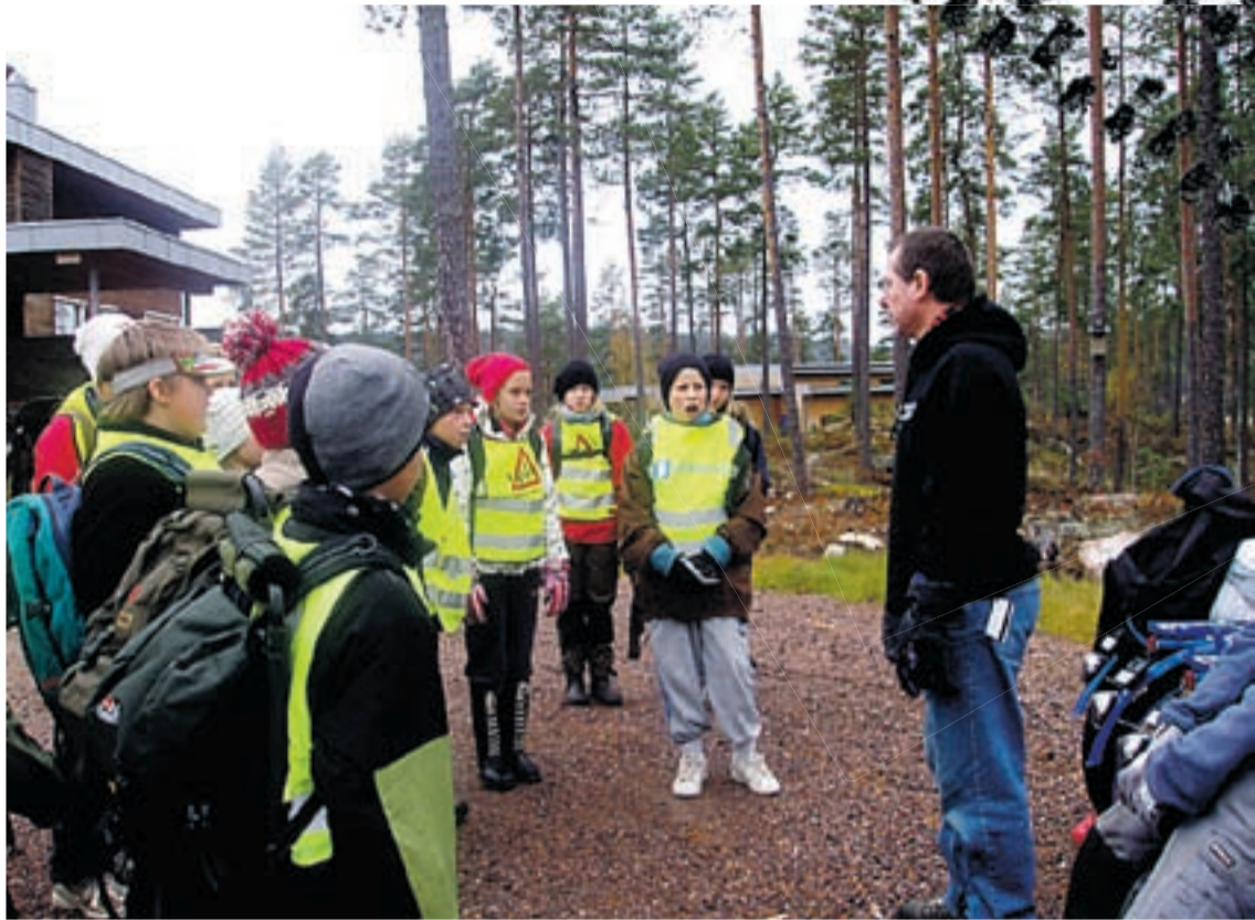
6. og 7. klasse får informasjon om hva de skal gjøre.

Så måtte vi dra til skolen for å ha siste time.